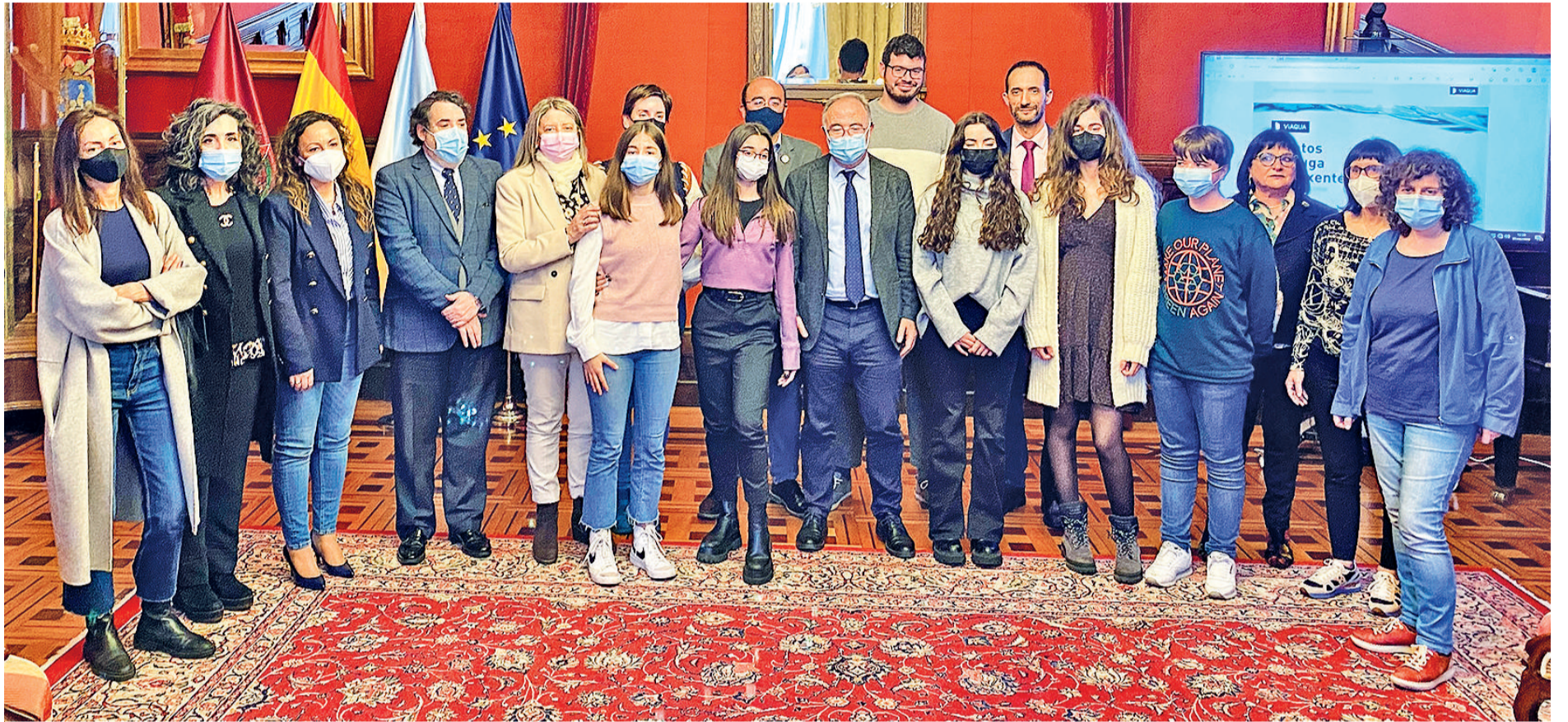
Alumnos premiados con las autoridades, miembros del jurado y directivos de Viaqua en el pazo de Raxoi durante la entrega de premios del certamen literario Relatos de Auga Intelixente