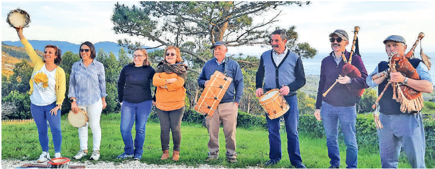
SON DE GAITA ACTUÓ EN CARNOTA Y EN TOURO. Los componentes del grupo Son de Gaita, del municipio de Boqueixón, están recuperando poco a poco su actividad después de casi dos años con escasa actuaciones a causa de las restricciones marcadas por la pandemia del coronavirus. Durante esta Semana Santa animaron una fiesta privada en Carnota y días después actuaron en San Miguel de Vilar, en Touro, con motivo de la celebración de San Antonio.