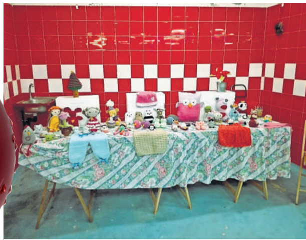
Posto do Mercado de Nadal de Malpica.

Malpica. O Concello de Malpica impulsa a campaña "Merca Local no Nadal" para dinamizar o pequeno e mediano comercio e a hostalaría, dende o pasado 15 de decembro do 2020 ata o 5 de xaneiro de 2021. Nel, as PEME locais pertencentes a todo tipo de sectores.