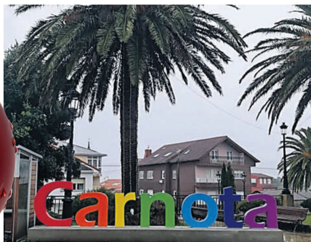
Novo cartel que luce á entrada do municipio.

Carnota. A pesar do ano atípico e difícil que se está a vivir, o concello de Carnota non quixo deixar de celebrar o seu Nadal, unhas datas que animan o ánimo aos seus veciños e que incitan a ser positivos. Polo tanto, dende o departamento de Cultura e o servizo de Normalización Lingüística, prepararon un programa de actividades que xa comezou o pasado once de decembro.