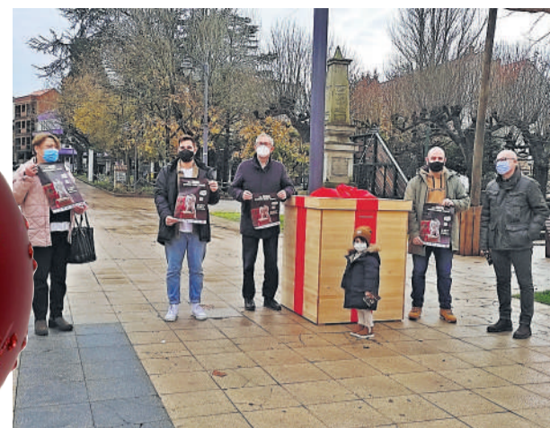
Presentación da campaña no concello de Carballo.

Santiago. Este Nadal os concellos da Costa da Morte propuxéronse defender o seu comercio local. Esta comarca, cada vez máis seleccionada polos visitantes de toda Galicia e do resto de España polas súas potencialidades, quere por en valor os seus establecementos e para iso están xurdindo iniciativas de todo tipo. O obxectivo prioritario é o de os veciños e veciñas aposten nas súas compras de Nadal por mercar nos comercios máis próximos.