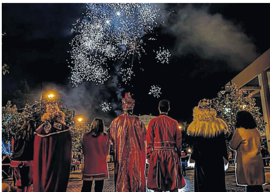
Imaxe da visita dos Reis Magos a Cee no 2020. Este ano non se poderán achegar aos máis pequenos, aínda que si que os visitarán e mesmo falarán con eles polo móbil.

de Cultural da Deputación da Coruña, este pasado domingo 13 de decembro xa se representou a obra Sós , de Mala-sombra Teatro. Esta inauguración da actividade de Nadal continuou o sábado 19, no Auditorio, con Bo Lyric Nadal , de Vento Doce, unha proposta da Rede Galega de Teatros e Auditorios. Logo desta apertura, xa cos cativos de vacacións escolares, o vindeiro xoves 24, día de Noiteboa, Papá Noel visitará as diferentes parroquias do concello. Debido á pandemia da covid-19, manterase en todo momento a distancia social e non se tirarán caramelos. A comitiva arrincará en no campo da festa de Gures, ás 11.00 horas, e percorrerá, de maneira continuada e ao longo da mañá, Ameixenda, Brens, Camiños Chans, Toba de Abaixo, Estorde, Lobelos, Morancelle, Vilanova, Codesos, Pereiriña, Pereira, Por-