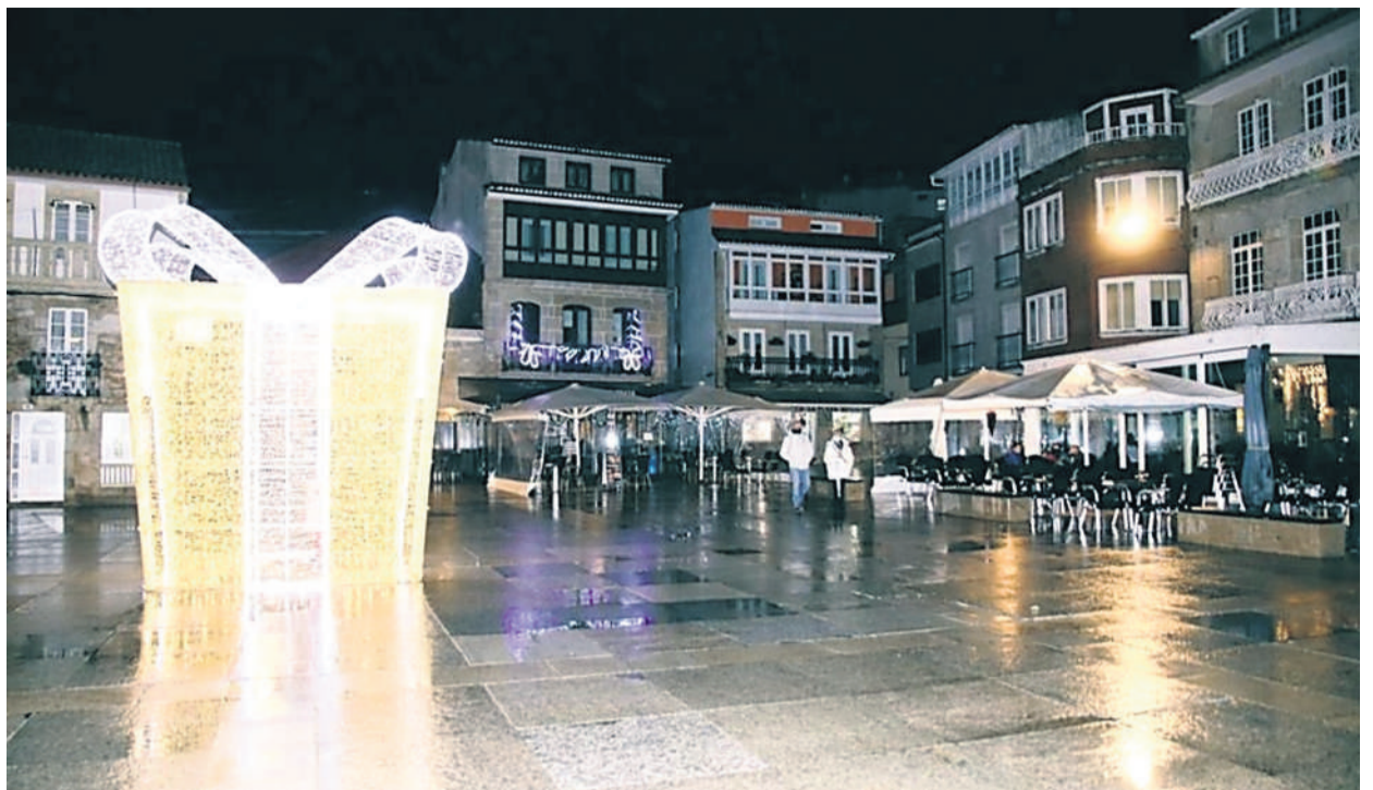
Entre a ornamentación, instaláronse unhas caixas de correos máxicas para depositar as cartas a Papá Noel e aos Reis.

En relación cos cativos, levarase a cabo unha iniciativa solidaria, baixo o nome Nadal Máxico, Nadal Solidario ,