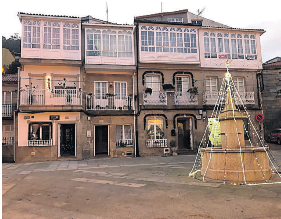
Iluminación de Nadal no casco histórico, a cal se acendeu o 5 de decembro.

As primeiras citas do Nadal xa se levaron a cabo dende o pasado tres de decem-