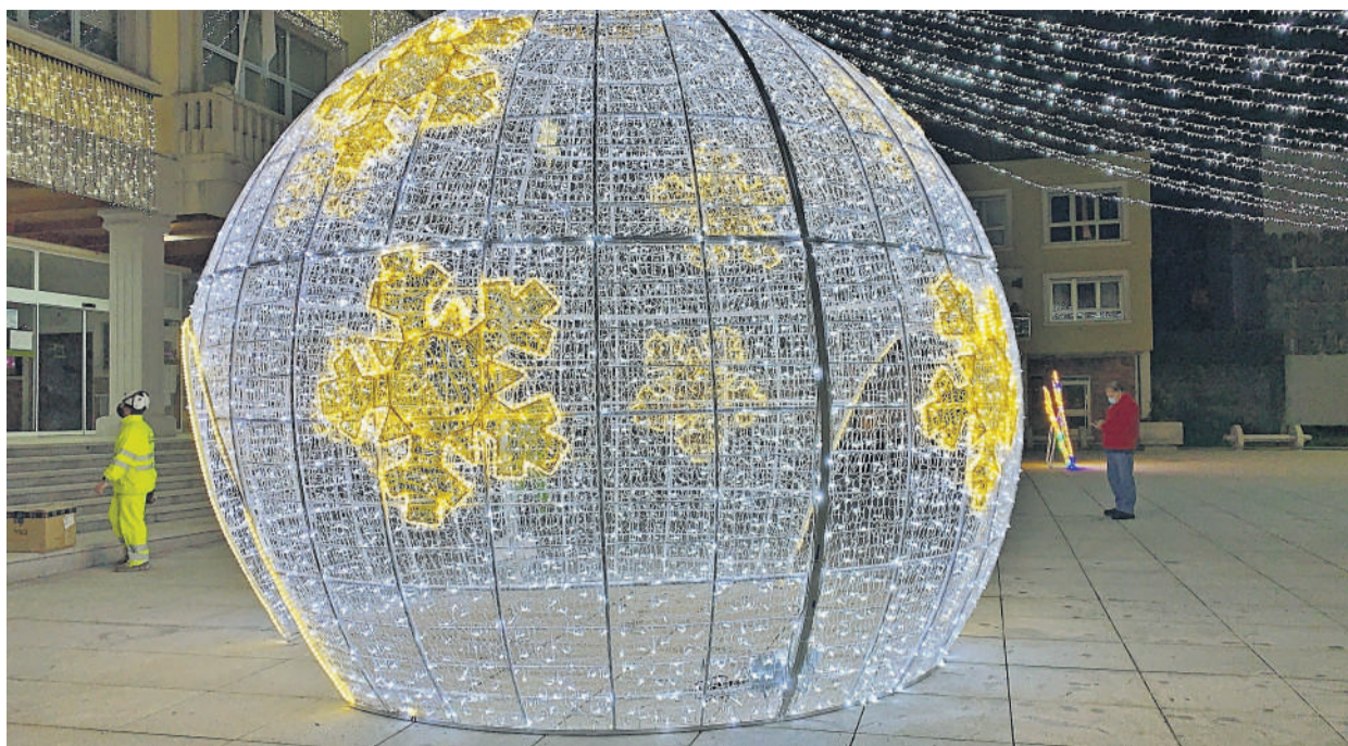
Iglú de Nadal en Vimianzo, unha das principais atraccións do alumeado local para estas datas.

Vimianzo. O Concello de Vimianzo, que leva dende comezos de mes cunha iluminación de Nadal que este ano trouxo varias sorpresas para a veciñanza, arrincou esta pasada fin de semana a súa particular programación de Nadal, a cal ven marcada por unha ampla variedade de actividades para todos os públicos e cuxo obxectivo é o de animar aos veciños e veciñas para superar a situación sanitaria que estamos a vivir.