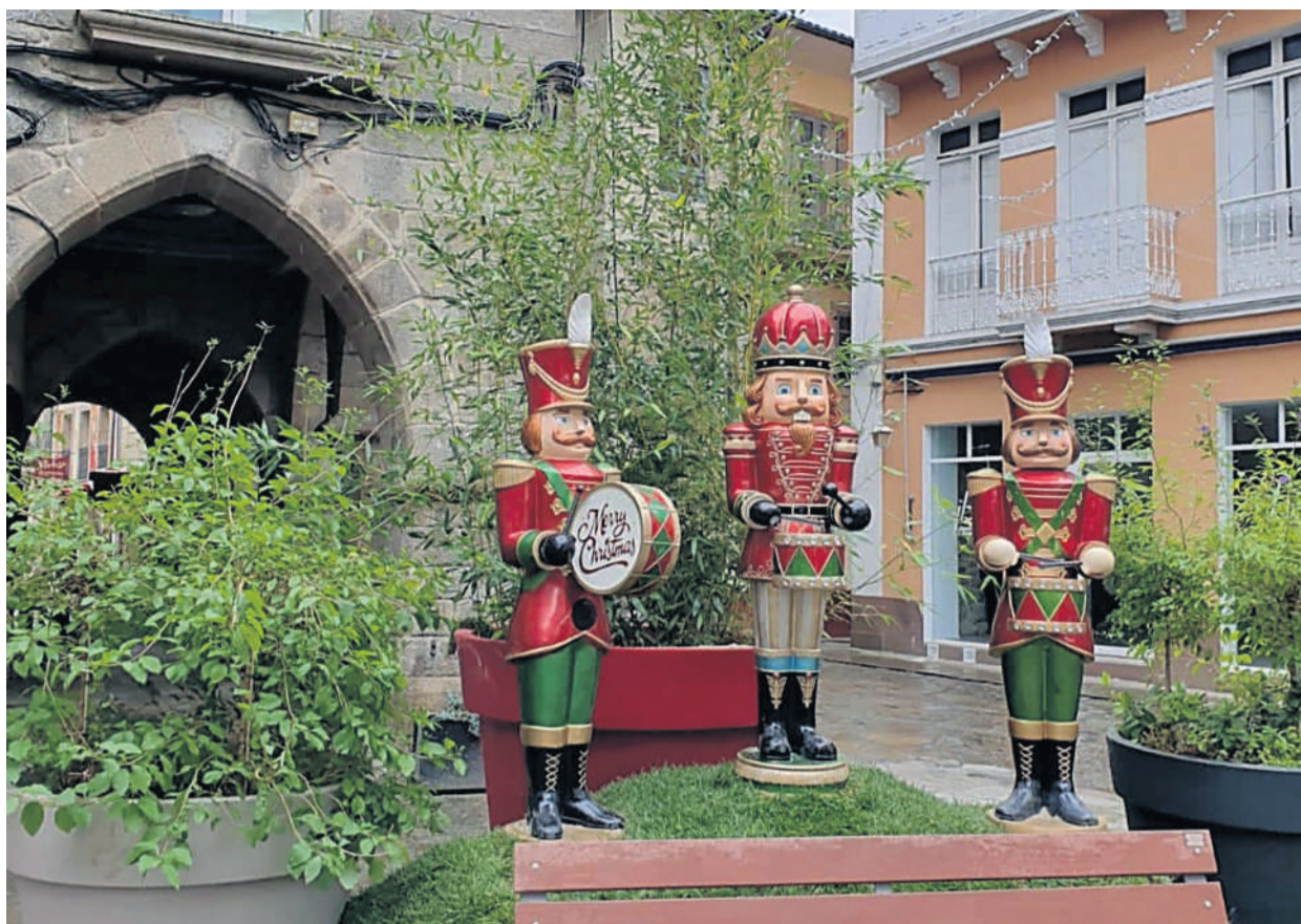
Decoración de Nadal polas rúas do casco histórico de Noia.

Ademais, a este atractivo visual, engadíuselle unha ambientación musical típica destas datas, soando panxo-