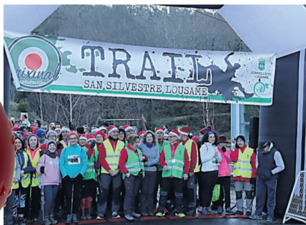
A saída do Trail deste ano será moi diferente e estará protagonizada polas máscaras e a distancia de seguridade.

Lousame. Unha vez máis, o deporte protagonizará o Nadal de Lousame, xa que, a pesar das limitacións pola pandemia da covid-19, terá lugar a cuarta edición do Trail San Silvestre "Castelo de San Mamede". Esta cita, xa tradicional destas datas, conta cun gran interese social, de aí que xa completase o aforo, de 400 prazas, con máis dunha semana de antelación.