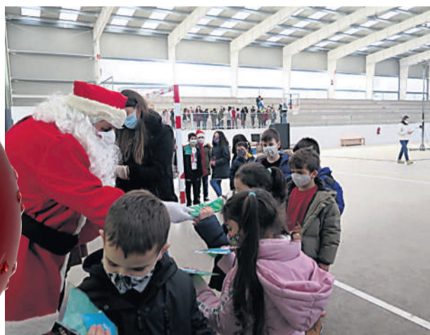
Visita de Papá Noel aos nenos do concello da Laracha.

Santiago. A pesar da situación sanitaria actual, os Reis Magos de Oriente queren facer felices aos nenos e nenas galegos e para iso, coa axuda dos diferentes concellos, buscaron alternativas para poder entregar, un ano máis, os agasallos que pediu a cativada. Neste senso, na comarca da Costa da Morte, xurdiron alternativas moi diferentes para que as súas Maxestades poidan escoitar, de primeira man, as demandas dos cativos da zona.