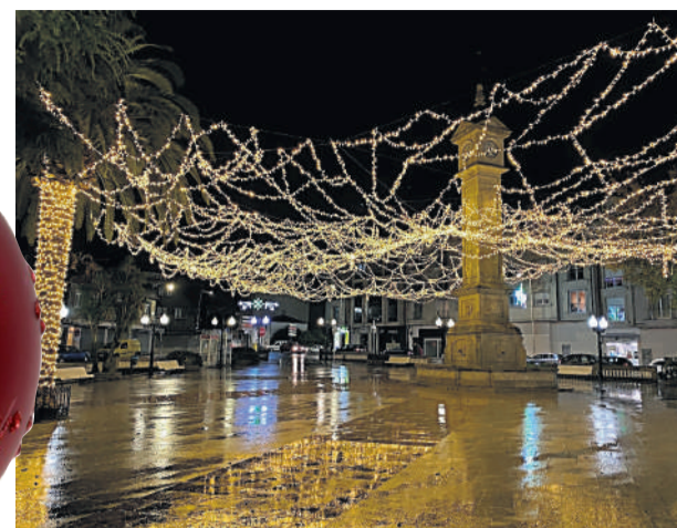
Iluminación de Nadal no Concello da Laracha.

Laracha. Co obxectivo de dinamizar as compras nos comercios locais, dentro da programación de Nadal para estas datas tan sinaladas, a Asociación de Comercio Laracha (ACSIL) lanzou a campaña "Na Laracha hai moito que rascar", de apoio aos establecementos da vila.