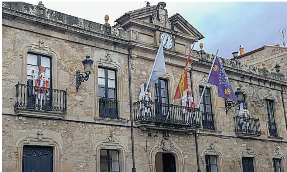
Decoración de Nadal da casa consistorial na Pobra do Caramiñal.

Ademais, para darlle vida ao pobo, tamén sacamos o concurso de fachadas, con