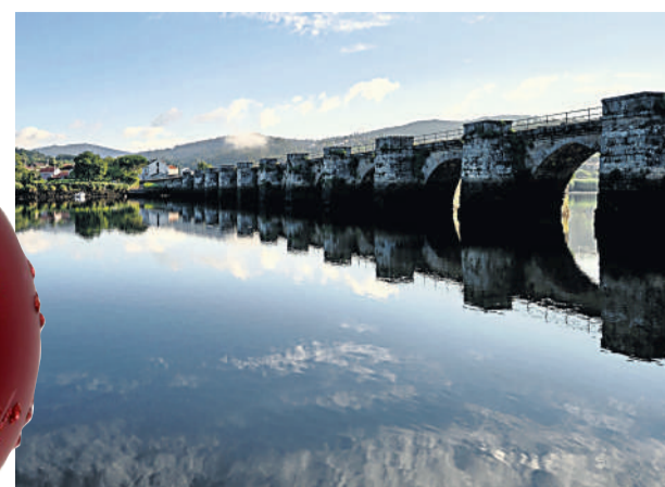
Entre as actividades está programada unha andaina pola contorna de Pontenafonso, para o 3 de xaneiro.

Outes. O concello de Outes vivirá un Nadal marcado pola cultura e o deporte. Co obxectivo de levar alegría aos fogares locais, prepararon un amplo programa de actividades nos que os cativos contarán con múltiples alternativas: teatro, obradoiros ou contos, entre outras.