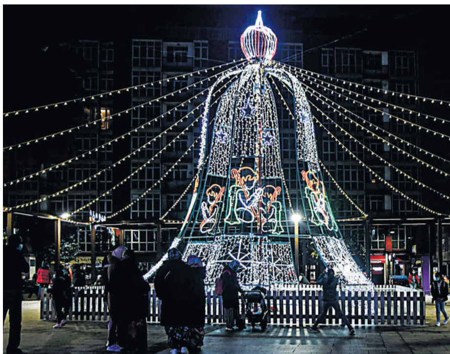
Decoración especial de Nadal en Ribeira, unha iluminación reforzada este ano.

A maiores, tamén está previsto realizar, se a situación sanitaria o permite, distintas ruadas e animación musical