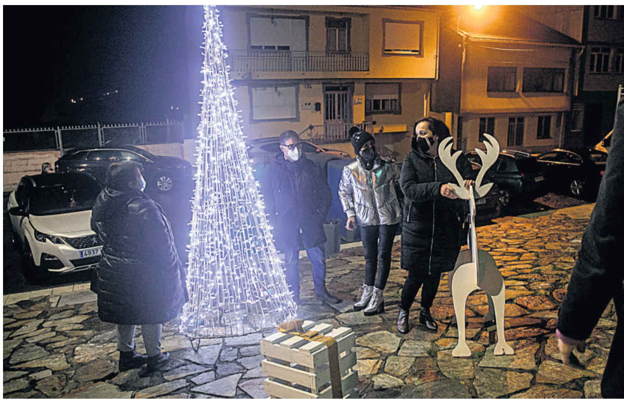
O Concello de Camariñas acendeu o Nadal en todas as parroquias no Día Internacional do Voluntariado.

Muxía. O Nadal 2020 no Concello de Camariñas vivírase dunha maneira moi especial. Os cativos da vila seguirán a ser os grandes protagonistas destas datas especiais, cunha programación de actividades marcada polas medidas de seguridade e hixiene que se aplicarán, e que conta con varios obradoiros, concertos, contacontos e contempla as visitas de Papá Noel e os Reis Magos de Oriente.