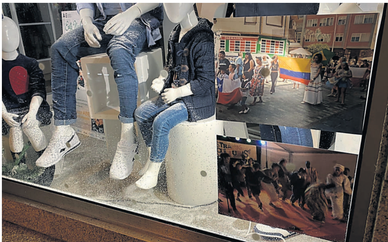
Un escaparate dun dos establecementos adheridos á campaña, coas imaxes para o 'Escape Room'.

A través dunha aplicación móbil, as persoas participantes terán que moverse polos locais da localidade buscando pistas nos escaparates e resolvendo preguntas de interese cultural e poder avanzar no xogo. Actualmente, xa hai mais de vinte comercios inscritos para participar na actividade e, todos aqueles que queiran participar poden facelo poñéndose en contacto co departamento de Cultura.