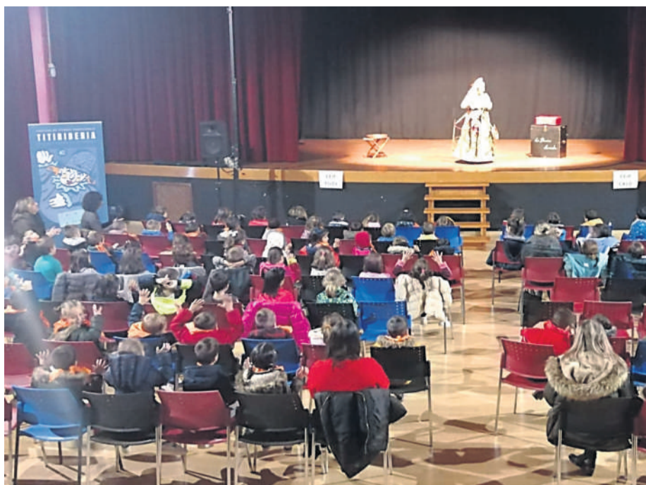
Función de Titiriberia en Teo no peche do curso escolar 2019.

Ao longo dos sete días presenciais que durará o festival, pasarán pola vila compañías como Viravolta Títeres, Diáspora Teatro, Seisdedos Marionetas, Fantoques Baj, Títeres Cascanueces, Xirapaus ou a Cova das Letras, o colectivo In-