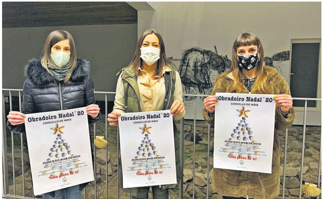
O Museo do Mar acollerá un obradoiro de Nadal ata o 7 de xaneiro, con moitas actividades para os nenos e nenas.

Noia. Dentro da programación de Nadal do concello de Noia, os pequenos da casa tamén serán os protagonistas. A pesar do contexto actual marcado pola pandemia da covid-19, preparáronse actividades, nas que se manteñen as medidas de seguridade e hixiene marcadas polas autoridades, para favorecer a vida familiar e laboral dos veciños. Deste modo, entre outras accións, haberá obradoiros,