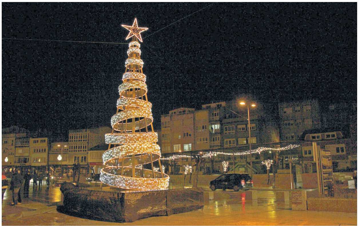
Árbore de Nadal que impera neste Nadal en Muxía e cuxo acendido foi retransmitido para toda a vila.

Haberá cabalgata e visita dos Reis Magos de Oriente na sala A Camposa, con amplas medidas de seguridade