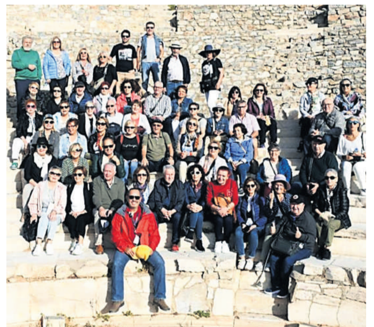
VIAJES TAMBRE SE FUE DE EXCURSIÓN A TURQUÍA. Viajes Tambre organizó un magnífico desplazamiento a Turquía en el que sus clientes realizaron un recorrido de nueve días en que tuvieron la oportunidad de conocer Estambul, Bursa, Éfeso, Pamukkale, Hierápolis, Konya, Capadocia, valle de Goreme, calle de Pasabag y Ankara. A modo de anécdota, la expedición gallega recorrió la calle Istiklal tres días antes de que en esta avenida peatonal se cometiera un atentado terrorista.