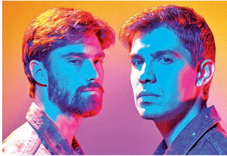
“Lemot” grupo gallego presentará su primer disco el 27 de mayo.

Es nuestra forma de definir el sonido Lemot, la idea es llevarnos Galicia a donde vayamos, somos una banda que ha nacido del directo y en nuestra tierra, así que no hay mejor manera que calificar nuestro sonido como