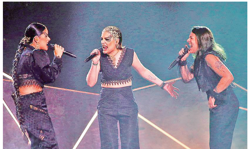
TANXUGUEIRAS durante su impresionante actuación en el Benidorm Fest el pasado año

Nil Moliner, cantautor que está en su mejor momento (como reflejan las propias listas de los 40 principales) y las gemelas influencers Twin Melody también se dejarán ver hoy en A Quintana. Además, continúa la relación entre Operación Triunfo y Los 40 Pop en Compostela, pues completará el cartel Agoney, participante del concurso en su edición de 2017. El concierto de hoy será presentado, como de costumbre, por Tony Aguilar.