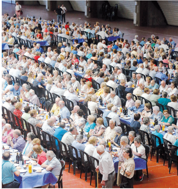
FESTA DOS MAIORES. Este año se retomará la celebración

El horario de esta línea especial será de 12.00 horas a 14.00 horas para la ida, y de 17.00 horas a 19.00 horas en el caso de la vuelta, en la que los buses realizarán el tra-