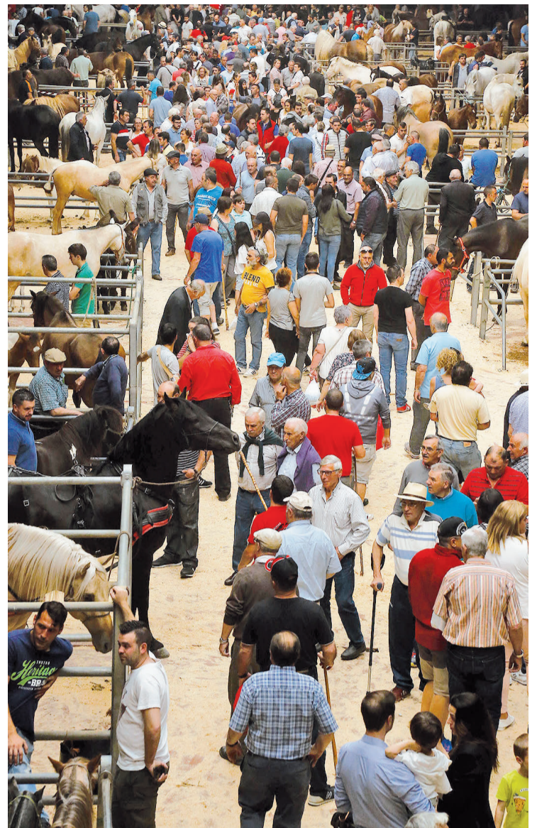
Última feria caballar de la Ascensión, en Amio.