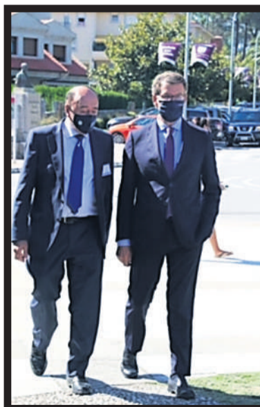
Lage, iz, y Núñez Feijóo a su llegada