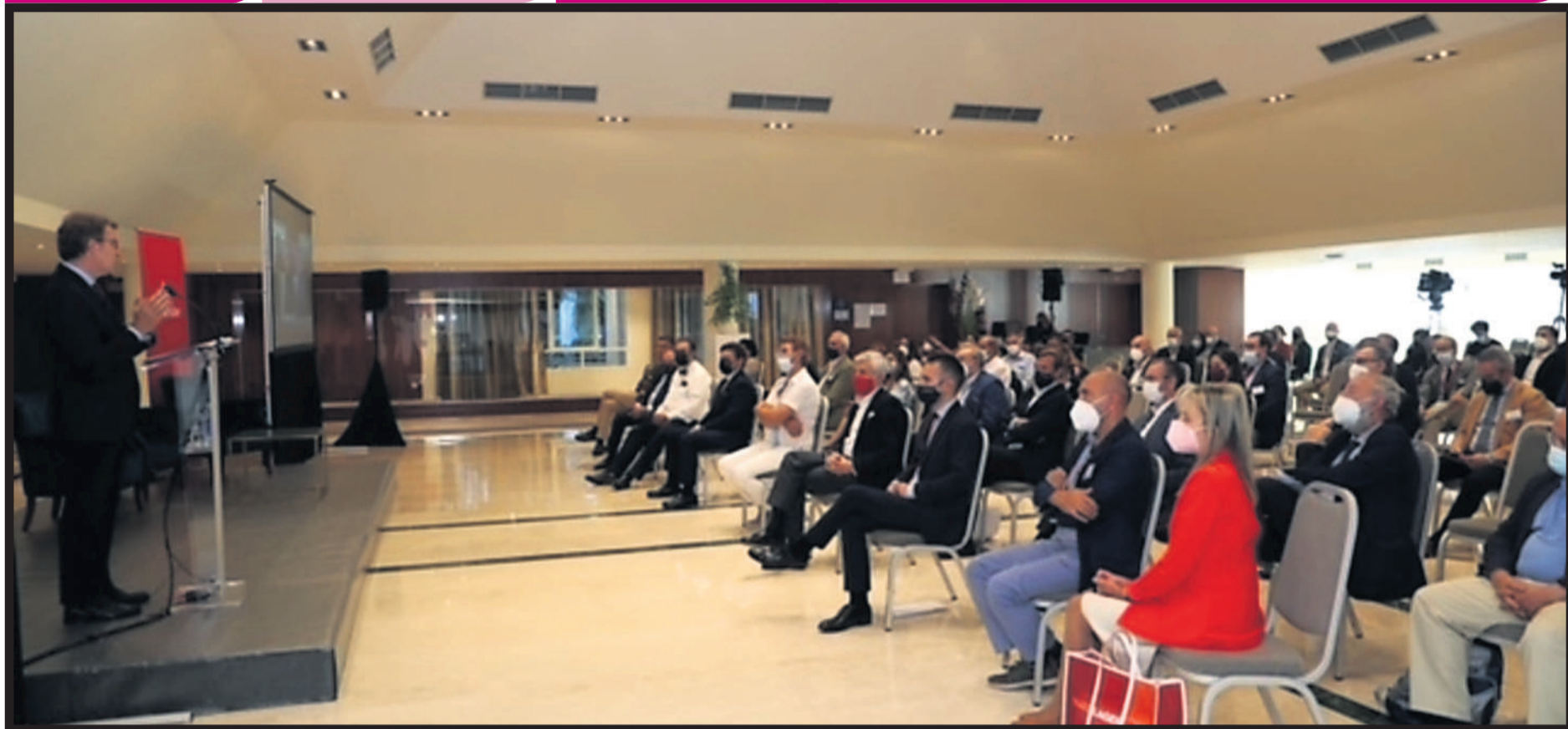
El presidente de la Xunta, Alberto Núñez Feijóo, durante su intervención ante los más de 200 empresarios gallegos en el mundo que se dieron cita esta semana en A Illa da Toxa.