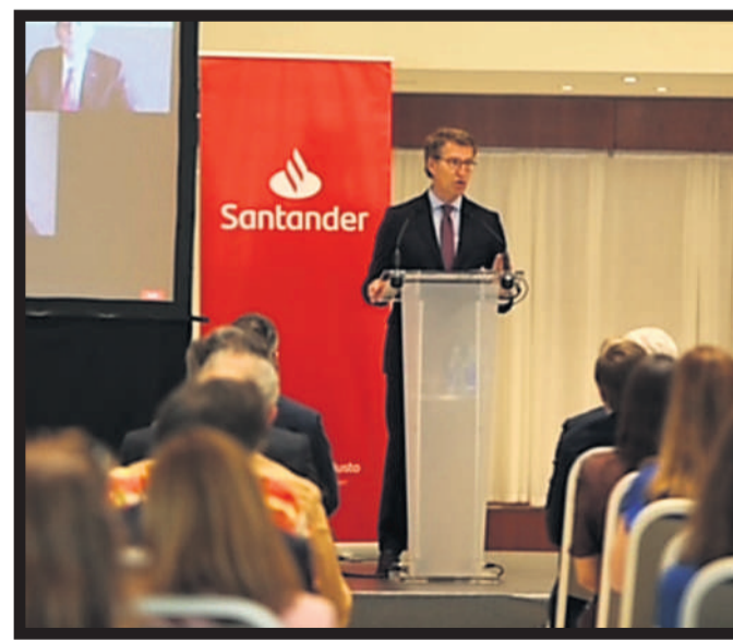
El presidente Núñez Feijóo durante su intervención en el encuentro