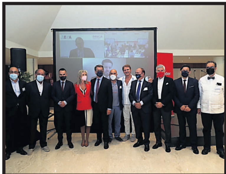
Núñez Feijóo, en el centro, rodeado de representantes de las asociaciones