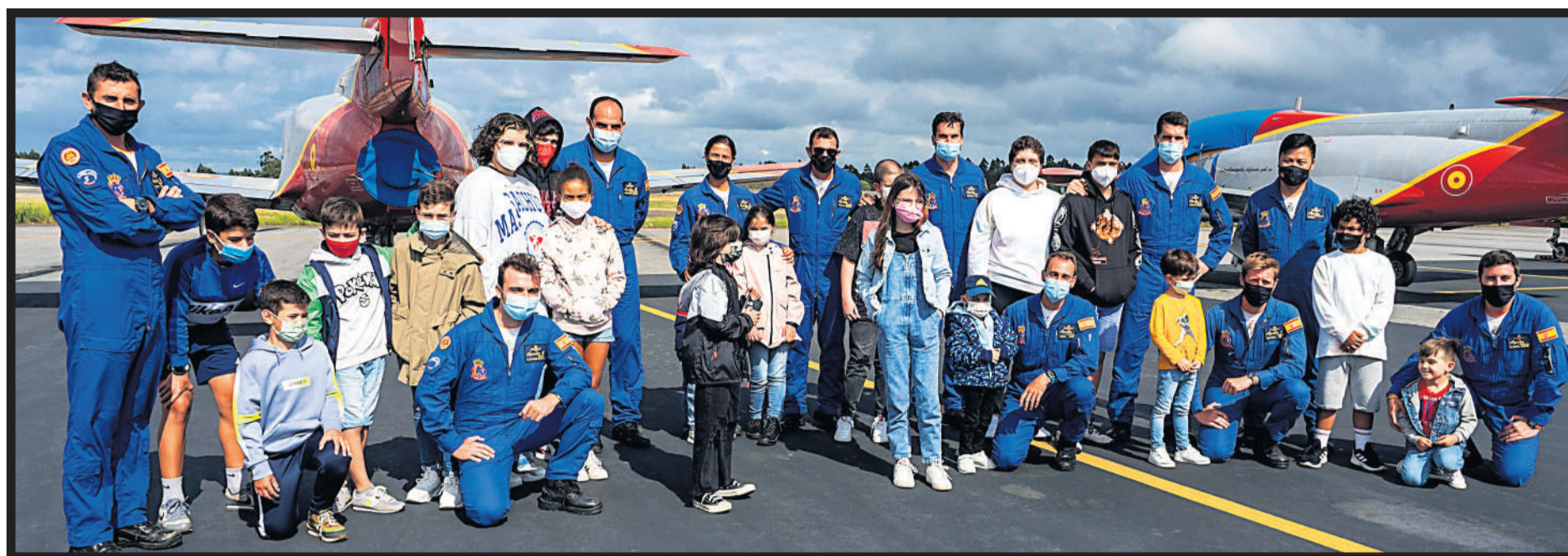
ASANOG CON LA PATRULLA AGUILA. Un grupo de niños y niñas de la Asociación Asanog visitaron a los miembros de la Patrulla Águila del Ejército del Aire encargados del espectáculo de acrobacias aéreas que sobrevoló Compostela el Día del Apóstol, haciendo las delicias de los peques oncológicos y de sus familias. La Patrulla Águila es el grupo de vuelo acrobático del Ejército del Aire y la flota vuela con siete aviones de reacción CASA C-101, dedicándose principalmente, a la representación del Ejército del Aire en eventos y a formar a futuros pilotos.