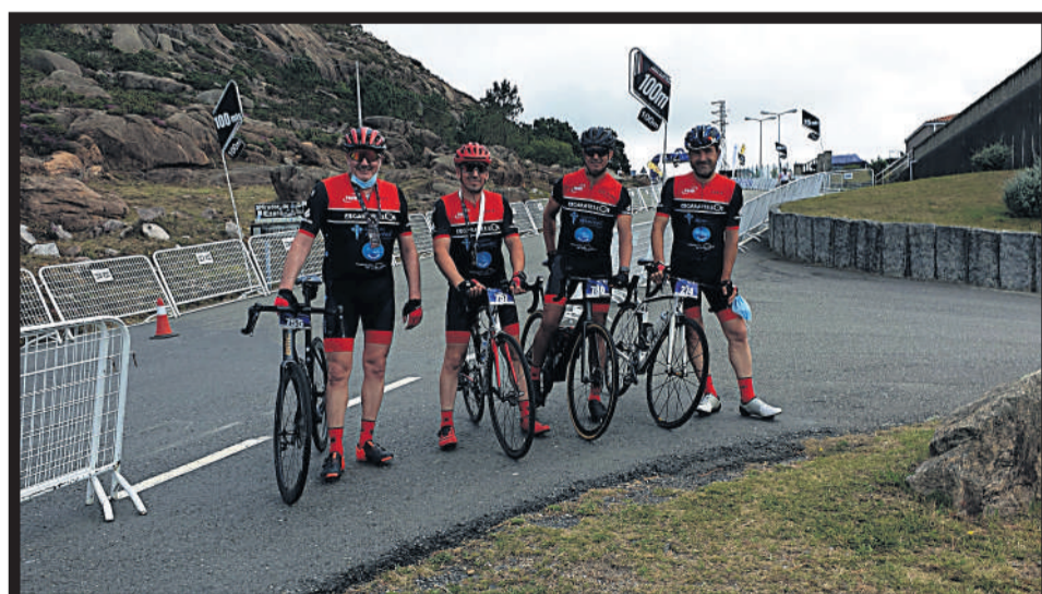
OS ESCARAVELLOS EN EL GRAN FONDO ÉZARO. El Gran Fondo Ézaro, que en su edición de 2021 congregó a cerca de 1000 participantes, contó en esta ocasión con la participación de cuatro miembros del grupo Os Escaravellos , que completaron el recorrido sin ninguna incidencia, colgándose de nuevo la medalla de finisher .