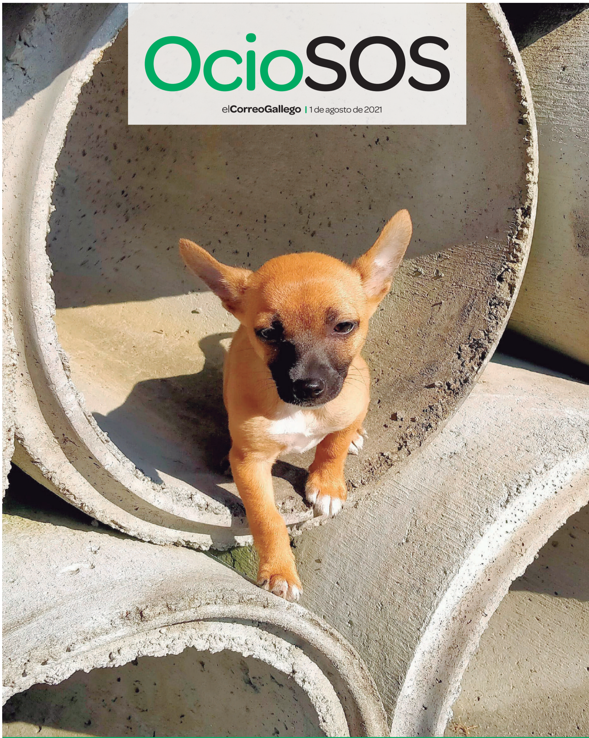
LOCALIZACIÓN: Bemibre (A Coruña) MASCOTA: 'Luna', pincher miniatura

DIRECCIÓN: Ana Iglesias • DISEÑO: Fran Ageitos COLABORACIONES: Toni Martín, Juan Morandeira, Martina Izard y Mar Solar