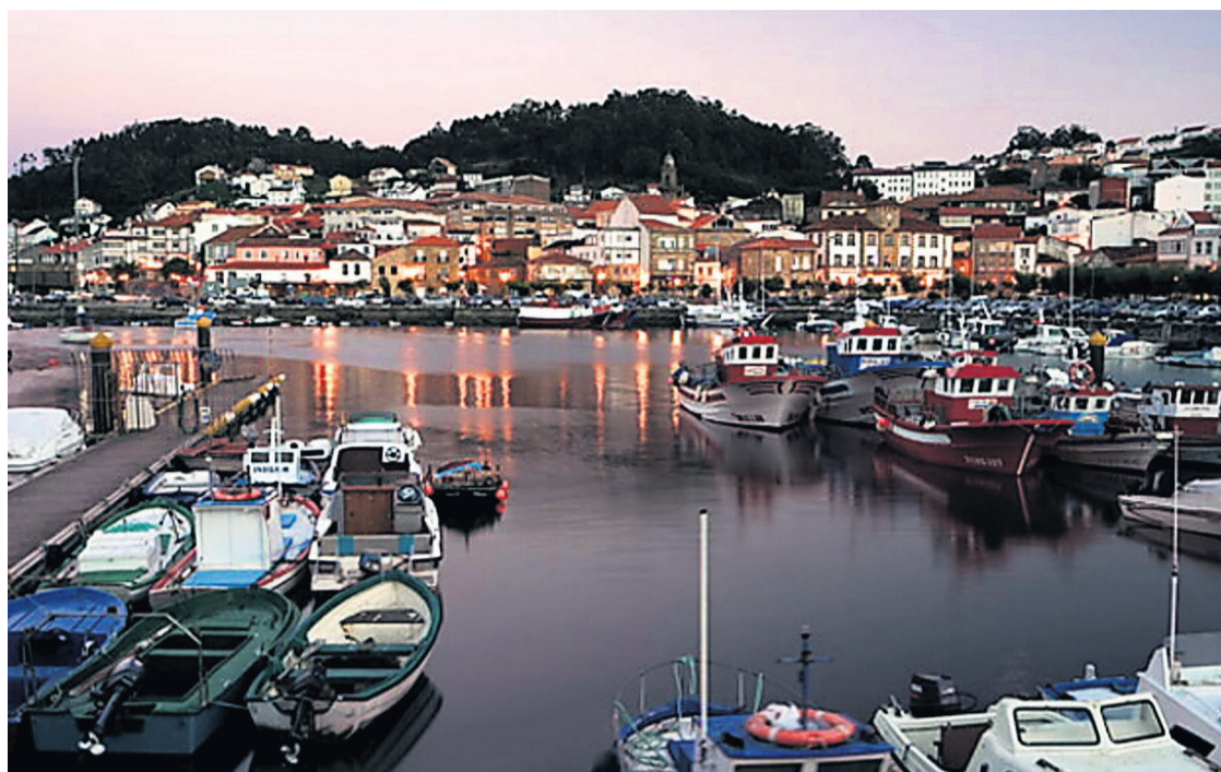
Vista panorámica do porto pesqueiro da capital municipal de Muros.

No que vai de ano, o marisco e o peixe xeraron máis de tres millóns de euros na lonxa local // A actividade empresarial estase a ver favorecida coa creación do polígono TEXTO M. L.