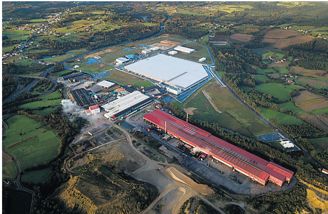
Vista aérea do parque empresarial da Laracha, que será obxecto dunha ampliación.

O parque empresarial da Laracha é, xunto co de Carballo, un dos máis dinámicos da Costa da Morte e, froito da alta demanda de parcelas, Suelo Empresarial del Atlántico (SEA) e o Concello traballan para acometer a ampliación do polígono cunha perspectiva loxística e industrial.