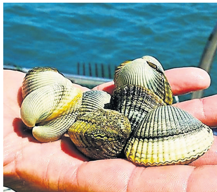
De Noia sale el 70 % del berberecho comercializado en Galicia.

Y todo ha sido posible gracias a las generaciones que han ido enriqueciendo este oficio con técnicas artesanales, con un profundo conocimiento del medio y con organización profesional. El marisqueo es una actividad muy sensible a las formas de explotación y siempre ha estado muy vigilada por sus protagonistas, que no escatiman en cuidados hacia sus zonas de producción y su afamado molusco; quizás ese haya sido parte de su éxito.