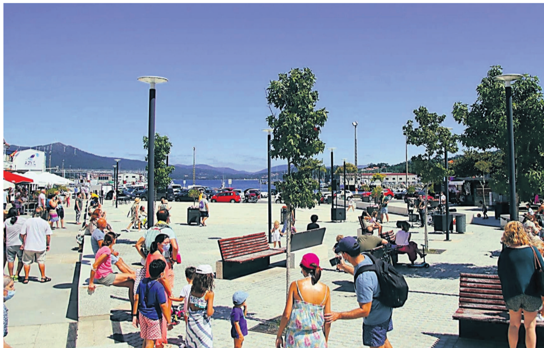
Ambiente en la plaza do Curro de Portosín (Porto do Son) en una jornada soleada del pasado verano.

Pero existen muchos alicientes más para venir a veranear a Porto do Son y Noia. Así, aunque el tiempo