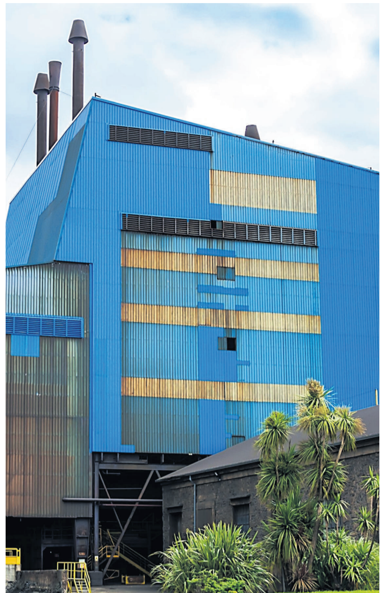
Un dos fornos de ferrosilicio da factoría de Xeal en Brens-Cee.

Os referido plan atende a catro eixos estratéxicos: máximo compromiso coa seguridade e a saúde no desenvolvemento da actividade dos seus traballadores; respecto polo medio ambiente e cumprimento coa normativa medioambiental; cuidado e mantemento dos activos a longo prazo; e mellora da eficiencia e produtividade para facer máis competitiva a empresa.