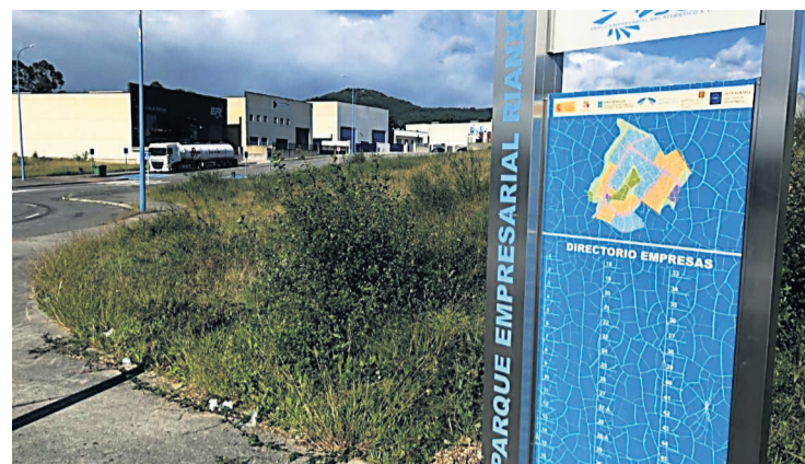
OCUPACIÓN. Cartel del polígono de Rianxo, ocupado al 70 %.

Estará situado en la zona de Fontenla y Pedras Vermellas (en la parroquia de Palmeira) y tendrá una superficie de 258.685 m 2 .