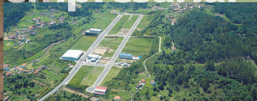
Vista parque empresarial 2012

Diseñado para pequenas y medianas empresas para contribuir a dinamizar y diversificar el tejido industrial