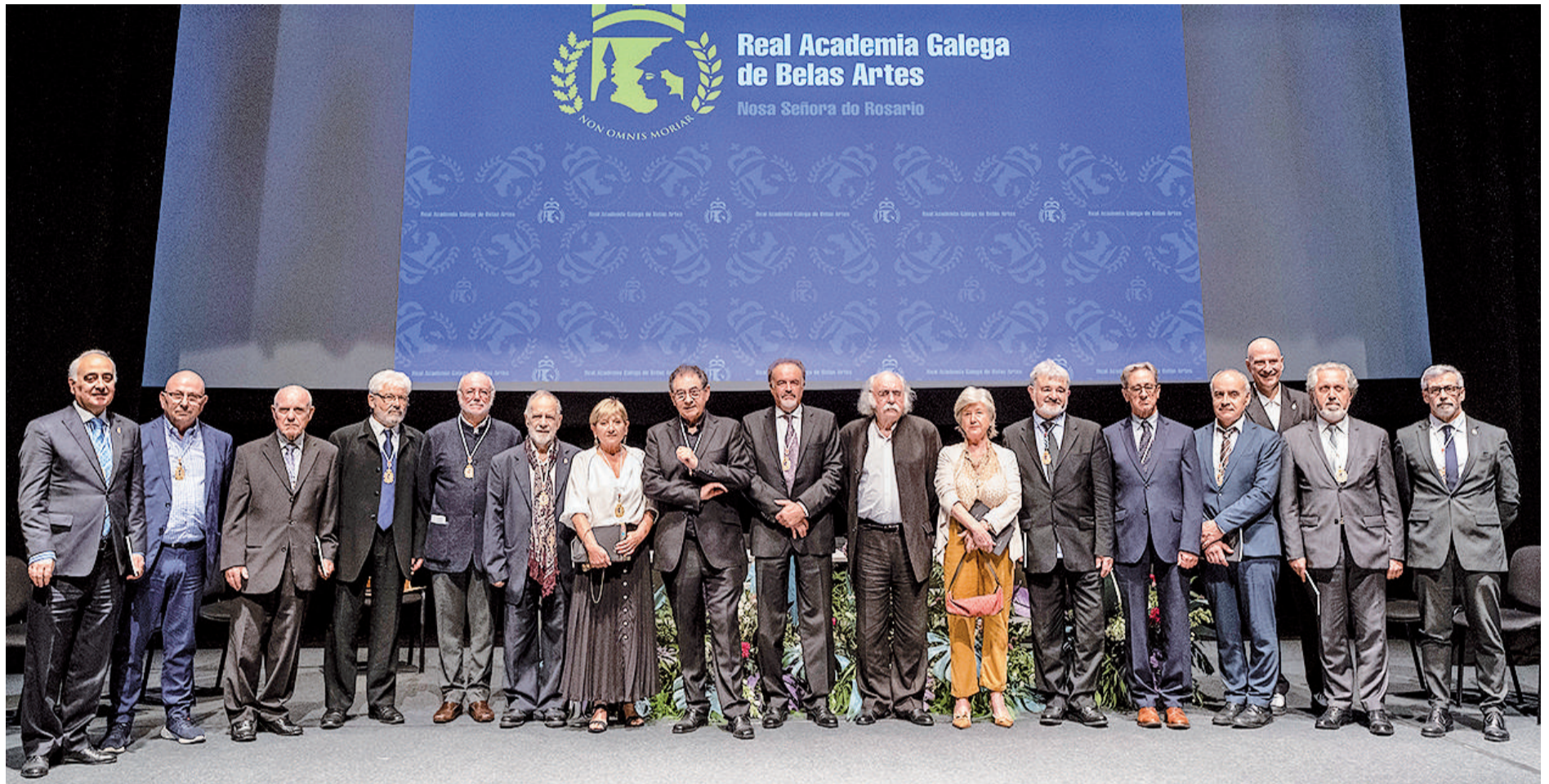
El diseñador de moda Roberto Verino, octavo por la izquierda, posa para la fotografía en el auditorio de Verín con miembros de la Real Academia de Bellas Artes a la que ahora pertenece