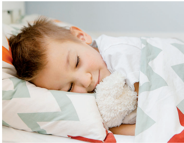
Os expertos recomentan establecer uns horarios regulares e que a contorna onde durme o neno sexa tranquila.

Coa volta ao colexio regresan tamén as rutinas e os horarios para irse pronto á cama para afrontar as clases e as actividades extraescolares do día seguinte con enerxías renovadas. Despois da relaxación e o descanso do verán, este cambio, en ocasións brusco, podería xerar unha desorde no sono dos máis pequenos. Deste modo, nesta volta ao cole, tras un período es-