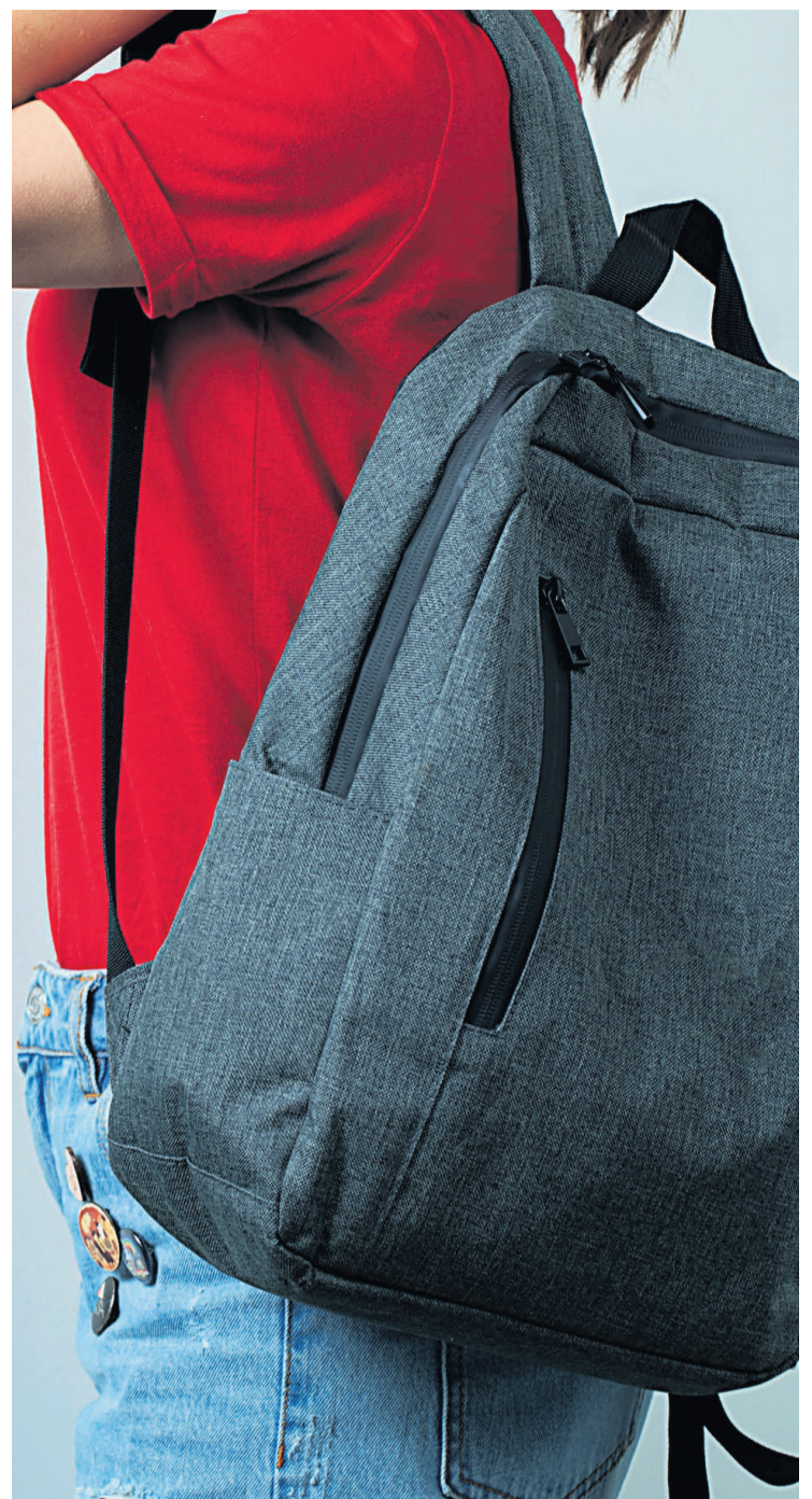
La postura en la silla y el peso de la mochila resultan vitales.

Los expertos que han colaborado con la iniciativa recomiendan además que el peso de la mochila no supere el 10% del peso corporal de los niños y niñas, aunque los datos reflejan que un tercio de los escolares pasa por encima de ese límite, por lo que aconsejan la disposición de taquillas en los centros escolares.