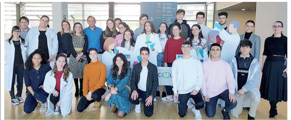
Visita ao CiMUS do Bacharelato STEM do centro compostelano.

Nese senso, remarcan que é fundamental establecer horarios regulares, unha alimentación sa e que a contorna onde dorme o cativo sexa tranquilo. "Débese evitar o uso de novas tecnoloxías antes de durmir e non é aconsellable que teñan un televisor na súa habitación, porque estes elementos non propician o sono", conclúen.