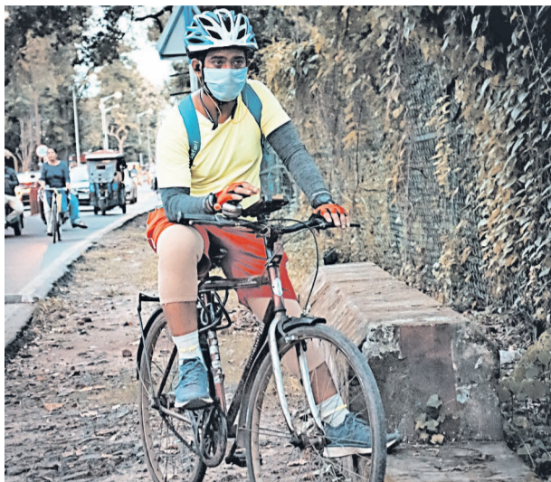
INDIA. De acuerdo con Unicef, el país reportó niveles mucho más bajos de enseñanza desde marzo de 2020.

en el Sur de Asia, especialmente en la India, el segundo país más afectado del mundo, ha mantenido los centros cerrados desde marzo de 2020, y aún continúa como uno de los pocos sectores que no ha reiniciado por completo sus actividades, pese a la relajación de las medidas de confinamiento.