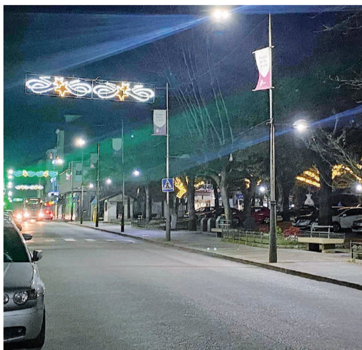
Luces do Nadal na avenida Alfonso Molina de Santa Comba.

Pero o Concello ten preparadas máis sorpresas. Este venres, 23 de xaneiro, un día despois de abrir a pista de xeo, Peter Punk Pallaso actuará ás seis da tarde no auditorio do edificio multiusos ofrecendo a obra titulada Peor imposible .