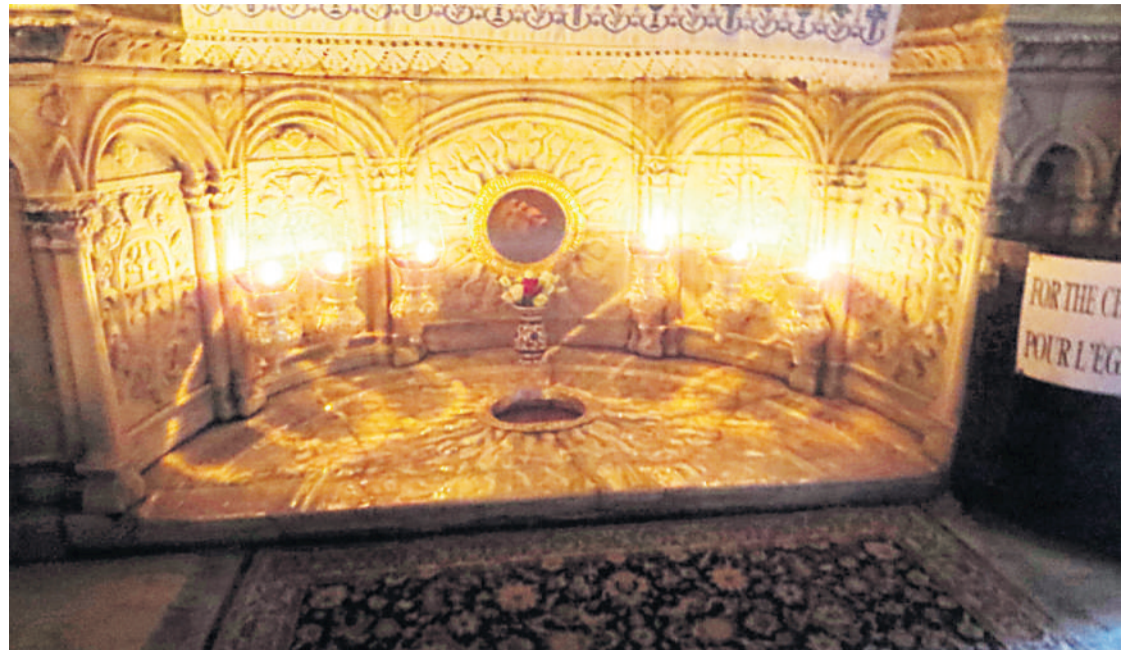
Capilla martirial de Santiago de Zebedeo en la catedral de Santiago de Jerusalén.

miriano abundaron en su martirio jerosolimitano y en el acarreo de su “cuerpo entero con la cabeza” a la costa de Jaffa, en donde sus discípulos “encontraron en la playa una nave que les había sido preparada por Dios, en la cual se hicieron a la mar llenos de gozo dando gracias a Dios de manera unánime tras embarcar el sacratísimo cuerpo, y después de evitar Escila y Caribdis junto con las peligrosas Sirtes, siguiendo el rumbo de la mano del Señor, arribaron a bordo del afortunado navío primero al puerto de Iria y luego llevaron el venerable cuerpo al lugar que entonces se llamaba “Liberum donum” y que ahora se llama Compostela, donde lo sepultaron siguiendo el rito eclesiástico bajo unos arcos de mármol”. O sea, sin ningún género de dudas, el cadáver completo del apóstol Santiago de Zebedeo [es decir, su cabeza, su tronco y sus extremidades] yacían en el “Locus Sancti Iacobi” desde mediados de la centuria inicial de la era cristiana. Sin embargo, en un lustro se sucedieron, vertiginosamente, el Concilio de Clermont (1095), la proclamación de la primera cruzada, la conquista cristiana de los Santos Lugares de Oriente (1099) y la conversión de Tierra Santa en el foco de atracción de miles de palmeras y palmeros atlánticos y mediterráneos. En este contexto histórico, en el año 1104 Mauricio Burdino abandonó la