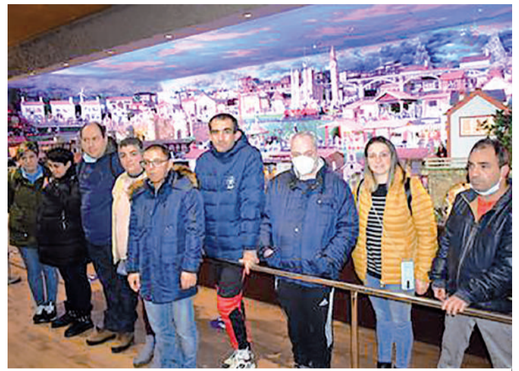
Membros da asociación Amipa, con sede en Rois, disfrutaron do belén

O nacemento permanecerá aberto ao público de xeito gratuito ata o próximo 8 de xaneiro. Entre semana abre de 17.30 a 20.30 horas, os sábados de 17.00 a 20.30 e os domingos e festivos de 12.00 a 14.00 horas pola mañá e de 17.00 a 20.30 pola tarde. Os grupos poden concertar cita fóra de este horario a través do número de teléfono 630 95 25 15.