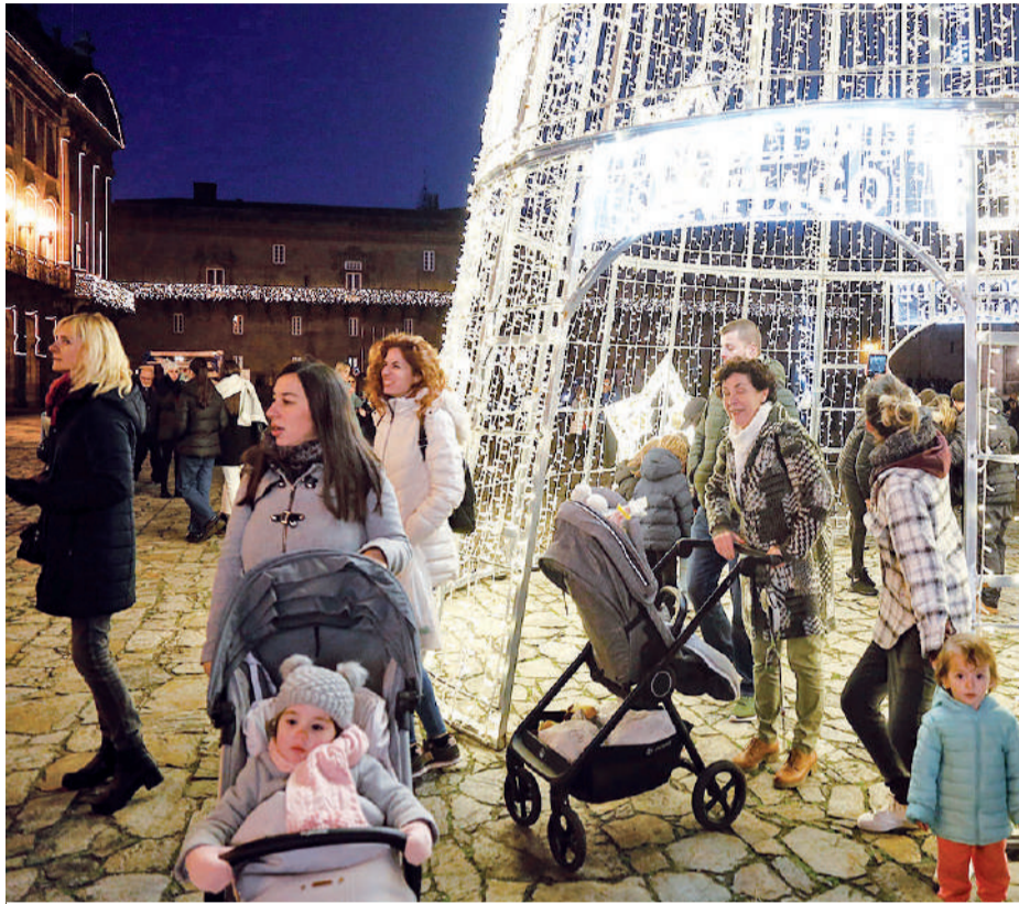
La siempre impactante Plaza del Obradoiro, meta de peregrinos también en navidad.

¿Es posible?. El lector podría preguntarse que no es fácil superar la demanda originada por la apertura de la Puerta Santa, pero tiene su lógica. Quienes vienen atraídos por la fe, sin duda se apuntan a un año emblemático, cuando el 25 de julio coincide en domingo, pero el resto esperan a que el flujo de visitantes descienda para obtener mejores precios, visitar lugares con menos saturación y atraídos, también, por la enorme cantidad de perso-