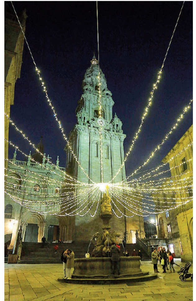
La emblemática fuente en pleno centro monumental conocida por 'Os cabaliños de pedra' es una de las favoritas

sitantes. Despediremos, pues, un ejercicio magnífico y las perspectivas para el que viene son, en verdad, alentadoras. Al menos, mantendremos la esperanza