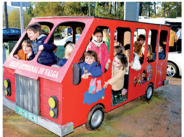
Os rapaces do Centro Rural Agrupado de Valga pasárono en grande