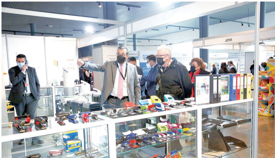
Por los stands se pasarán profesionales del sector de Galicia, otras comunidades y Portugal.