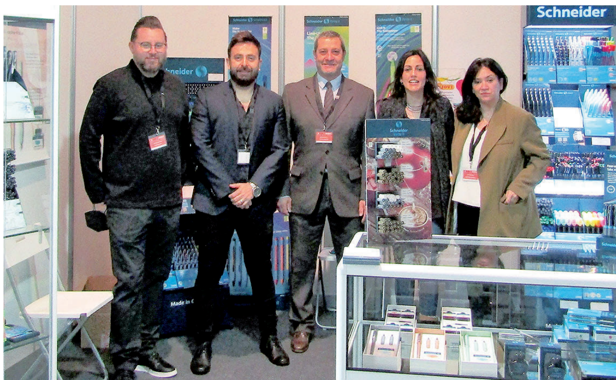
Equipo de JOVI y Schneider presente en la feria celebrada en el Palacio de Congresos hasta mañana domingo.

La firma alemana, de la mano de JOVI-FULCO, ha conseguido asentarse dentro del mercado nacional hace poco más de un año