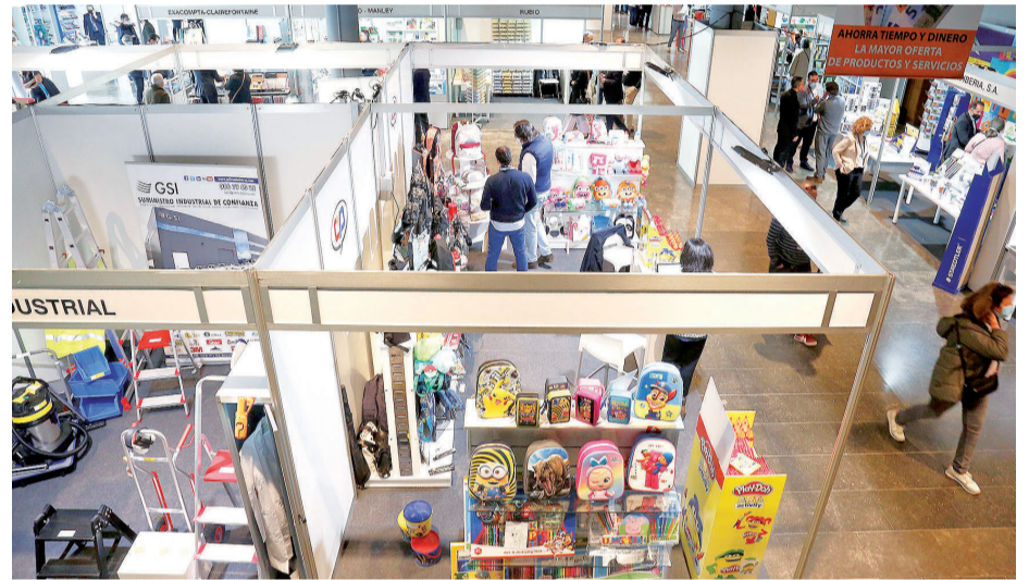
Más de cien marcas del sector de la papelería están presentes en la cita compostelana.

La sostenibilidad está en tus manos Para un futuro mejor, apuesta por el upcycling