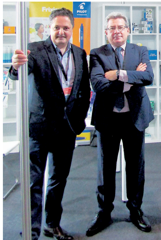
Equipo de Pilot en el expositor de la feria de Distrisantiago.

Debido a que la sostenibilidad es parte de su ADN, esta