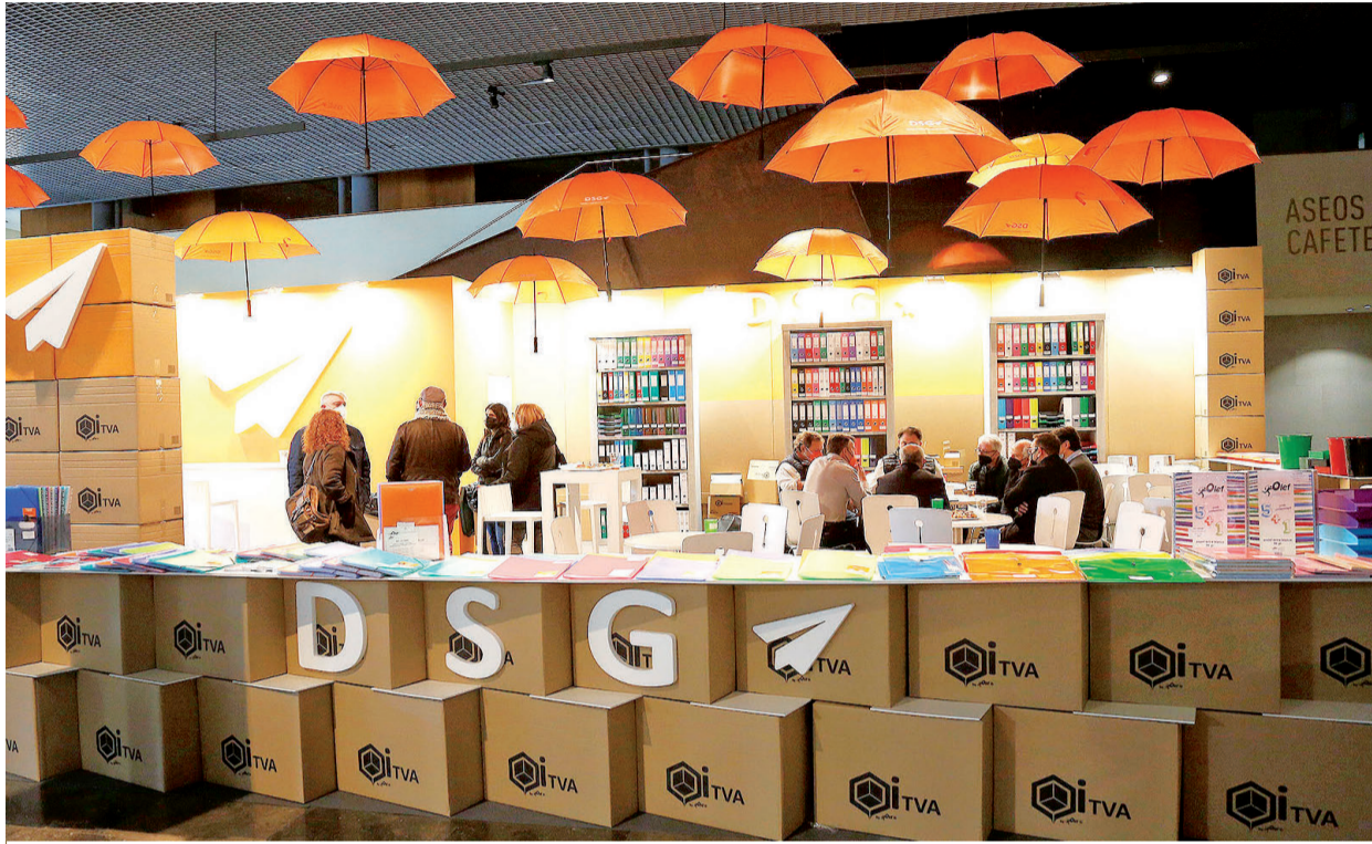
Distrisantiago ha preparado un encuentro por el que pasarán más de mil profesionales de la papelería.

Dentro de ese desarrollo presente, el avance de las