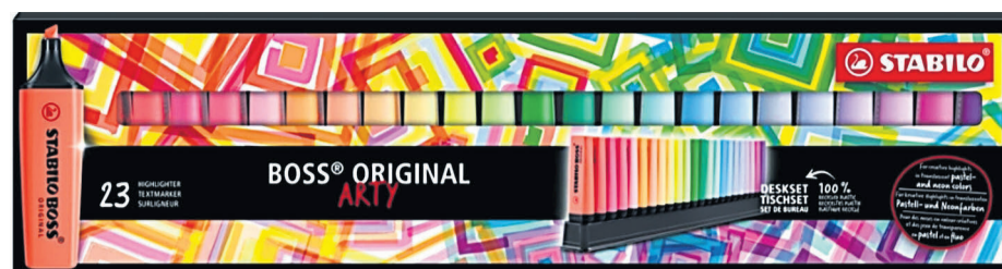
Nuevo estuche de STABILO BOSS ORIGINAL, dentro de la potente gama ARTY.

EL TSUNAMI PASTEL LLEGA AL TODO TERRENO STABILO WOODY 3 EN 1. Este producto combina las ventajas de un lápiz de color, cera y acuarela. Además es versátil en multitud de su-