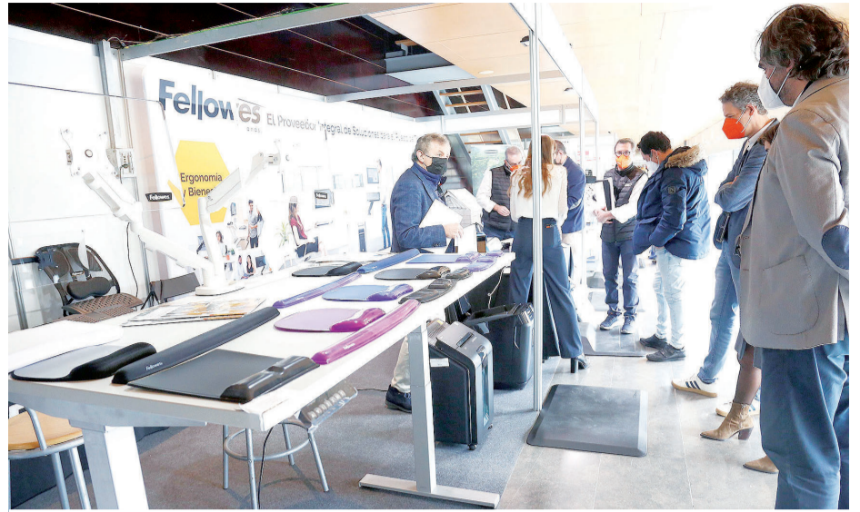
La primera jornada estuvo marcada por la importante actividad de todos los expositores.