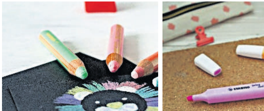
STABILO Woody 3 en 1 con nuevas tonalidades pastel. Fluorescentes STABILO SWING COOL.

perficies como vidrio, plástico, cartón o papel oscuro, así como adecuado para practicar diferentes técnicas. Sus 18 colores existentes se complementan ahora con seis nuevos tonos pastel: azul, rojo, lila, rosa, amarillo y verde, ampliando la gama a veinticuatro.