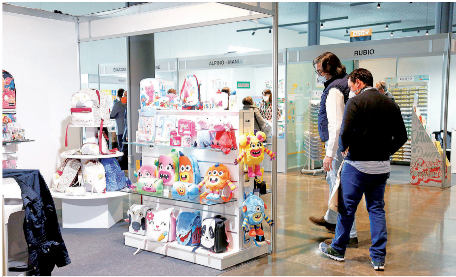
Ayer arrancó una nueva edición de la Feria DSG en el Palacio de Congresos y Exposiciones.