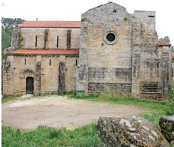
CARBOEIRO. O mosteiro é un dos monumentos máis característicos da arte medieval galega.

Camión de Santiago, os peregrinos que realizan a histórica Vía da Prata atravesan este concello do interior da co-