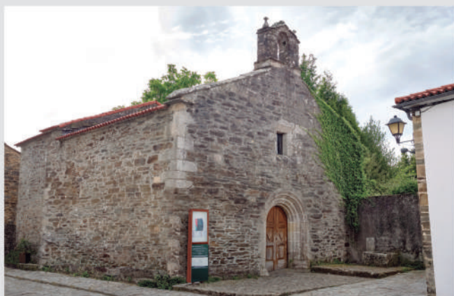
Capilla da Magdalena