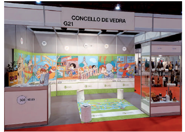
Stand diferente e moi visual do concello en Turexpo.

A través dos personaxes da serie infantil galega, dáse a coñecer a todo o público algunhas das marabillas que distinguen a este municipio como o