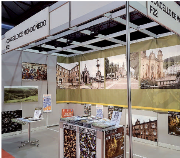
Promociónase na feira ao abeiro das súas festas de Interese Turístico: As San Lucas, Mercado Medieval e Semana Santa.

Xunto a elas, tamén achega o seu importante patrimonio, destacando o seu Conxunto Histórico-Artístico, do que a Catedral Basílica de San Martiño está a cabeza (Patrimonio da Unesco dende o 2015); e promociona a súa cultura, con museos como a Casa-Museo de Álvaro Cunqueiro, sobre o escritor nado en Mondoñedo, o Museo da Imprenta ou o Centro de Interpretación do Camiño Norte.