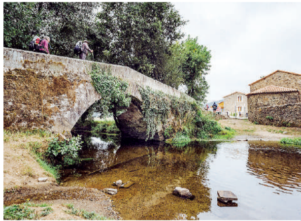
Paso de peregrinos pola área recreativa de Ribadiso.

A través dun Qr terase acceso a nova web de turismo de Arzúa na que se amosan unha gran cantidade de fotografías, acompañadas de textos explicativos que poden ser seleccionados en galego, cas-