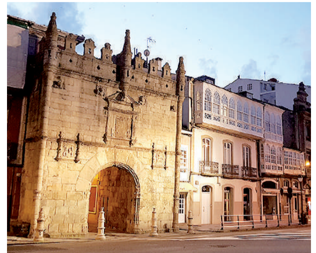
Porta de Carlos V, unha das tres que se conservan do antigo recinto amurallado do municipio lucense.

Precisamente, o Cantábrico xoga un papel crucial no devir da cidade, xa que ten unha gran importancia na economía local, non só pola pesca, senón tamén polos seus finos areais, que reciben a miles de bañistas cada verán. Do mes-