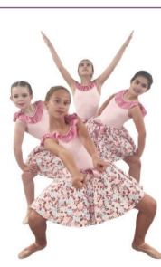
Modern & Lyrical Dance Infantil - Jóvenes - Adultos