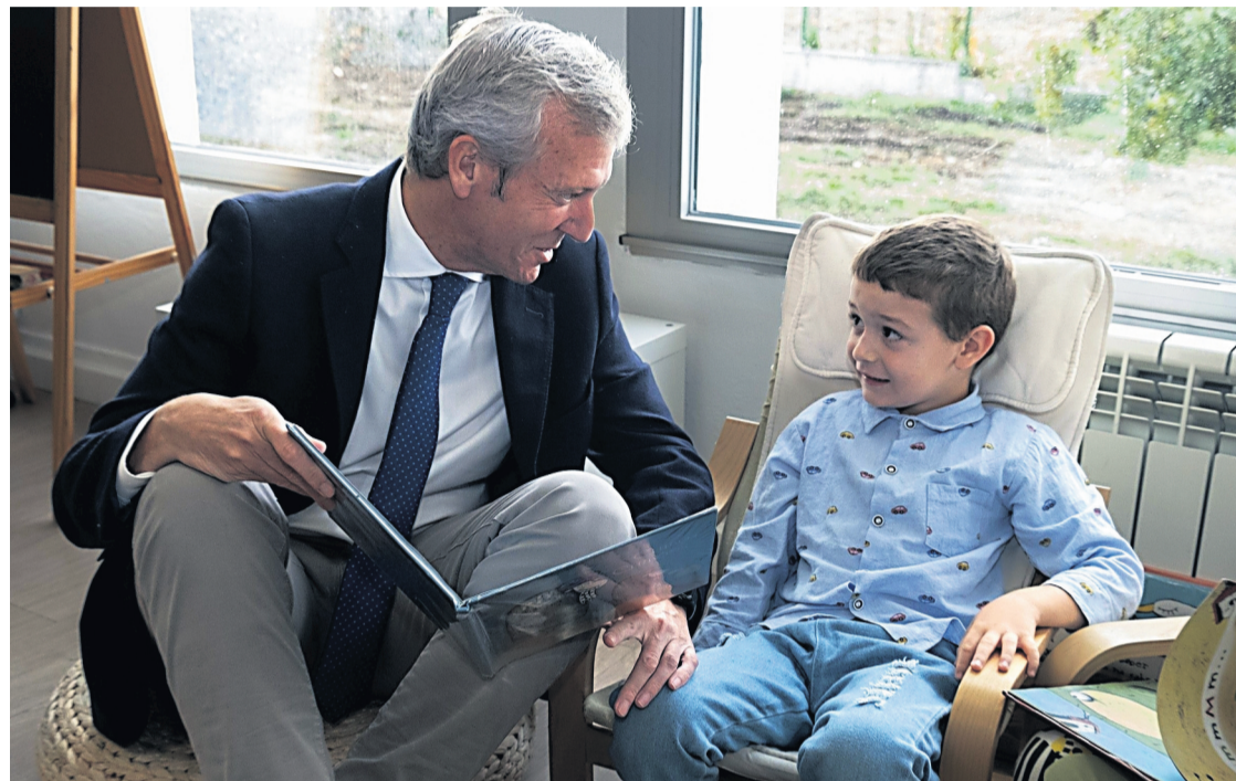
NUEVO CURSO. El presidente de la Xunta, Alfonso Rueda, junto con un alumno.

Como es tradición, los primeros compases del mes de septiembre traen consigo la tan esperada por algunos, como odiada por otros, vuelta a las aulas. En clave gallega, son más de 310.000 alumnos, desde Infantil a Bachillerato, los que se incorporaron en los últimos días a sus respectivos centros para dar comienzo a un nuevo curso escolar.