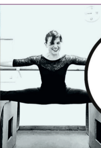
Preparación Física y Flexibilidad Jóvenes - Adultos