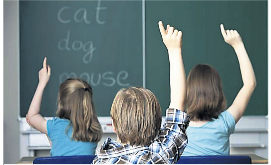
Jóvenes alumnos participando en una clase de inglés.

Su método de enseñanza es interactivo, atractivo y divertido, buscando siempre desarrollar su confianza y ayudándole a mejorar sus habilidades lingüísticas en un ambiente estimulante y de apoyo. Se basa en la idea de que practicar inglés de manera proactiva es la