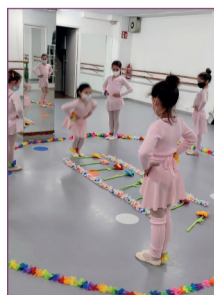
Ballet Infantil 3-7 años

Plaza Chavián, 5 • bajo Bertamiráns - Ames T. 981 891 897 - 677 555 748 info@orbitainfantil.com