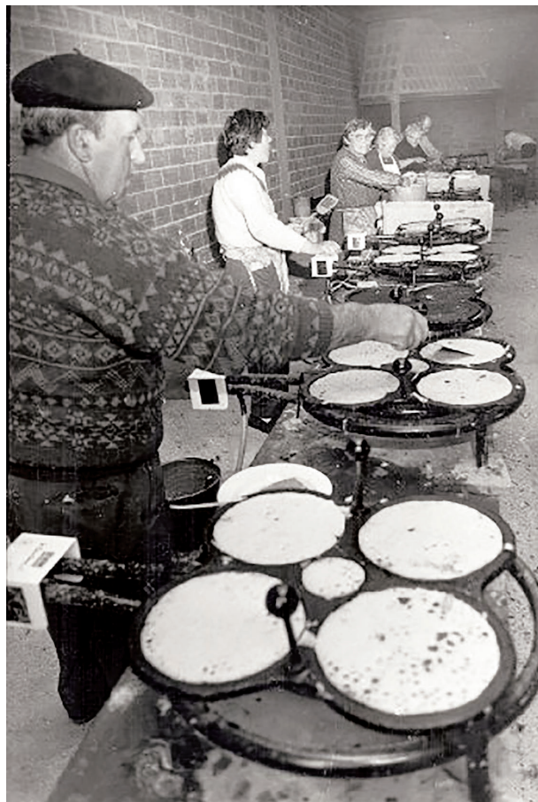
Filloeiros de Lestedo en las primeras fiestas.

La filloa es la sobremesa de carnaval por excelencia y consiste en una masa preparada a base de leche, harina y huevos que admite diferentes formas de preparación. En Lestedo es posible degustarlas solas, rellenas de miel, de chorizo... Las filloeiras