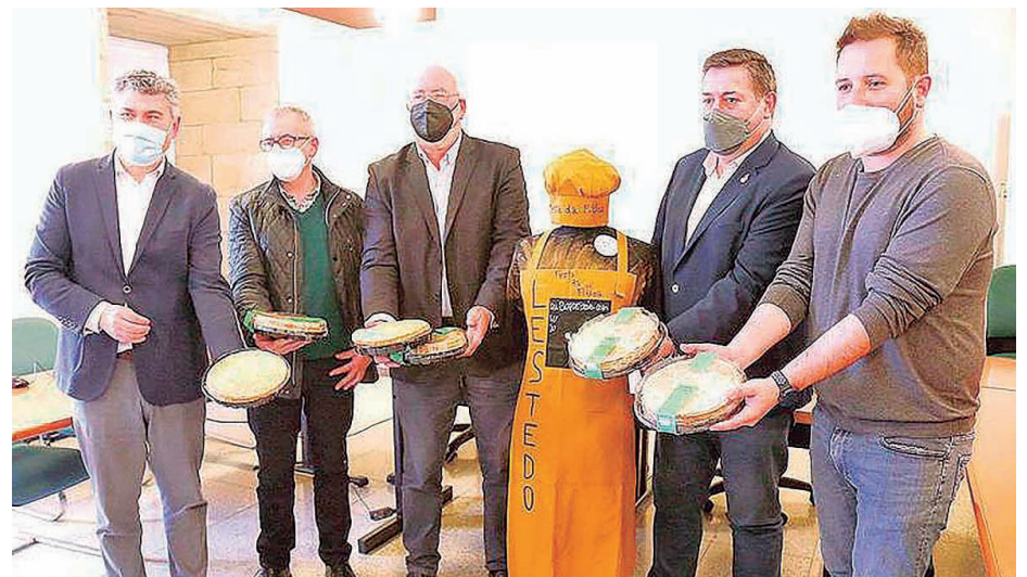
Autoridades durante la presentación en Santiago de la fiesta gastronómica.