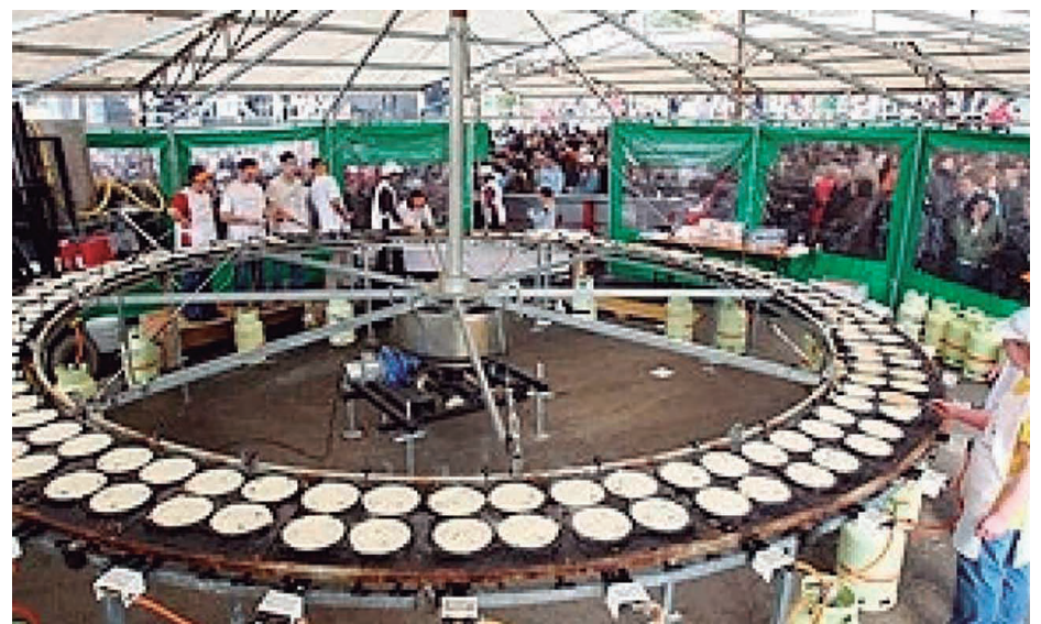
La máquina filloira trabajará sin parar el domingo durante once horas.

MEDIDAS COVID. En cuanto a las medidas la organización cuenta con una empresa especializada que velará porque se cumpla la normativa. La fiesta, al contrario que otros años, estará dividida por zonas y pedirán el pasaporte covid. Una de ellas será para comer y beber y otra para bailar. En la segunda estará prohibido comer, beber y fumar. Asimismo, en esta edición no habrá filloira de piedra y las filloas que se den estarán envasadas.