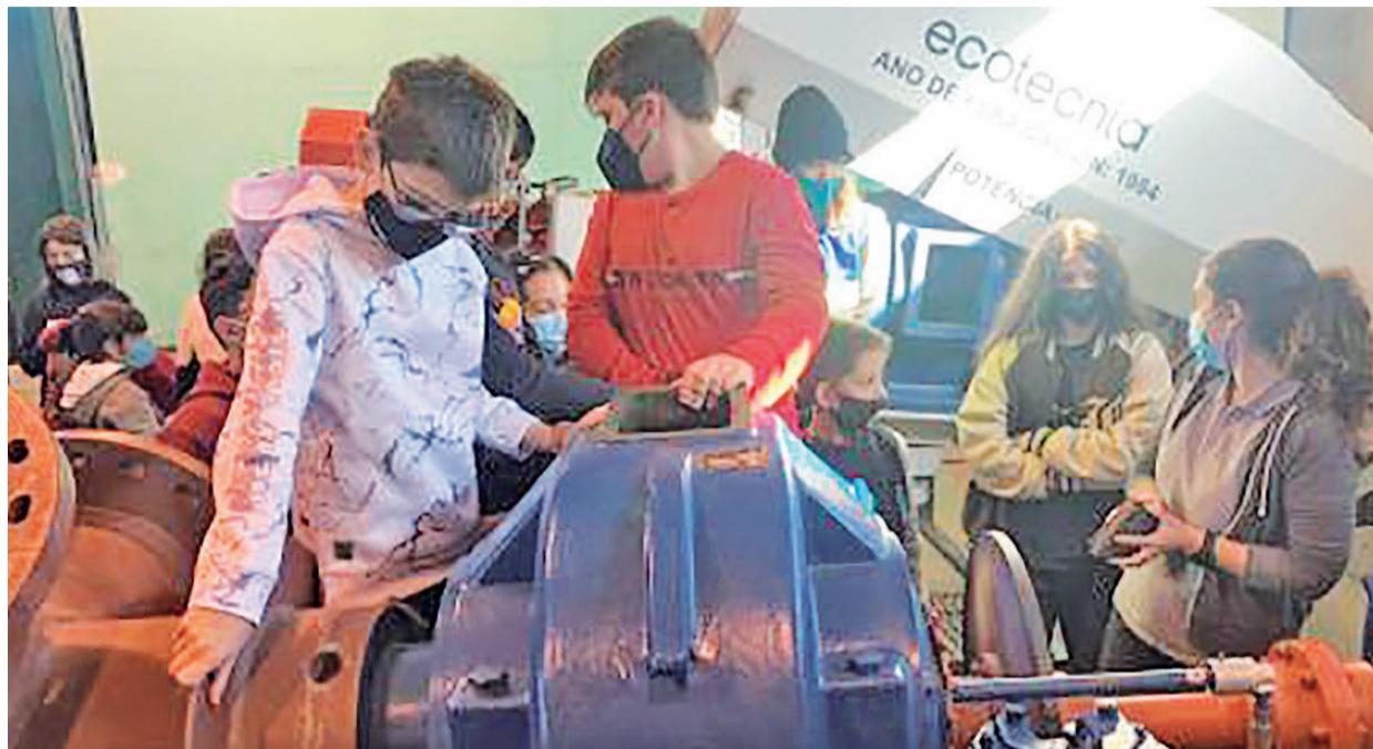
Los más jóvenes de Arzúa serán premiados con el Arzuán do ano por su responsabilidad ante la pandemia.

En total se entregarán seis galardones en los Arzuáns do ano de los que tres tendrán carácter colectivo. Uno de ellos, para los niños y niñas de Arzúa por su comportamiento en estos dos años de pandemia; otro para el personal sanitario del centro de salud; y el tercero, para la residencia San José por el cuidado a los