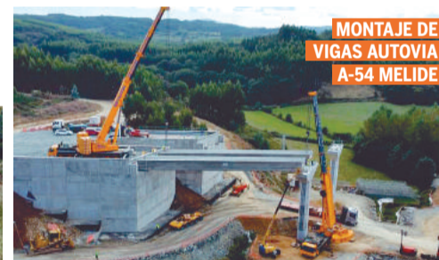
MONTAJE DE VIGAS AUTOVIA A-54 MELIDE

OFICINAS: ESCLAVITUD: Tel. 981 803 560 • Fax 981 803 558 SANTIAGO (Pol. Tambre): Tel. 981 509 806 PONTEVEDRA: Tel. 649 901 400 www.gruasestacion.com