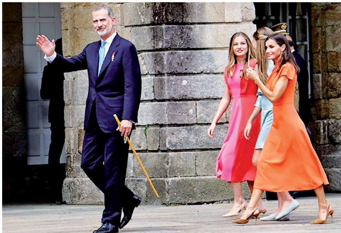
Los reyes, la princesa Leonor y la infanta Sofía en su reciente visita a Compostela.