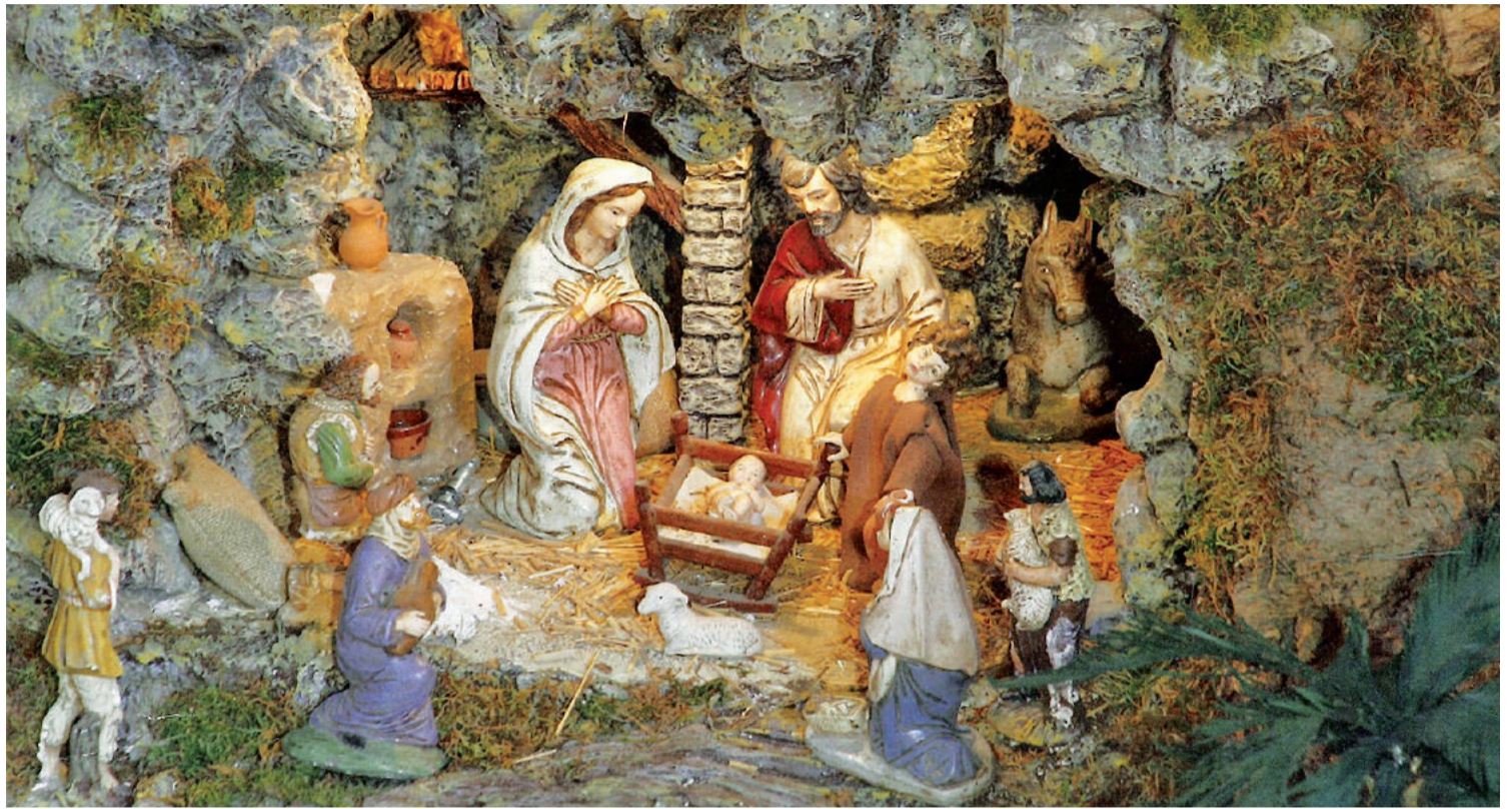
Detalles del Belén de Rubiá, que ocupa unos cincuenta metros cuadrados e incluye más de 500 figuras

Pero ¿qué hacemos en el último pueblo de Ourense, viendo o cómo despierta un belén imponente? Queremos aprender, como dice Núñez, “a mirar el belén con los ojos del alma”. A desentrañar los secretos de una tradición que se remonta al siglo XIII: está documentado que fue san Francisco de Asís quien decidió acompañar la misa de Nochebuena de 1223 en la localidad italiana de Greccio con una representación del Nacimiento de Cristo. El santo de Asís, previo permiso del papa Hon-