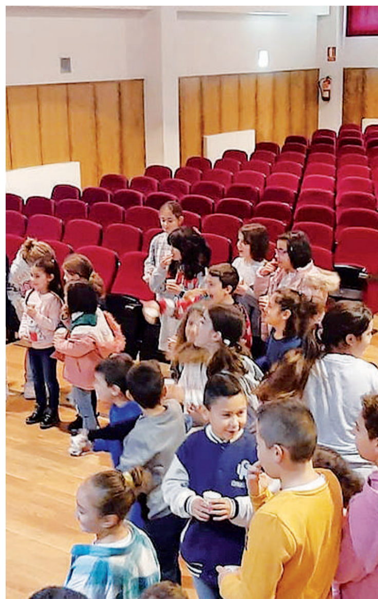
Os nenos e nenas do Pino celebraron unha festa de fin de ano.

A cativada de Frades tamén ten anotada na axenda a visita a Melchor, Gaspar e Baltasar. Sairán ás 16.00 horas a facer un percorrido polas rúas de Ponte Carreira. E ás 17.00 celebrarase unha gran festa no polideportivo municipal con recepción dos Reis, inchables, animación, bailes, xogos, canón de neve, obradoiros, mascotas, lambonadas e chocolate con roscón. O 2023 chega cargado de eventos.