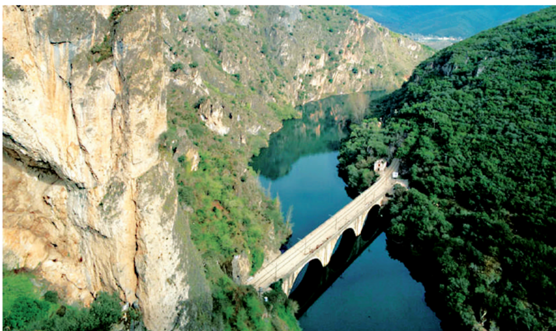
Dos imágenes de parajes naturales de gran valor ecológico y belleza paisajística en Rubiá, Ourense