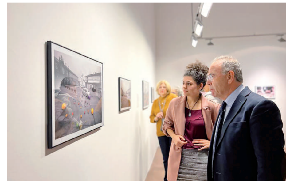
El alcalde durante la inauguración de la exposición Utópicas Arte y Territorio

Trabajo, felicidad y salud para todos los vecinos y vecinas. Y estabilidad para toda la ciudad.