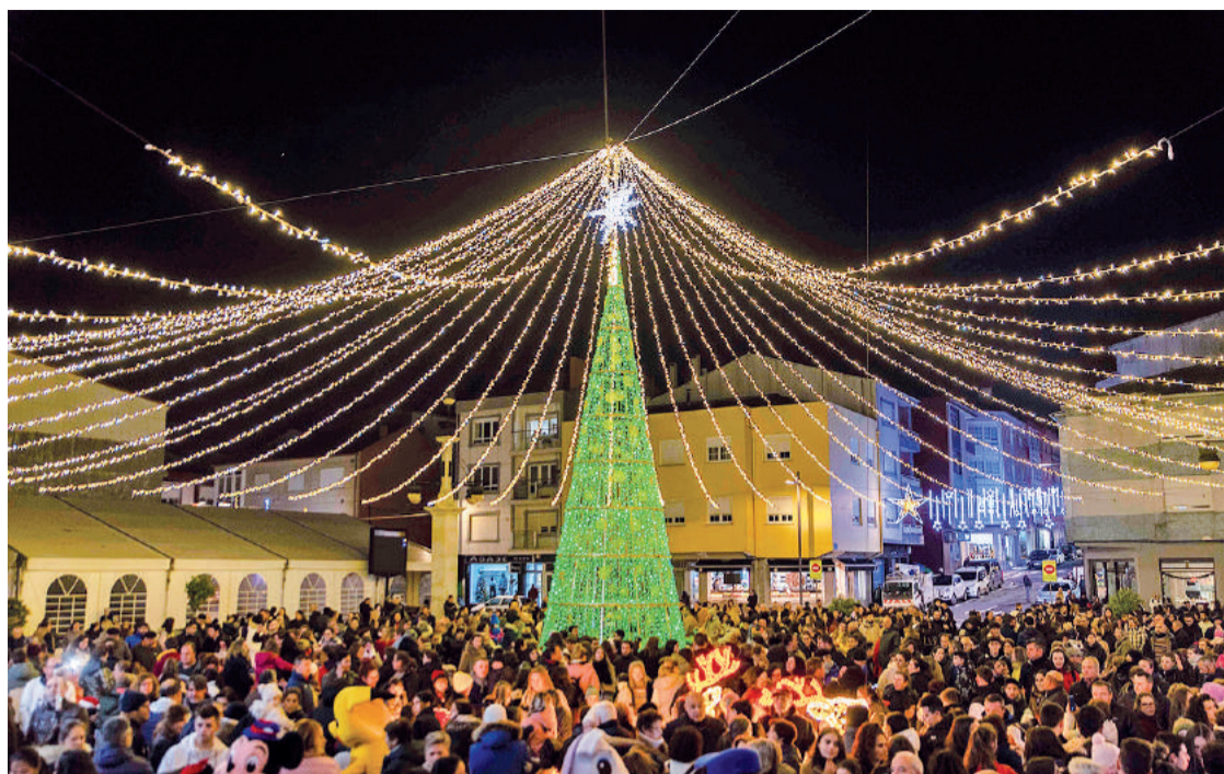
Os nenos e nenas de Vimianzo despedirán o ano este mediodía na Praza do Concello.

NADAL. En Mazaricos máis de cen persoas competirán na xa tradicional Carreira do Leite // A proba atlética rematará co Brinde Leiteiro na praza da capital municipal TEXTO J. M. Ramos