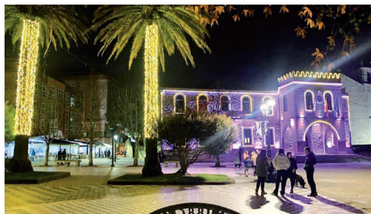
A Alameda noiesa e a fachada do concello iluminada por Nadal.

O alcalde e a Corporación deséxalles aos veciños e veciñas que “teñan unha boa entrada do aninovo” e agardan que estean a gozar das diferentes actividades programadas.