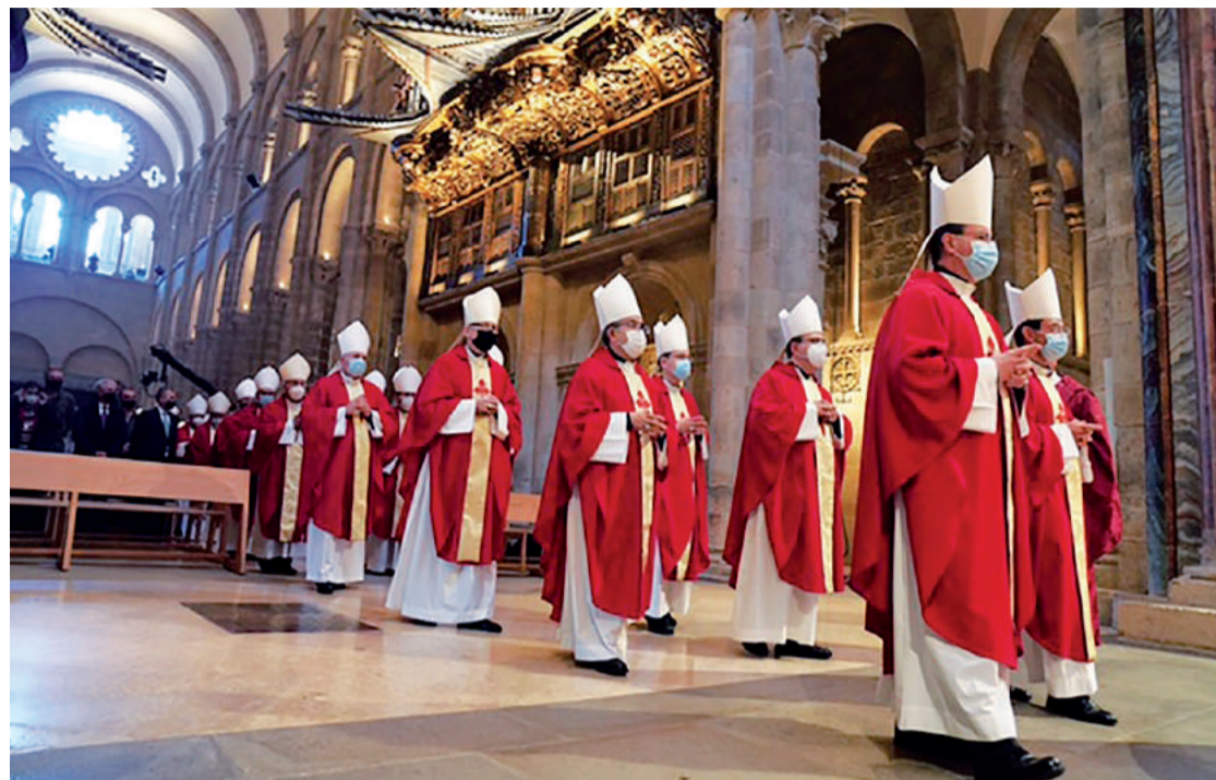
El Cardenal Omella, presidente de la Conferencia Episcopal, y 63 cardenales y obispos también peregrinaron a Santiago

Esas dos excepciones hallaron una estrecha semejanza cuando el Papa Francisco, que dirige hoy la Iglesia, teniendo en cuenta la pandemia que nos ha aquejado fundamentalmente en los años 2020 y