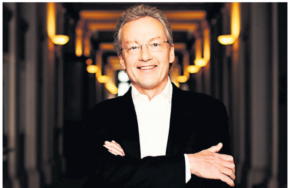
Franz Welsler Most, director austríaco del Concierto Año Nuevo 2023.