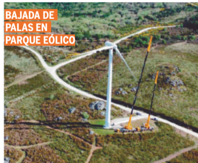
BAJADA DE PALAS EN PARQUE EÓLICO