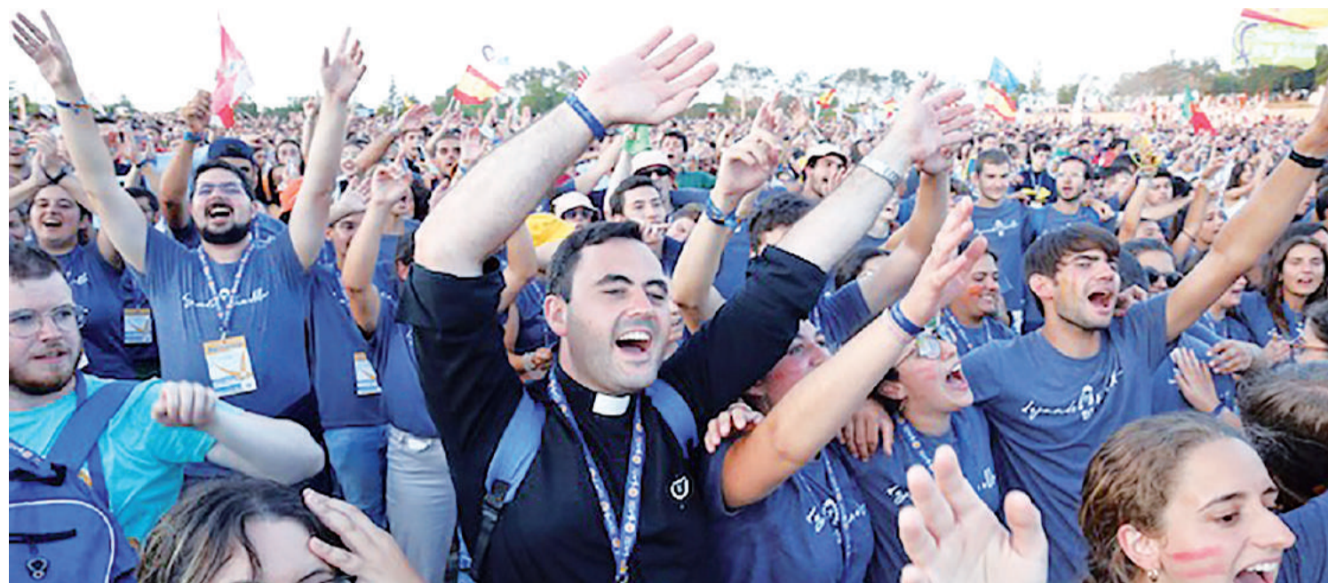
Júbilo en una de las peregrinaciones multitudinarias que se despiden de Santiago tras cumplir con el ritual

Los sábados, desde la primavera hasta Navidad, había una Vigilia para los Peregrinos, de 20'30 a