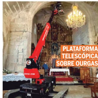
PLATAFORMA TELESCÓPICA SOBRE OURGAS