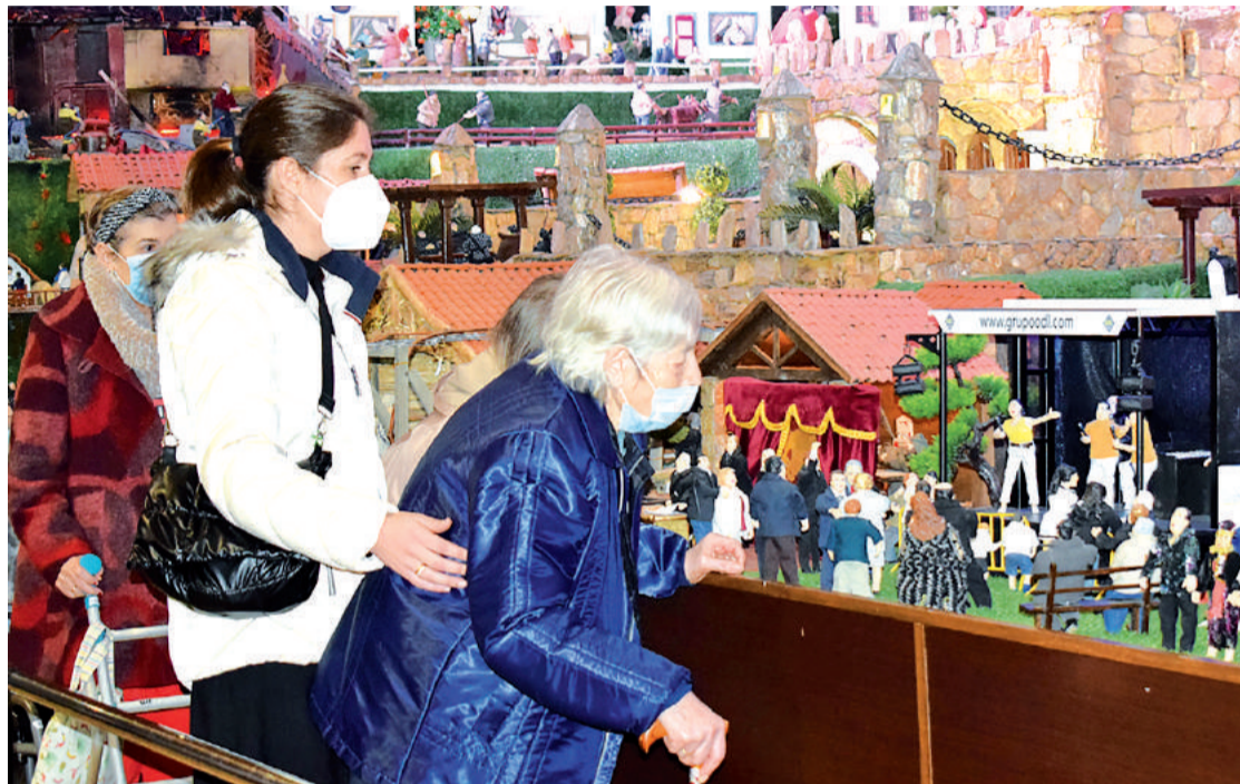
Os usuarios e usuarias dos centros de día galegos tamén disfrutaron con nacemento artesanal.

Non foron os únicos nenos que se achegaron ao nacemento, que tamén recibiu aos participantes na ludoteca de Nadal do Centro de Ocio