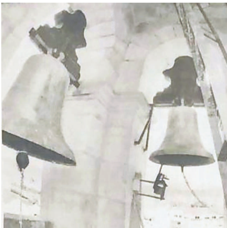
Resonarán las campanas en Santiago el 30 y 31 de diciembre.