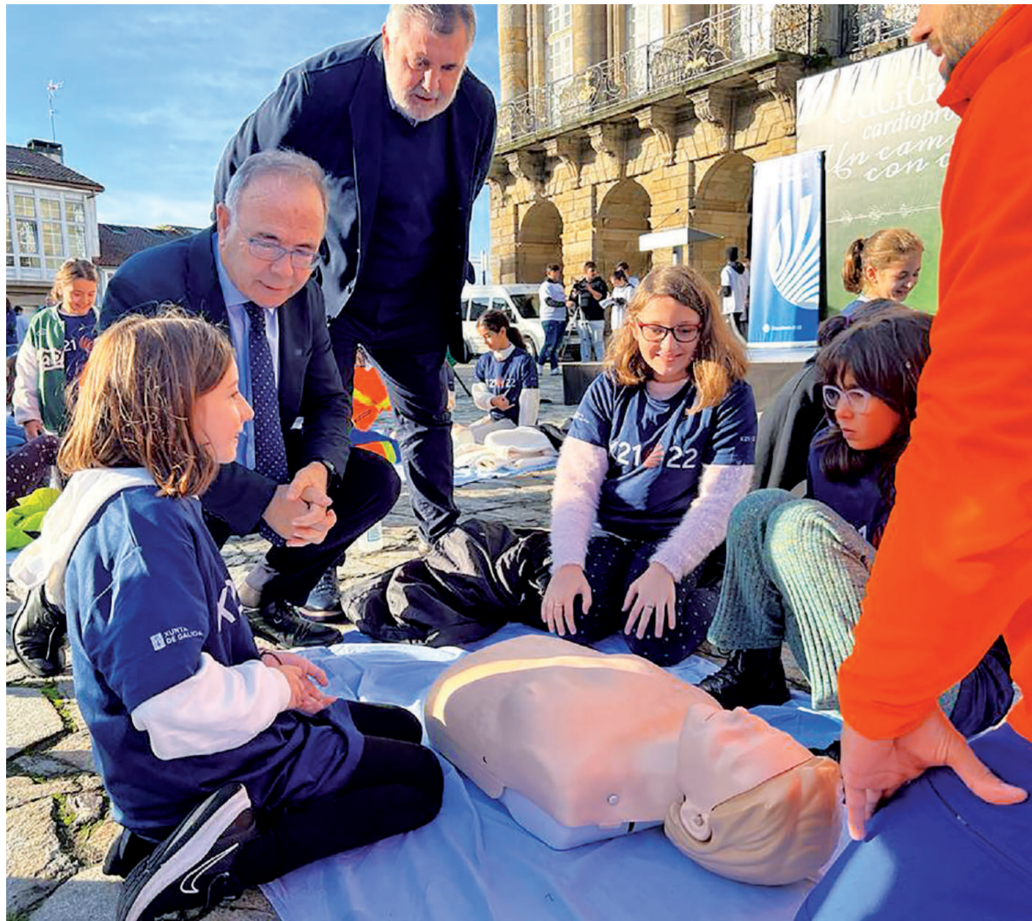
A PIE DE CALLE. Cercanía que trasmite el alcalde durante una jornada sobre primeros auxilios con alumnado del López Ferreiro

Hicimos lo que había que hacer y lo que los ciudadanos demandaban. En todo caso, en obras hay que decir que iniciamos el mandato con cinco prioridades, definidas por unanimidad de toda la corporación, y las cinco están en ejecución o encaminadas: la intermodal está acabándose, la previsión es que esté finalizada en el 2024 con la incorporación de la terminal de viajeros; el Orbital está previsto terminarlo a la vuelta del próximo verano; el Orbitaliño, espero que