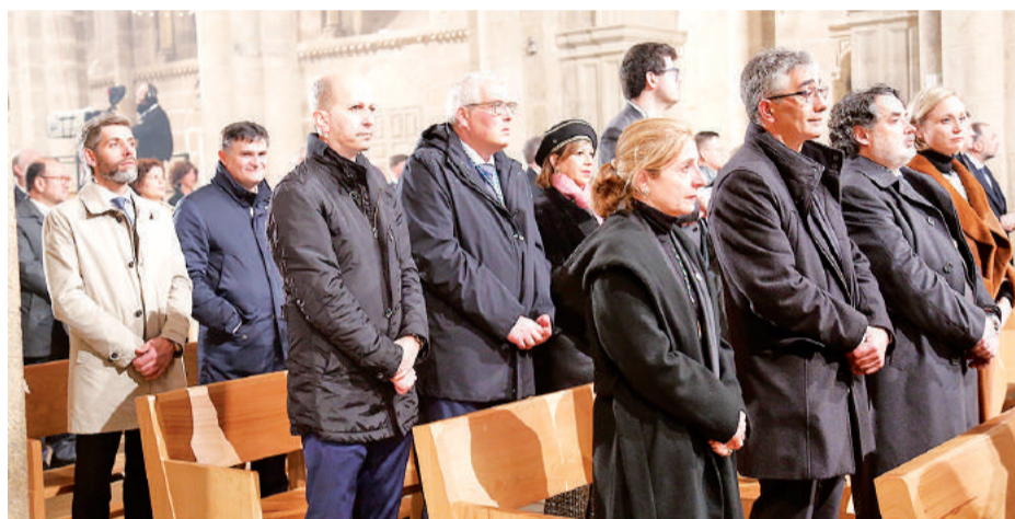
CIERRE DE LA PUERTA SANTA. Cuatro imágenes de ayer en la basílica compostelana reflejan, en apretada síntesis, la grandeza del ritual presidido por Monseñor Barrio.