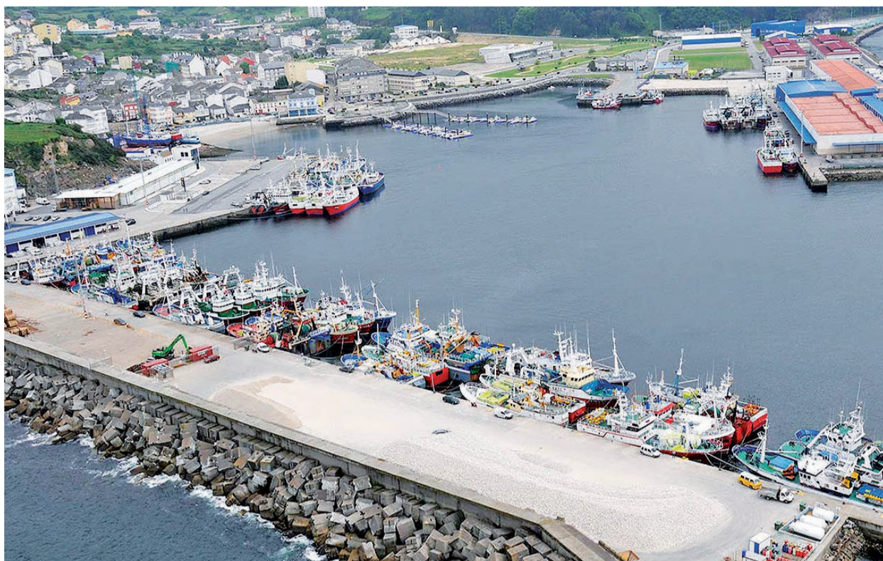
El puerto pesquero de Celeiro está ubicado en el municipio de Viveiro, en la costa lucense de A Mariña

Hay bastante documentación sobre este hospital que