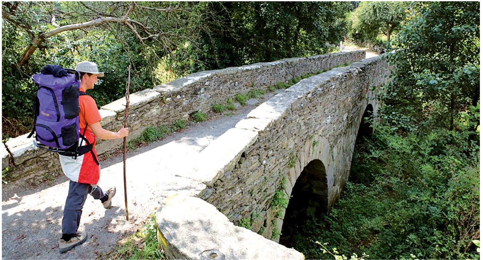
Peregrino caminando hacia la ansiada meta de Santiago de Compostela y disfrutando de uno de los entornos maravillosos del Camino

El Camino Francés recorre ocho municipios de Lugo