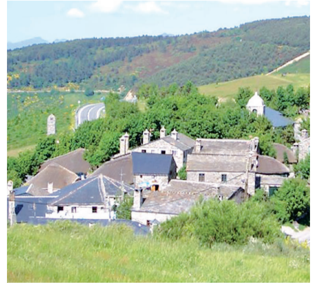
O Cebreiro-Triacastela, en el Camino Francés

La Cova Eirós es una cueva prehistórica situada en Cancele. Contiene un importante yacimiento arqueológico del Paleolítico Medio con más de 35.000 años de antigüedad.