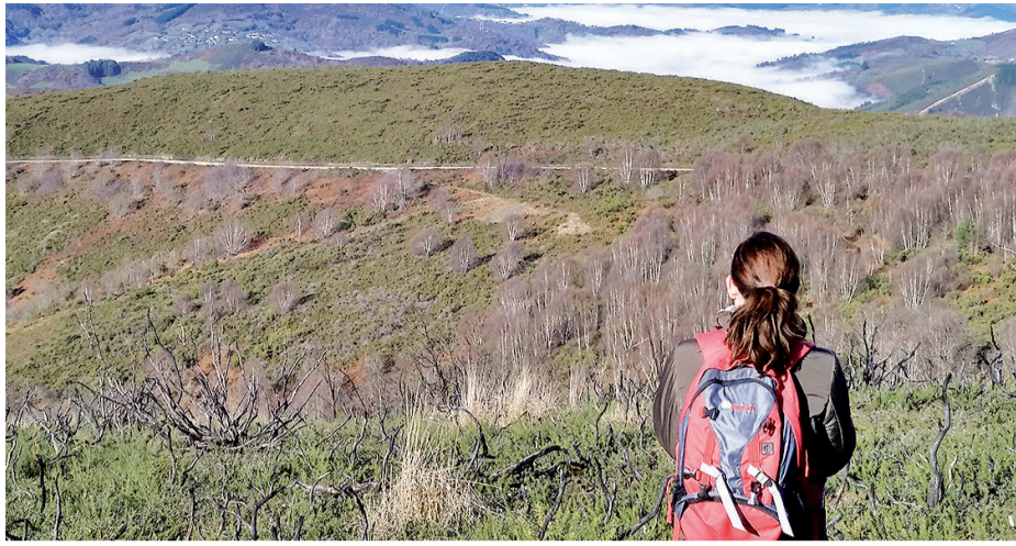
Vista del tramo del Camino que discurre entre Pedrafita do Cebreiro y As Nogais