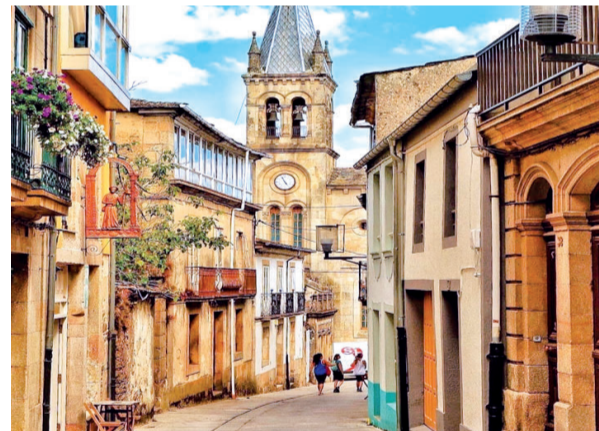
Imagen de una calle de Sarria, Lugo

Existe una Mancomunidad de Municipios del Camino Francés que engloba a los once municipios que atraviesa el Camino desde Pedrafita do Cebreiro hasta Santiago: O Cebreiro, Triacastela,