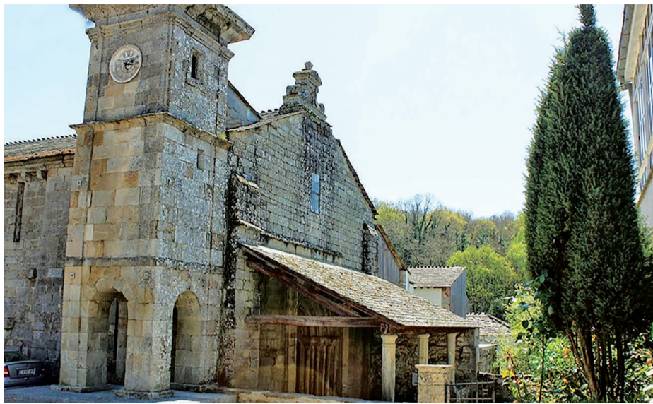
El viejo monasterio de Ferreira de Pallares en el concello de Guntín