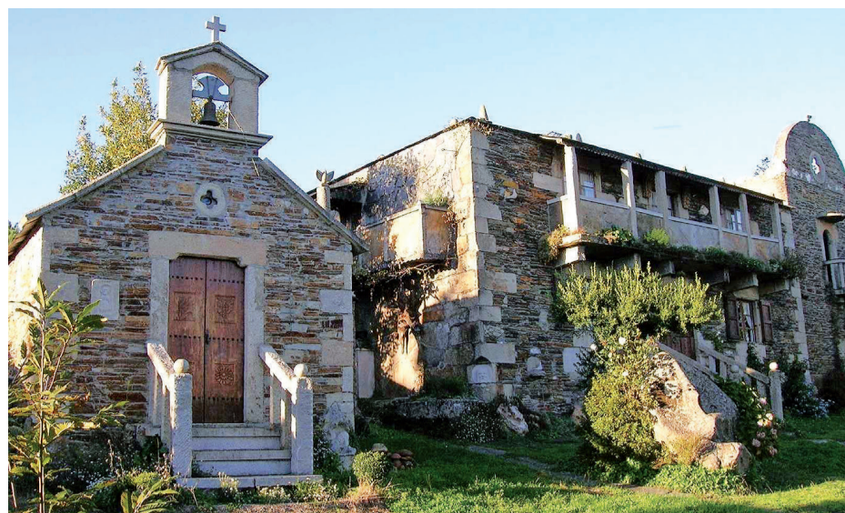
Baamonde en el Camino del Norte, donde existen rutas alternativas para llegar a Sobrado

Era poco conocido y tiene una menor masificación que el francés. El boom de la ruta norte comenzó en el 93. El Concello y los empresarios han hecho un esfuerzo para que su dinamismo tenga un retorno económico. A nivel humano enfatiza la relaciones interpersonales entre gentes de diversas nacionalidades.