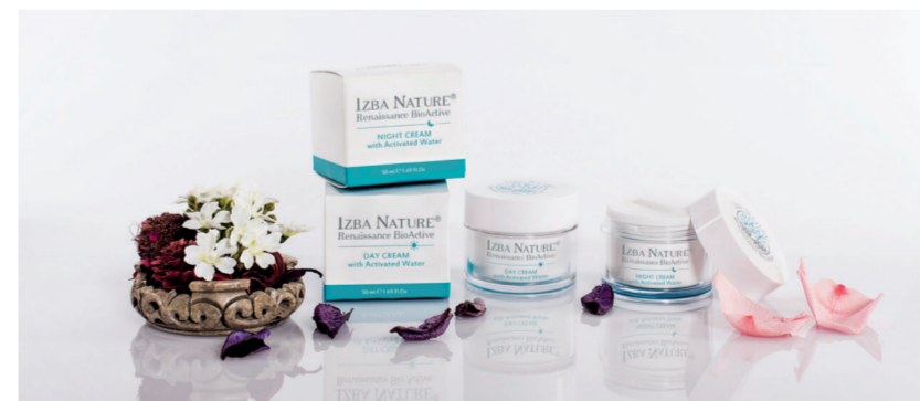
Pack Renovación Izba Nature / 62,30€

En Izba contamos con la línea de cosmética facial Renaissance BioActive , que supone un renacimiento para la piel, y que cuenta con limpiador, tónico, mascarilla, crema de día y crema de noche. Especialmente la crema de día Renaissance BioActive y la crema de noche Renaissance BioActive están desarrolladas para entre otros efectos, paliar la acción nociva de la radiación de la luz azul a la que nos ex-