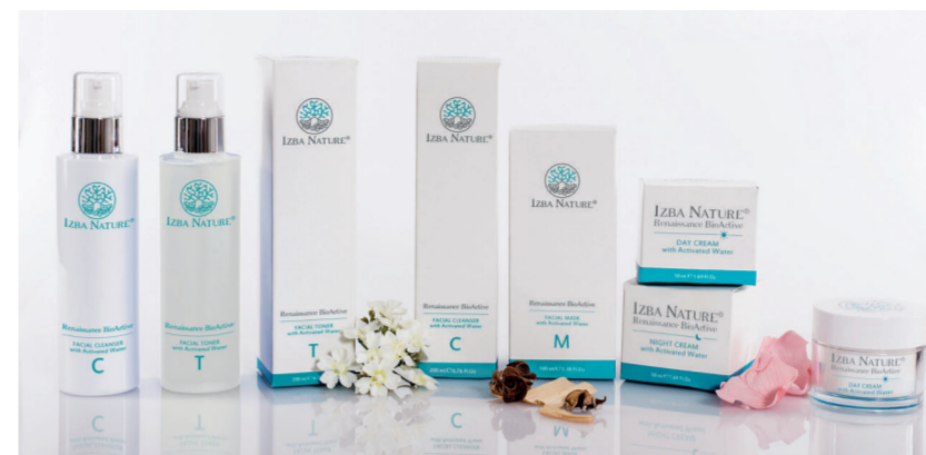
Pack de iniciación Izba Nature / 116,90€

Izba Nature es una empresa española donde desarrollamos, fabricamos y comercializamos cosmética 100% natural, biotecnológica y epigenética. Desarrollamos productos únicos, ya que seleccionamos los mejores ingredientes activos y los combinamos entre sí para que la eficacia sea mayor en cada aplicación. Empleamos ingredientes activos que son 100% naturales y apostamos por la biotecnología, ya que al emplear moléculas biológicamente más activas hace que cada ingrediente mejore su función. También hemos desarrollado Izba activated water , activando el agua que empleamos en nuestras formulaciones para así tener un agua viva, devolviéndole la estructura con la que aparece en la naturaleza; de esta manera pasa de ser un elemento portador a un ingrediente activo favoreciendo la reestructuración epitelial.