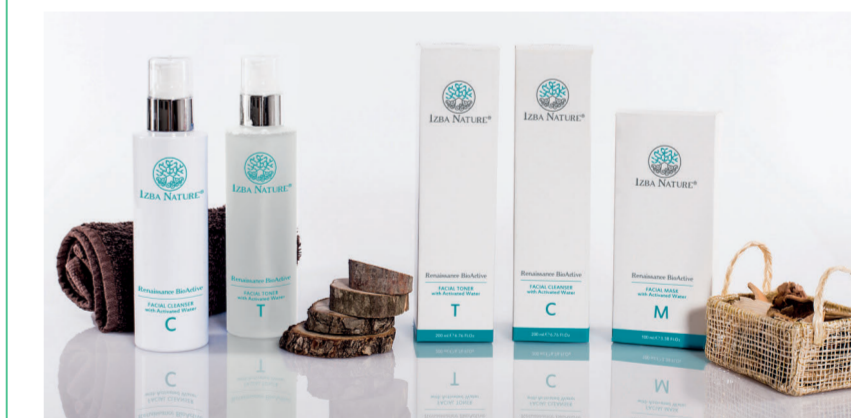
Pack limpieza Facial Izba Nature / 55,30€

Además de las cremas de día y noche Renaissance BioActive , la línea cuenta con el Limpiador Renaissance BioActive 20,30€, libre de tensoactivos que limpia y desmaquilla la piel en profundidad; el Tónico Renaissance BioActive 26,60€, un tónico equilibrante de pH muy activo, que limpia en profundidad, reduce poros, regula la glándula sebácea, difumina líneas, arrugas y manchas, y la Mascarilla Renaissance BioActive 19,60€, que es muy hidratante, calmante, aporta mucha luminosidad y combate el envejecimiento. Contamos además con una línea muy completa de tratamiento corporal 100% natural, basada en aceite y aromaterapia, con productos adelgazantes y remodelantes, circulatorios, descontracturantes, relajantes y afrodisiacos. Aquí hemos desarrollado sinergias de aceites esenciales y extractos botánicos sobre bases de aceites vegetales de primera presión en frío de bajo peso molecular para que la absorción sea muy rápida. Además de muy efectivos, son una verdadera delicia para los sentidos.