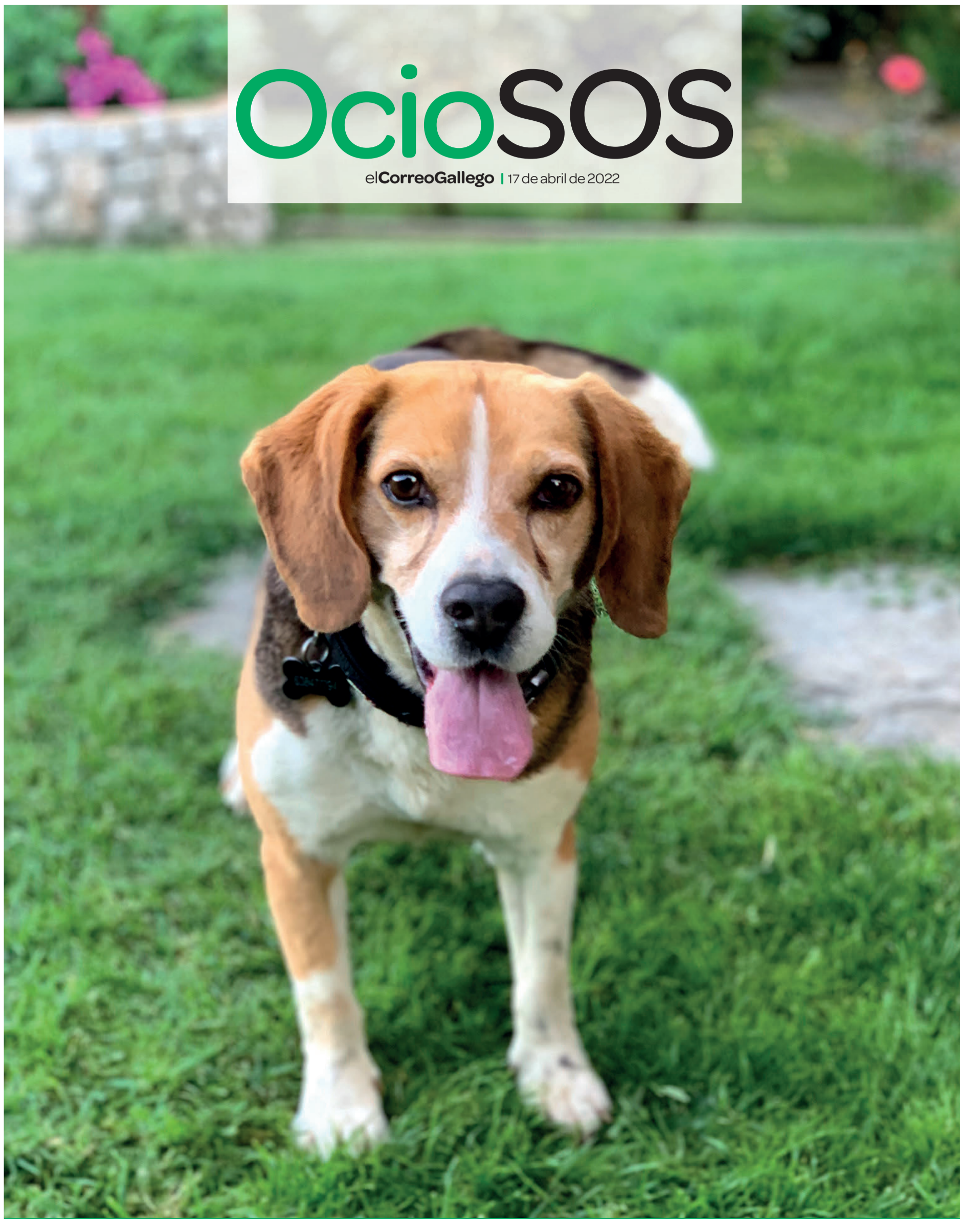
LOCALIZACIÓN: Verín, Ourense | MASCOTA: Tristán, beagle