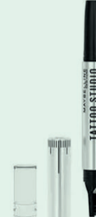
Tattoo Brow Lift Stick: 9,99€