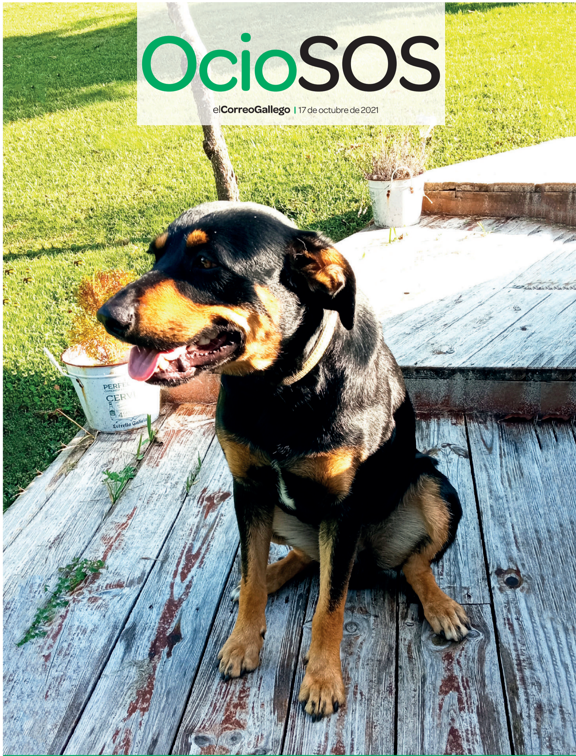
LOCALIZACIÓN: Salcedo (Pontevedra) | MASCOTA: 'Buxter', mestizo