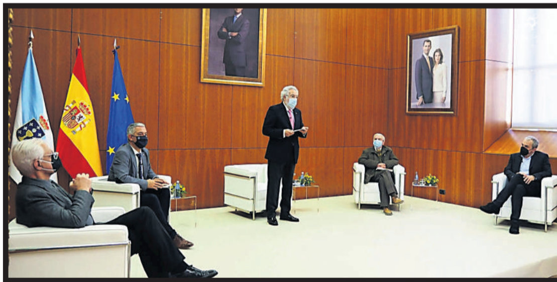
El presidente del Parlamento gallego durante su intervención en la presentación del libro dedicado a Celso Emilio