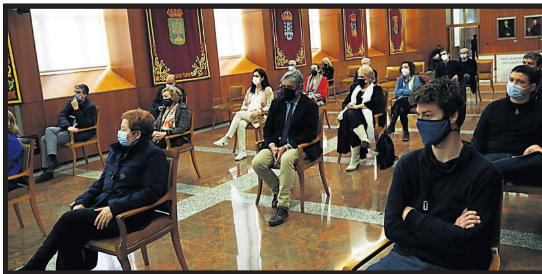
Público asistente al acto celebrado en el Salón dos Reis del edificio que acoge la Cámara gallega en O Hórreo