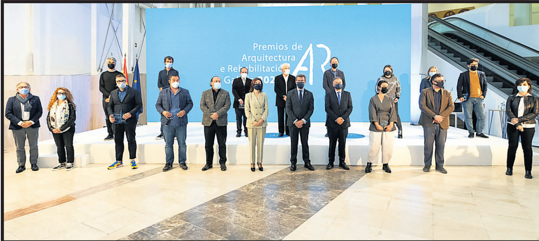
El presidente de la Xunta de Galicia, Alberto Núñez Feijóo,