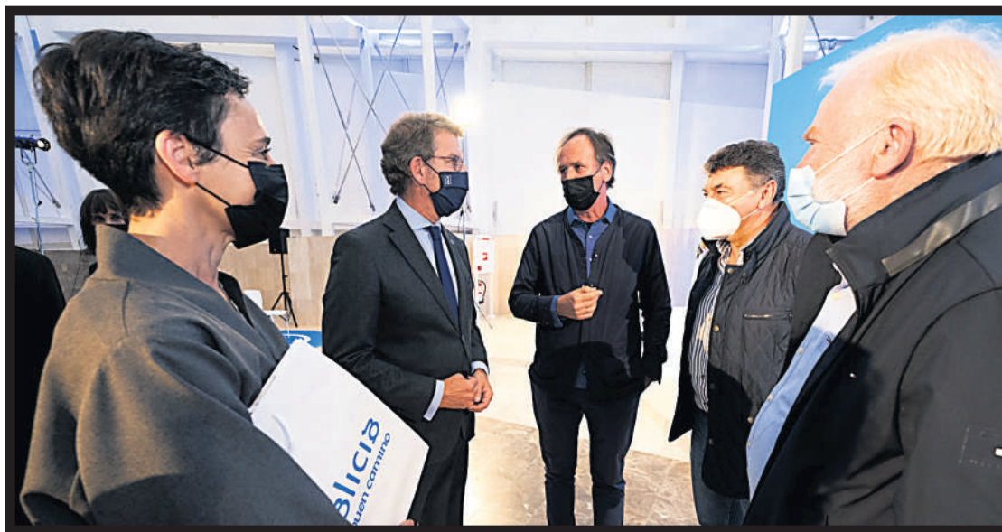
El presidente de la Xunta