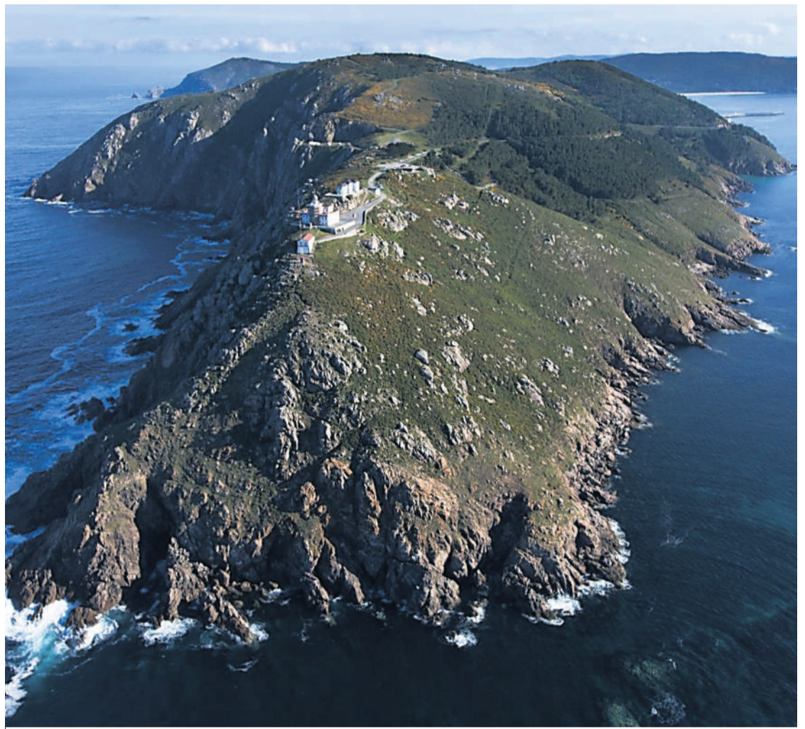
CABO FINISTERRE. Un lugar mágico en A Costa da Morte.

Atardeceres incomparables, belleza extrema, acantilados abismales, playas espléndidas, montañas rocosas y un patrimonio milenario caracterizan a este destino, un paisaje único con los arenales más grandes del litoral y senderos que rodean el mar desde Carballo a La-