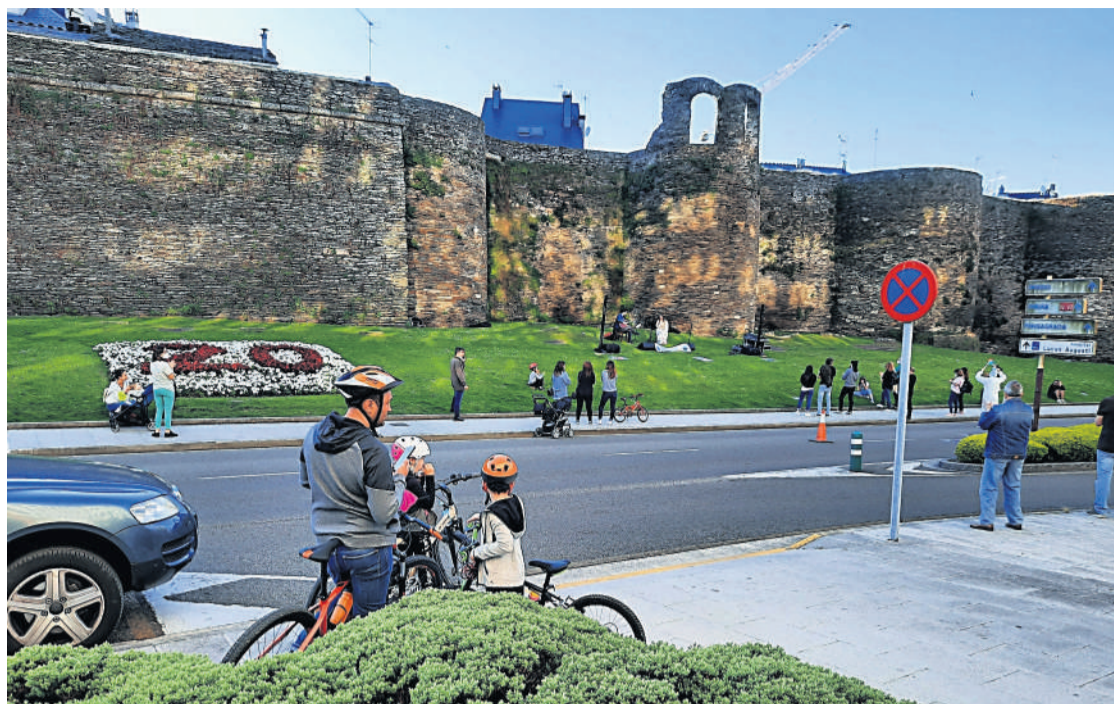
La Muralla, la única romana del mundo que se conserva íntegramente, atrae a miles de visitantes.

El Concello potenciará en Fitur el arte a través del Camino, así como veintiún itinerarios naturales, plagados de riqueza patrimonial, natural y paisajística, desde distintos puntos