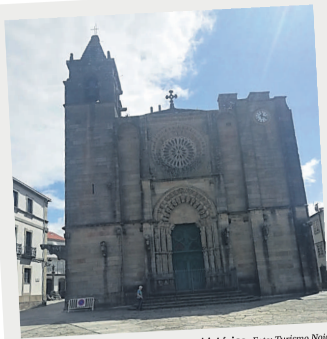
Iglesia de San Martiño, en el casco histórico.

Este territorio, cuyo origen se remonta a las culturas prehistóricas, cuenta con importantes elementos de su importante pasado, conservando vestigios de la época romana, así como edificios históricos, pero también con un precioso patrimonio natural, caracterizado por la ría de Muros-Noia, junto al río Tambre, y su excelente