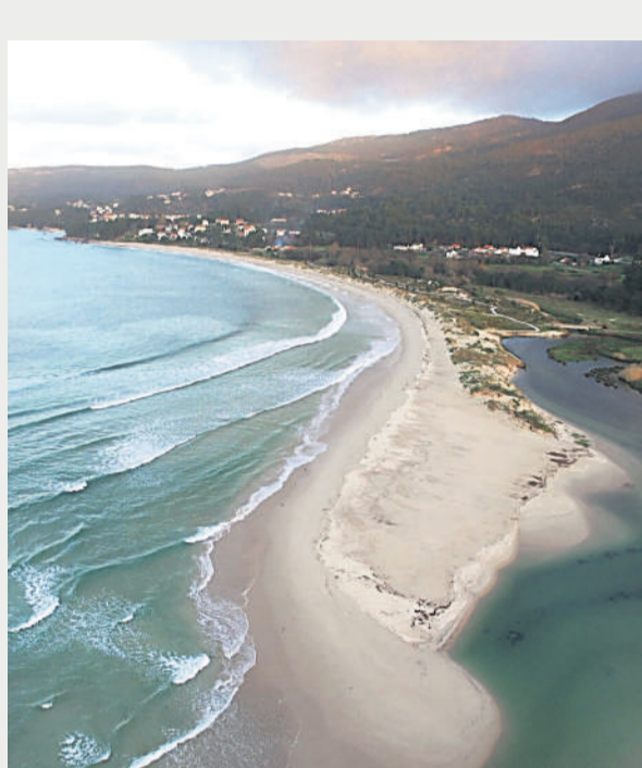
La playa de Aguieira es una de las más visitadas cada verano.

pio acoge a miles de turistas que acuden desde diferentes puntos del territorio nacional e internacional para disfrutar de sus playas paradisíacas y cálidas, ideales para dejar pasar el tiempo, disfrutar de una puesta de sol única o para realizar largos paseos, así como también de sus calas y miradores naturales sobre el océano Atlántico. Una de estas panorámicas se encuentra próxima a la Fervenza de Ribasieira, un paraje natural único.