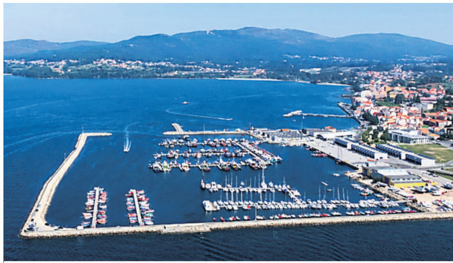
Vista aérea del puerto local y el pueblo al fondo.