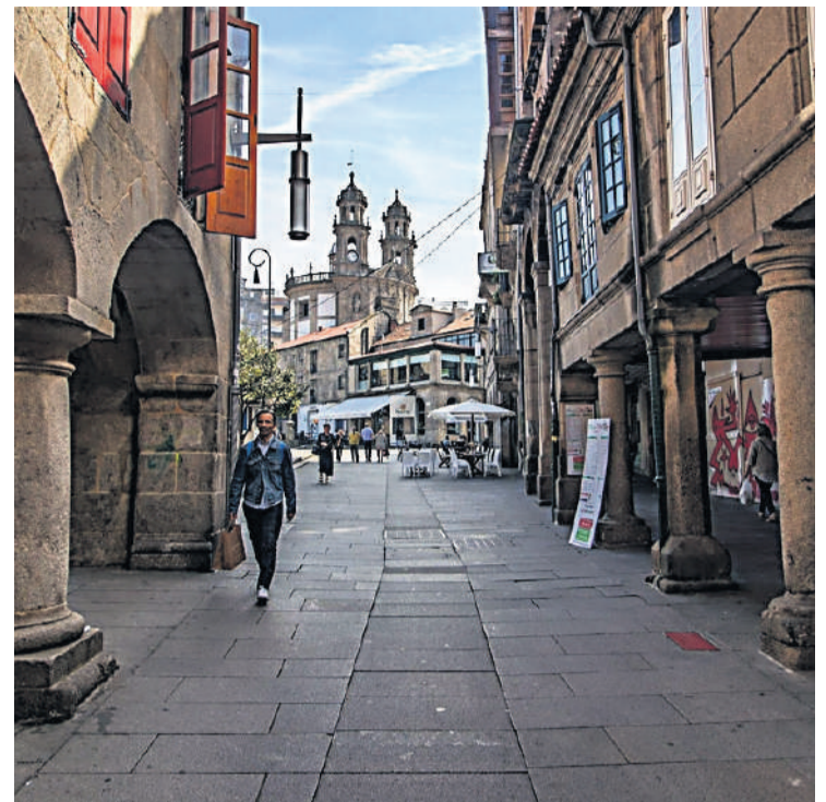
Pontevedra y su piedra invitan al paseo por sus calles.

VIGO. Corazón económico y social de As Rías Baixas y una de las áreas más dinámicas de Galicia en términos demográficos. Esta comarca resulta muy atractiva por su perfecta combinación de espectaculares paisajes,