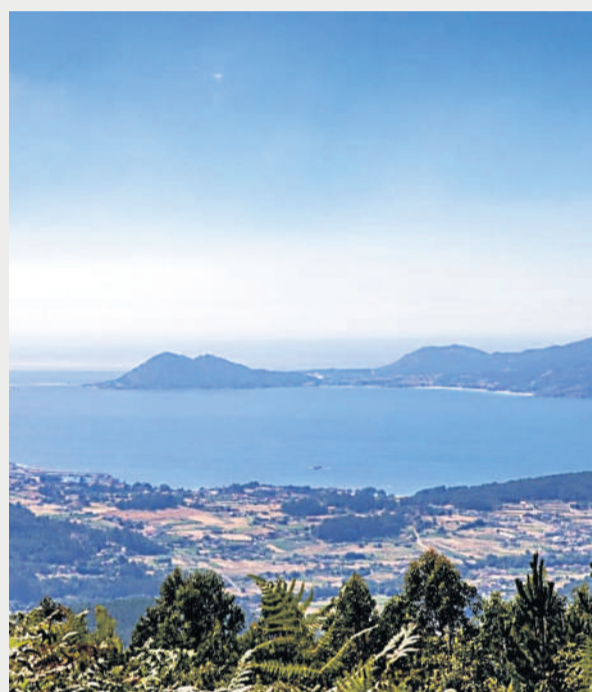
Panorámica de la Ría de Noia, desde el Monte Iroite.

gastronomía, vinculado a los productos KM0.