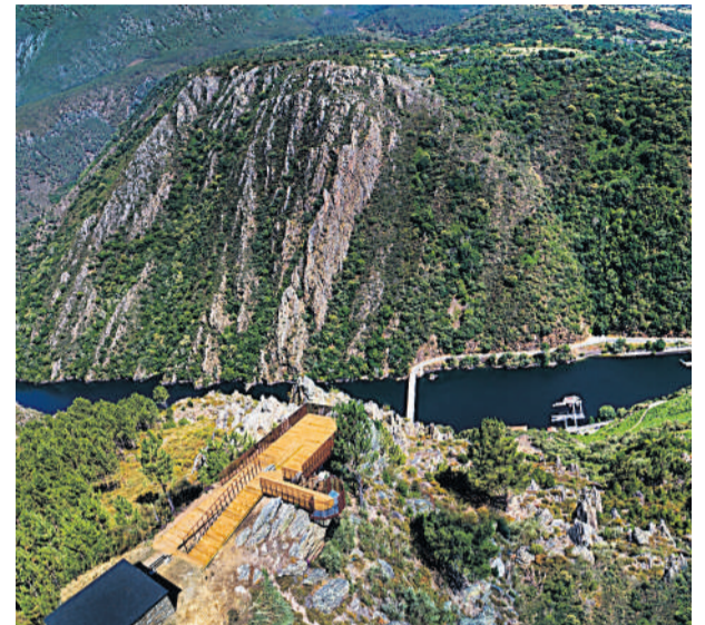
MIRADOR DO DUQUE. Uno de los mejores para contemplar la enorme belleza de este espacio.

Entre los museos de gran interés, destacan la Pinacoteca da Fundación Colexio Nosa Señora da Antigua (también conocido como el Escorial gallego o Los Escolapios ), el Museo das Nais Clarisas, catalogado como uno de los mejores museos de España de arte sagrado y arte italiano del siglo XVI; el Museo del Pazo de Tor, magnífico ejemplo