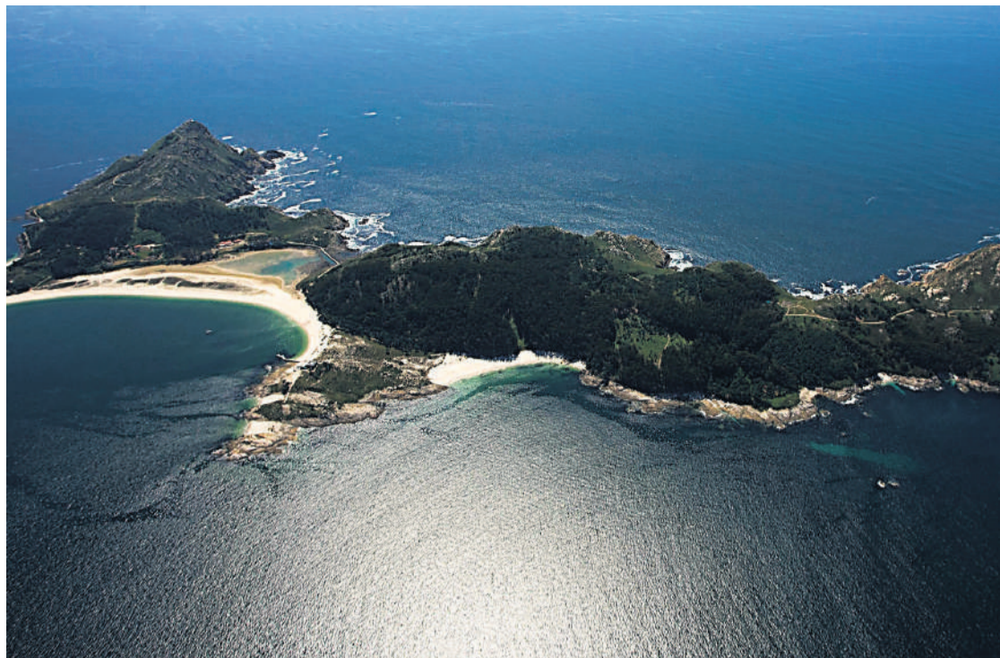
Panorámica de las Islas Cíes, que presiden la vista desde la ciudad de Vigo.

Ya sea en el interior o en la costa, la provincia presenta una gran riqueza turística, con visitas imprescindibles y únicas para cualquier persona que aterrice en nuestra comunidad