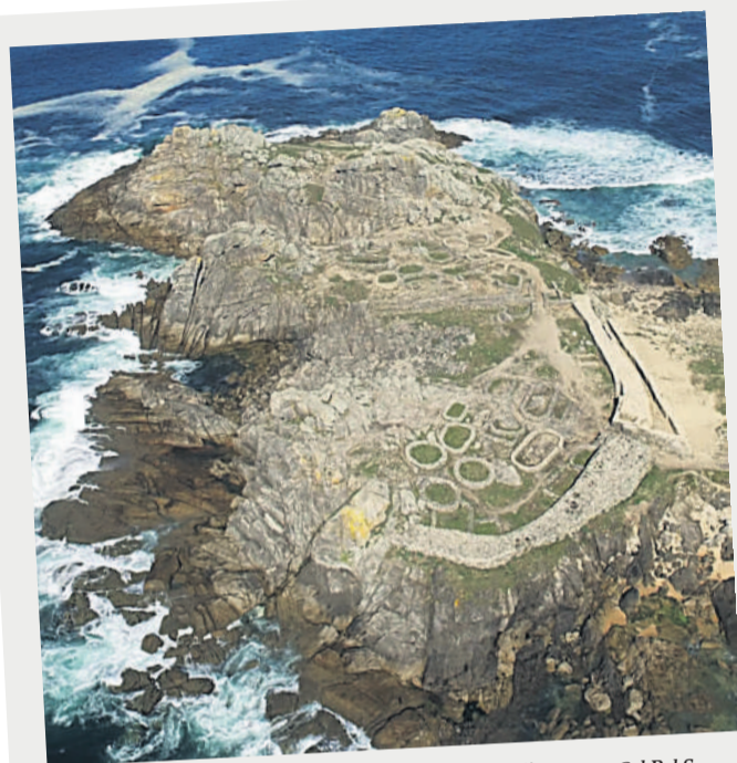
Vista aérea del reconocido Castro de Baroña.