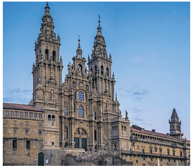
CATEDRAL DE SANTIAGO. La fachada de la Plaza del Obradoiro vuelve a lucir sin andamios, en su máximo esplendor.

A esa sensación de cercanía de la naturaleza contribuyen sin duda desde hace ya siglos los jardines históricos -el conjunto formado por el