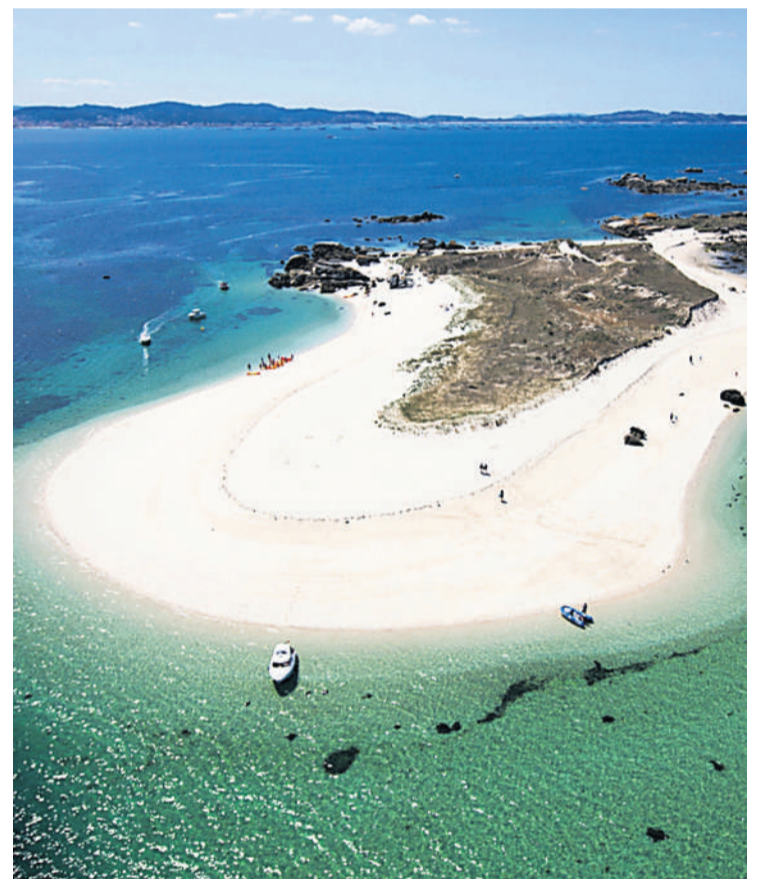
Entre la belleza de la Ría de Arousa, destaca el illote Areoso.

valiosos monumentos y centenarias tradiciones, que dejan una huella imborrable en la memoria de cualquier visitante.