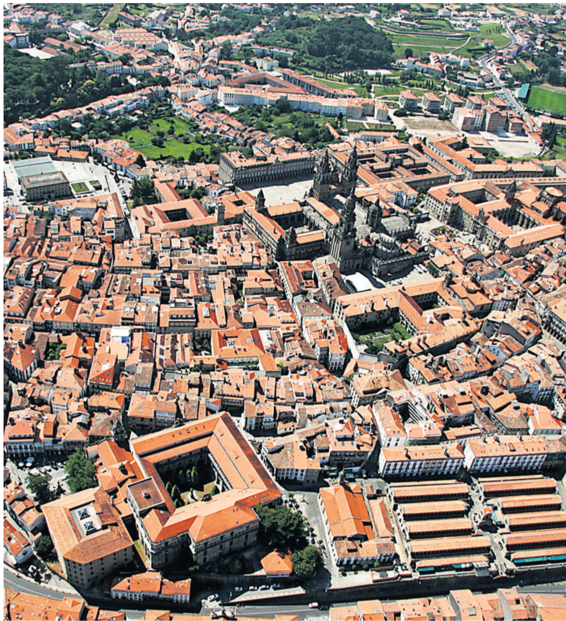
Santiago y el Xacobeo 2021-22 serán ejes centrales de la estrategia turística de Galicia.

La comunidad disfrutará de una presencia destacada en la Feria, con el Xacobeo como principal eje // Se promociona un destino de calidad y seguro en base al contexto sanitario