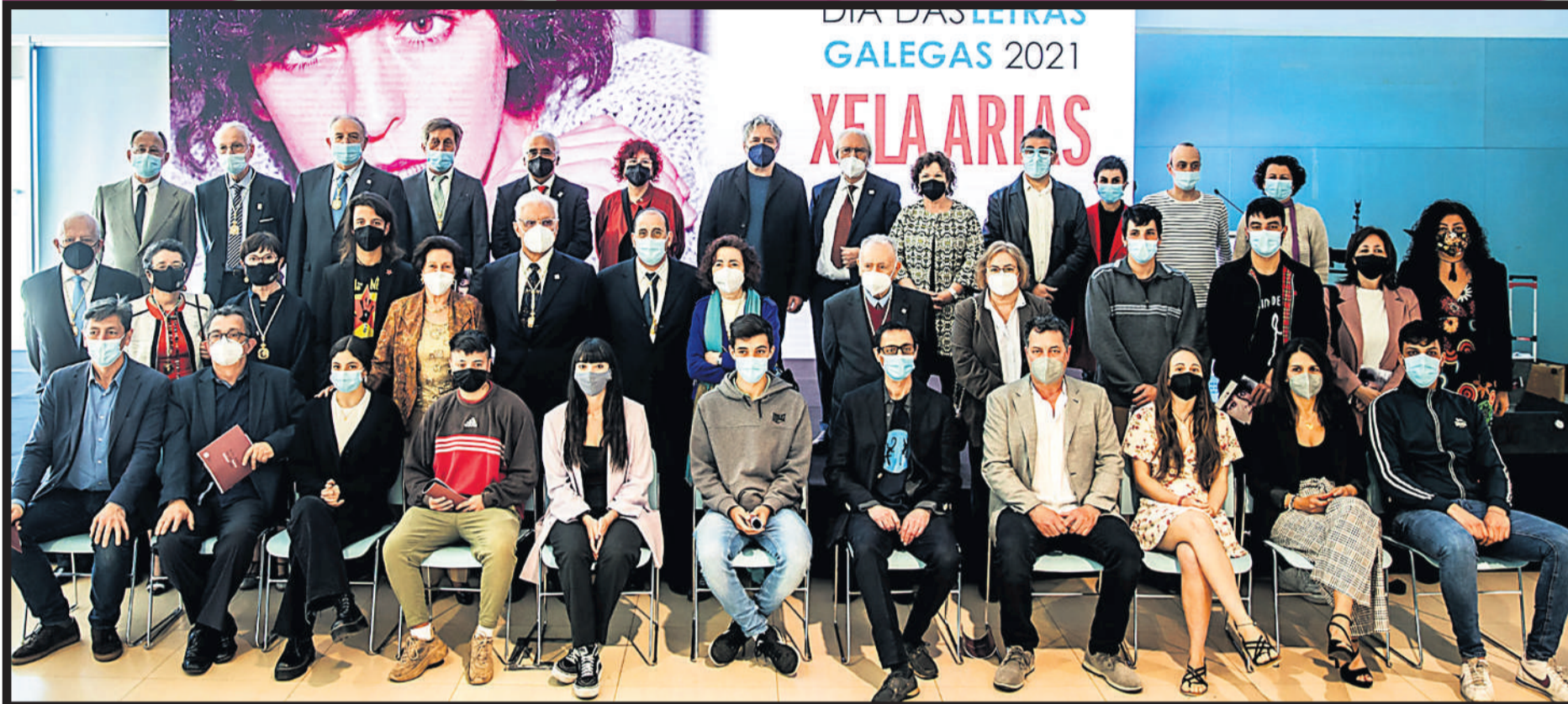
Membros da Real Academia Galega asistentes ó pleno extraordinario celebrado no auditorio Mar de Vigo con algúns dos asistentes ó acto principal do Día das Letras Galegas adicado a Xela Arias