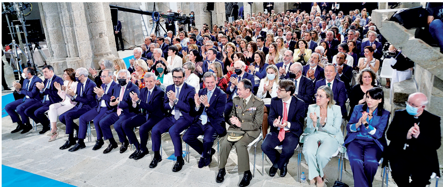
Autoridades y representantes de distintos sectores, asistentes al acto de imposición de las Medallas celebrado el martes en Bonaval.