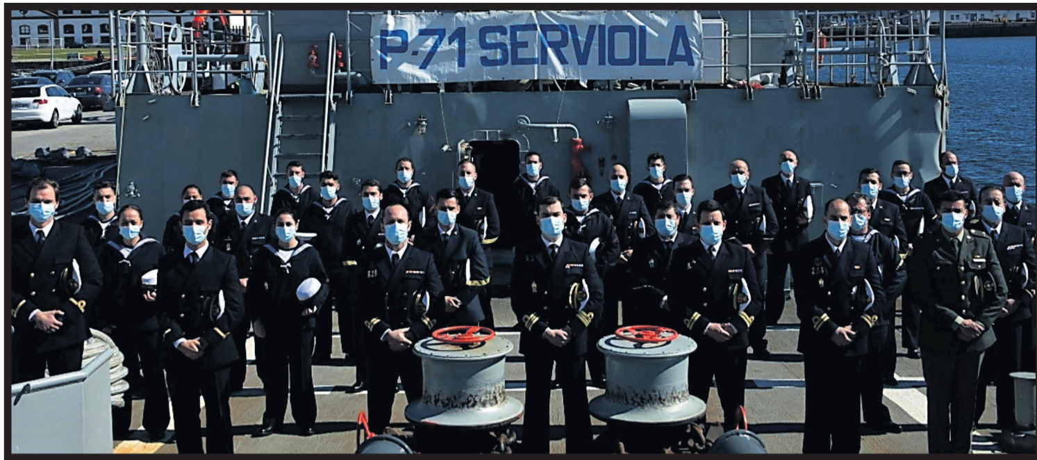
EL PATRULLERO 'SERVIOLA' CUMPLE 30 AÑOS. El patrullero de altura Serviola , cuya dotación actual se puede ver en la fotografía, cumple 30 años de su entrega a la Armada. Primero de una serie de cuatro buques construidos por la Empresa Nacional Bazán (hoy Navantia), se comenzó su construcción en diciembre de 1989. Con base en el arsenal militar ferrolano, el buque está encuadrado dentro de las Unidades de la Fuerza de Acción Marítima en Ferrol, al igual que el Centinel y el Atalaya .