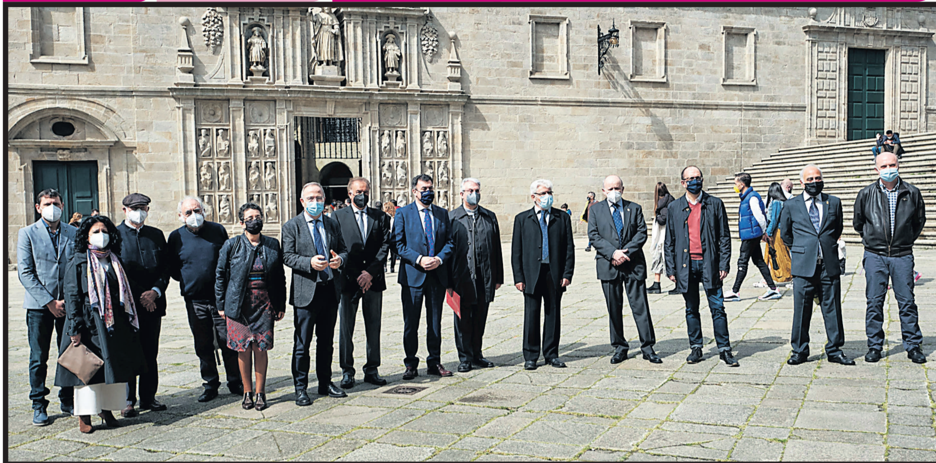
Miembros de la Real Academia Galega de Belas Artes con las autoridades en la compostelana plaza de A Quintana una vez celebrado el homenaje al arquitecto Domingo de Andrade en la Catedral