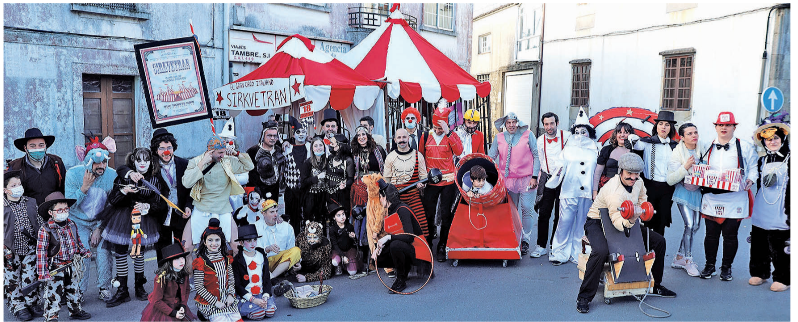
ANIMADO DESFILE DE ENTROIDO EN NEGREIRA. Las calles de Negreira fueron el escenario del tradicional desfile y concurso de disfraces, comparsas y carrozas. El desfile fue un éxito de participación y asistencia, con miles de personas disfrutando con los participantes y la actuación musical de la Orquesta Miramar en la carpa municipal de la Praza do Concello, amenizando el Entroido antes de la entrega de los premios.