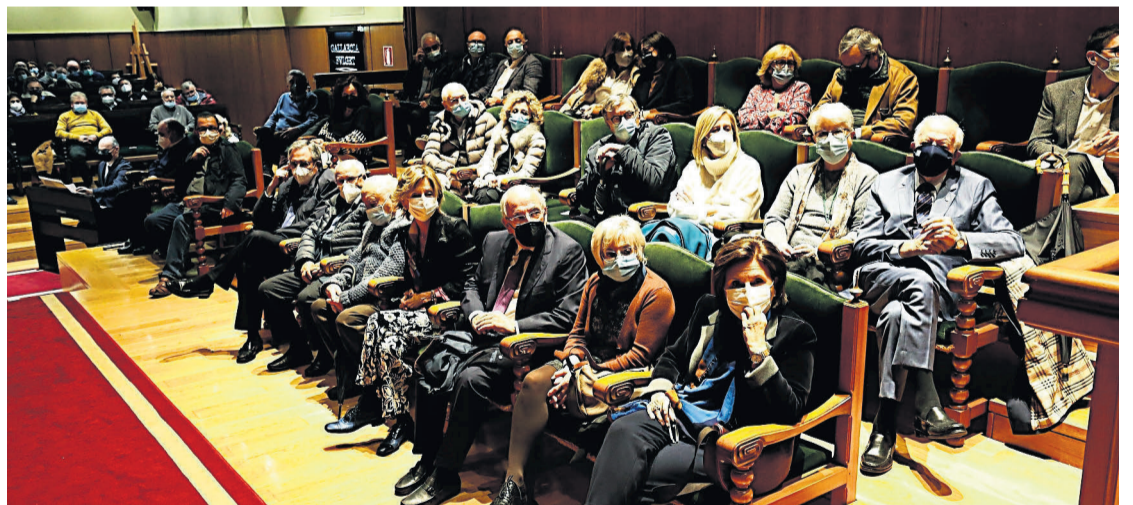
Algunos de los asistentes permanecen atentos a las intervenciones durante la presentación del libro