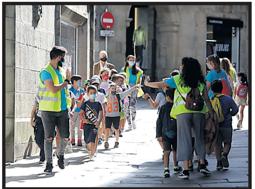
DON BOSCO. Los niños y niñas participantes en el campamento urbano Don Bosco durante uno de sus paseos por la ciudad para realizar visitas culturales en la capital gallega