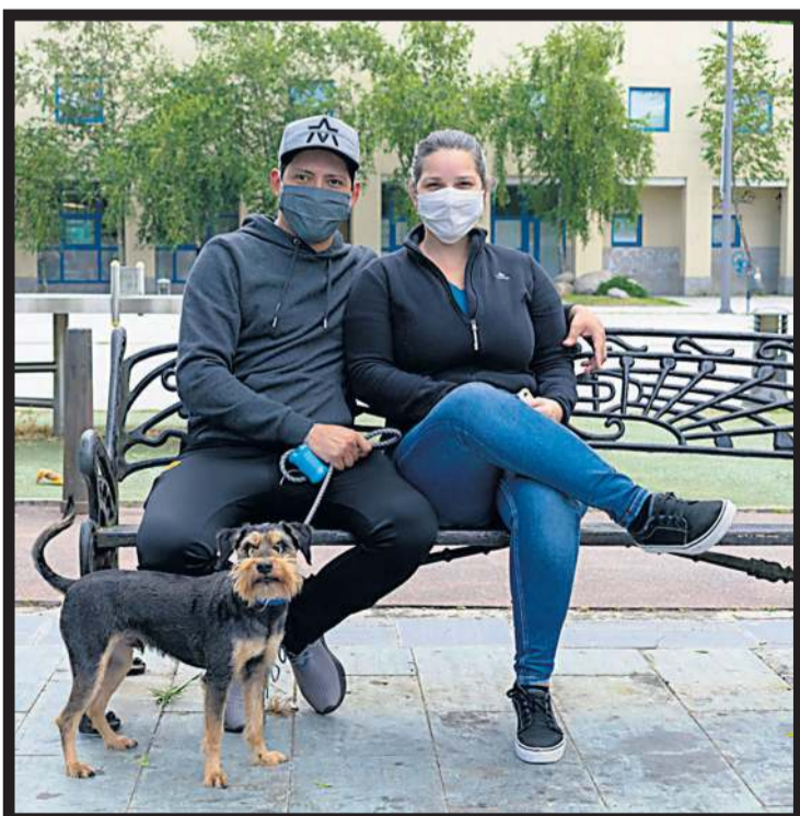
MASCOTAS. Una pareja con su mascota en Vilagarcía