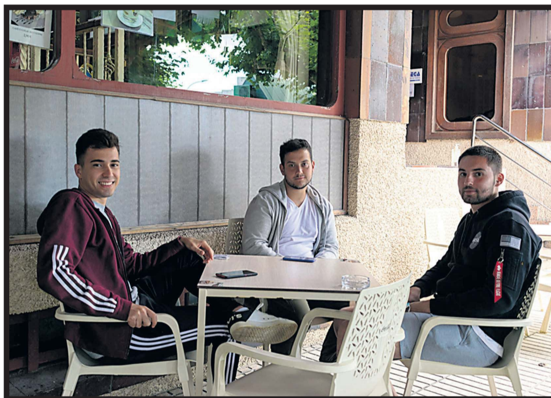
BAR TERTULIA. Tres jóvenes disfrutando al aire libre en la terraza del Bar Tertulia