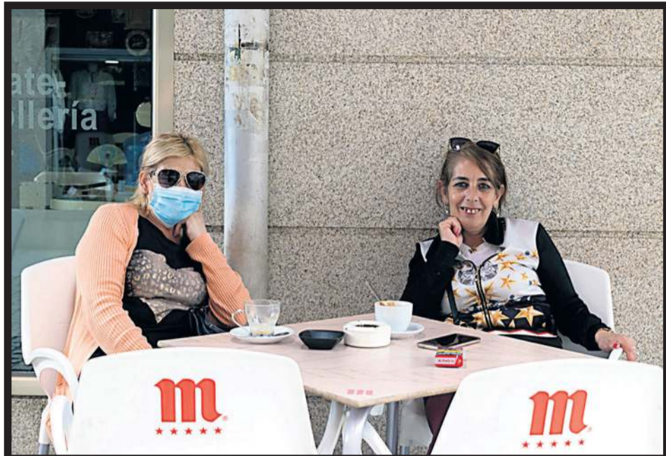
BAR CARAIMA. Dos clientas disfrutando del café en el bar Caraima de Vilagarcía