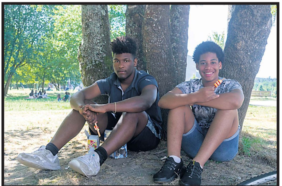
HELADOS. Dos adolescentes disfrutando del buen tiempo en un parque de Bertamiráns