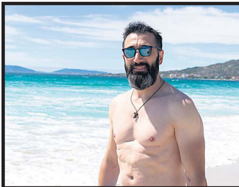
PASEOS. Un bañista dando un paseo por la playa de Carnota