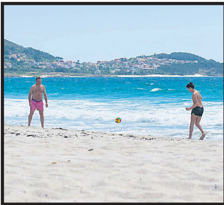
LOS JUEGOS CON EL BALÓN volvieron a las playas