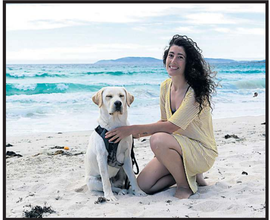
LAS MASCOTAS son admitidas en algunos arenales gallegos