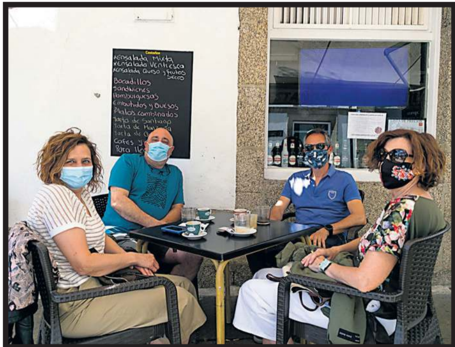
MESÓN CESTAÑOS. Un grupo disfrutando del ambiente de Porta Faxeira