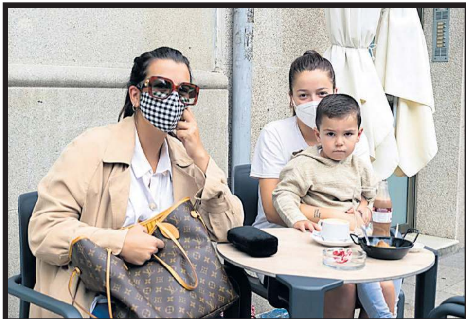
CAFÉ MICKEY. Clientes en la terraza del café Mickey, en Vilagarcía de Arousa