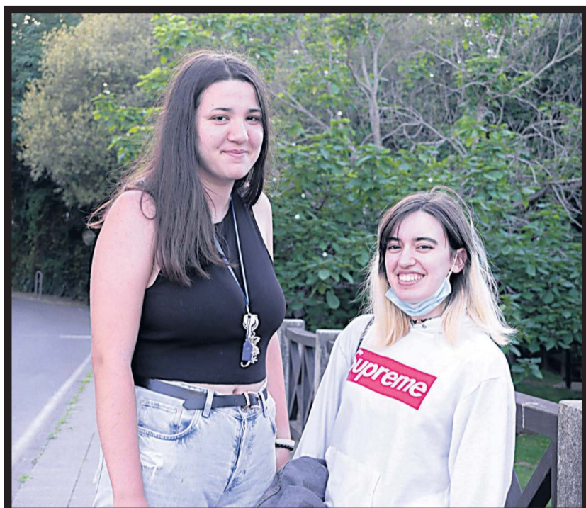
PASEOS por la Travesía de Lodeiros, en Bertamiráns