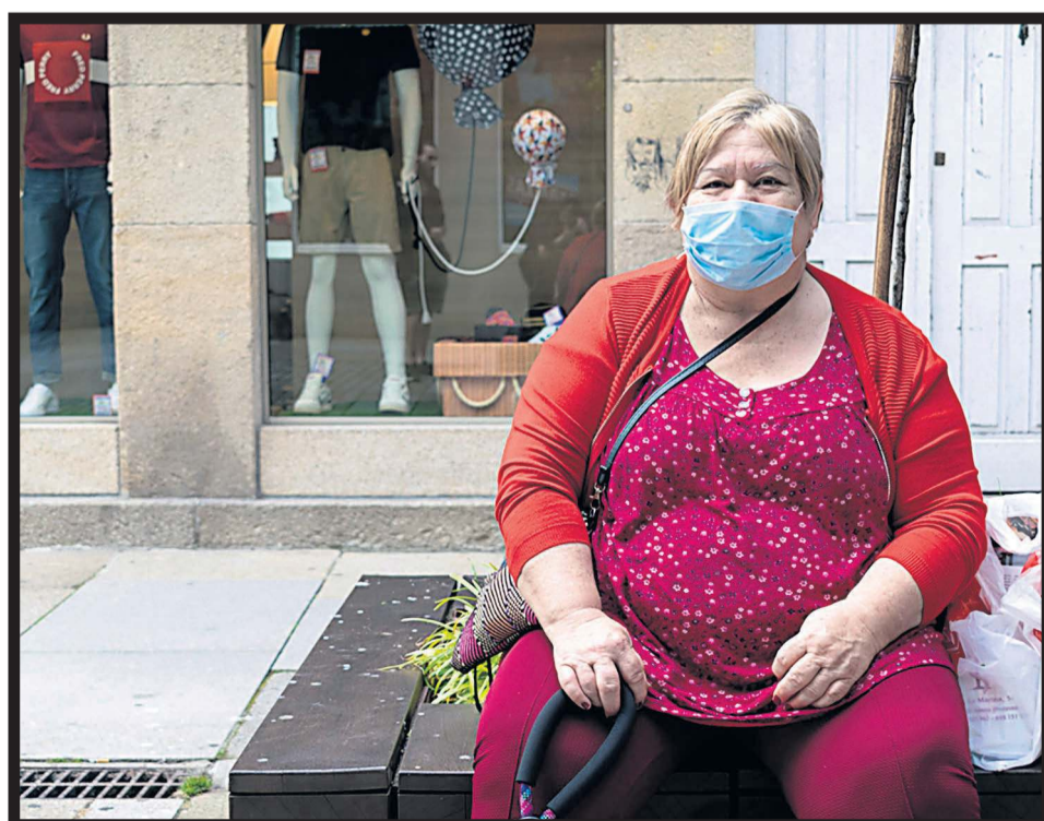
DESCANSO en una de las calles de Vilagarcía de Arousa