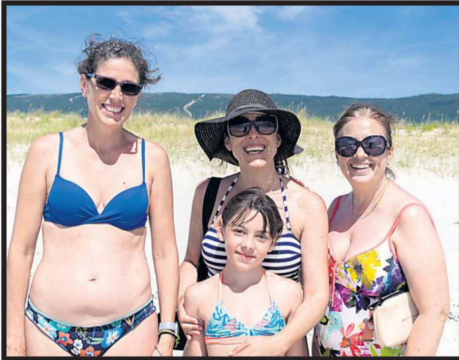
EL BUEN TIEMPO anima a disfrutar de largas jornadas playeras