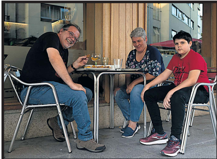
CERVECERÍA NEW YORK. Tomando algo en el local de Bertamiráns