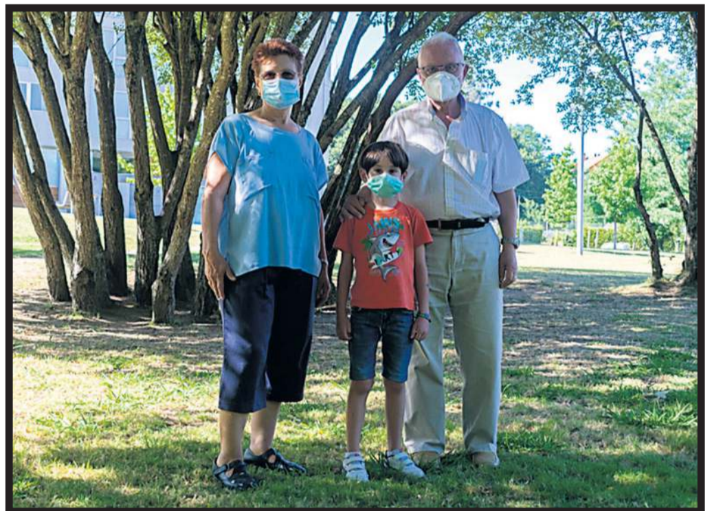
PASEO FAMILIAR en un parque de Bertamiráns, aprovechando las buenas temperaturas