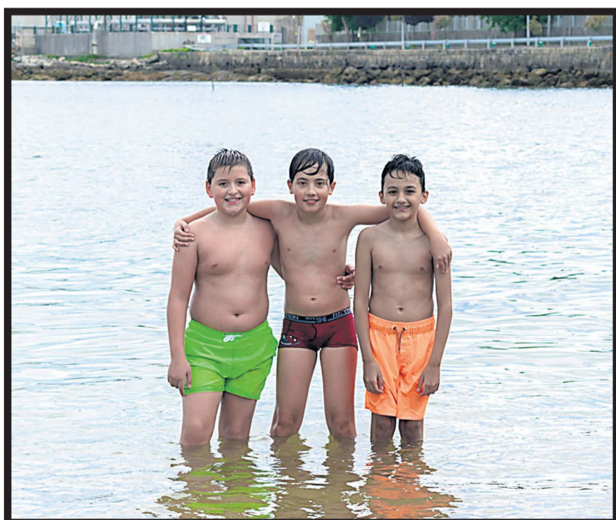
TIEMPO PARA EL BAÑO . Tres amigos en una cala aousana