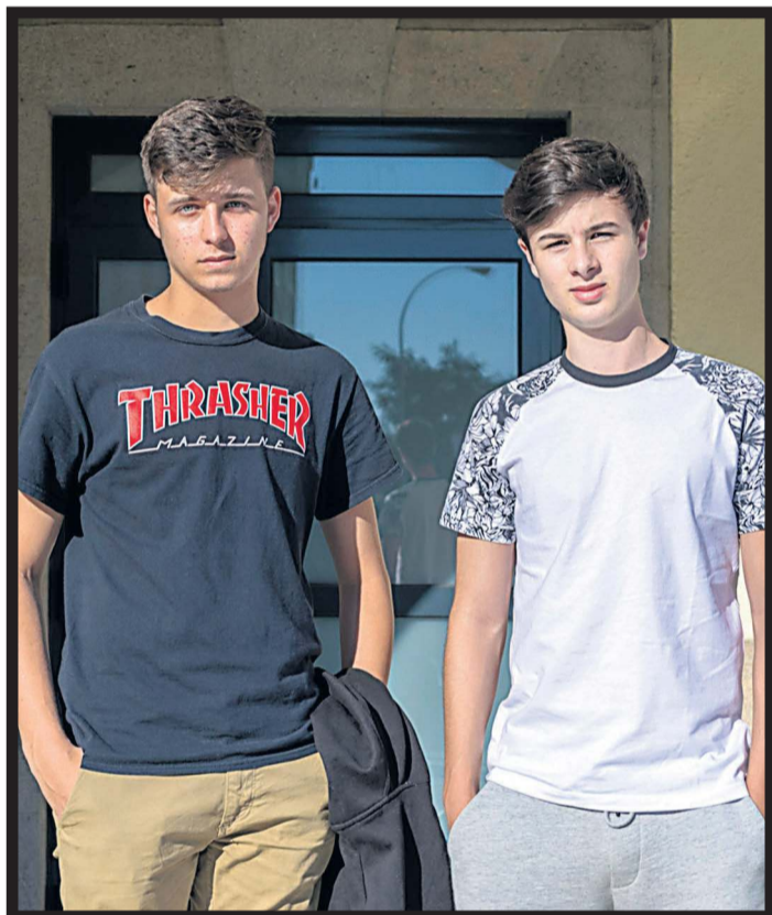
VILAGARCÍA DE AROUSA. En la Estación de Tren