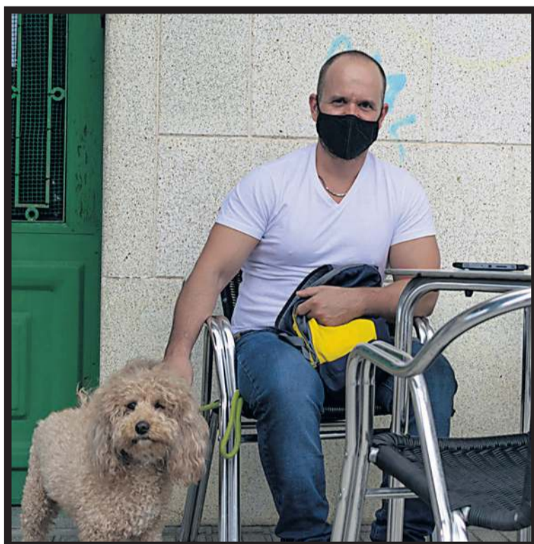
BAR CANTABRIA. Un cliente acompañado de su mascota