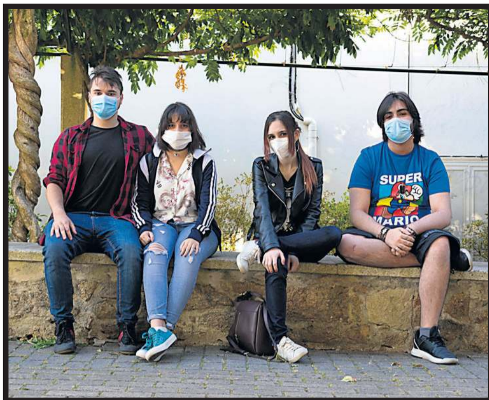
LAS CALLES , como esta de Bertamiráns, vuelven a ser punto de encuentro de los jóvenes