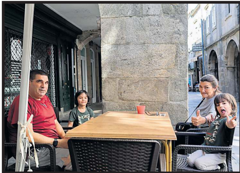
RESTAURANTE L'INCONTRO. Familia en la terraza del local en la rúa do Vilar