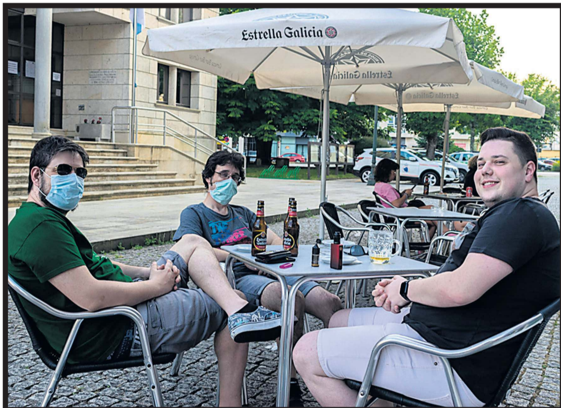
LA BODEGUILLA DE BERTAMIRÁNS. Tres chicos tomando unas cervezas en la terraza del local