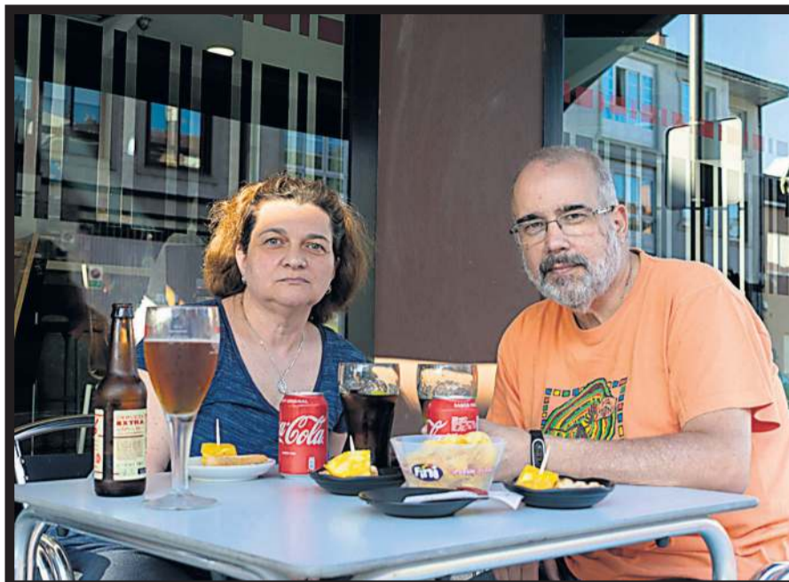
BAR D'LOIS. El picoteo en la terraza del Bar D'Lois en Bertamirás