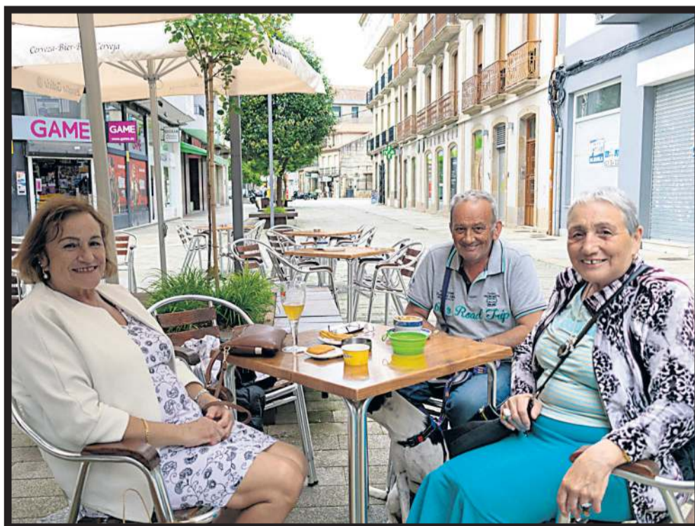
BAR MATY. La terraza del bar Maty reúne a diario a numerosos clientes que disfrutan del aperitivo y del descanso en Vilagarcía