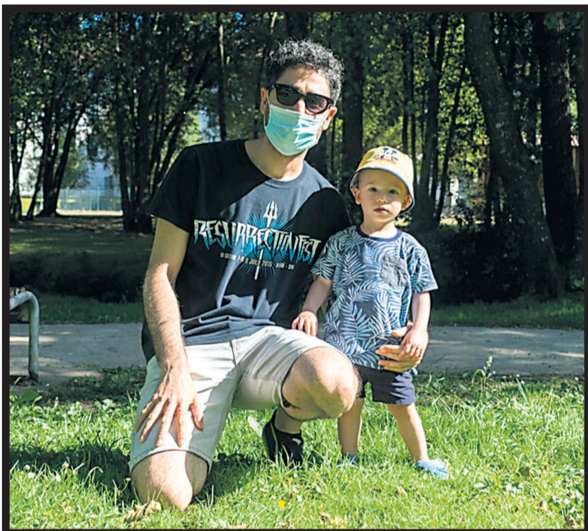
EL BUEN TIEMPO anima a disfrutar de la vida al aire libre