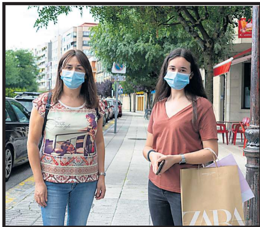
DE COMPRAS por la Avenida da Mariña, de Vilagarcía de Arousa