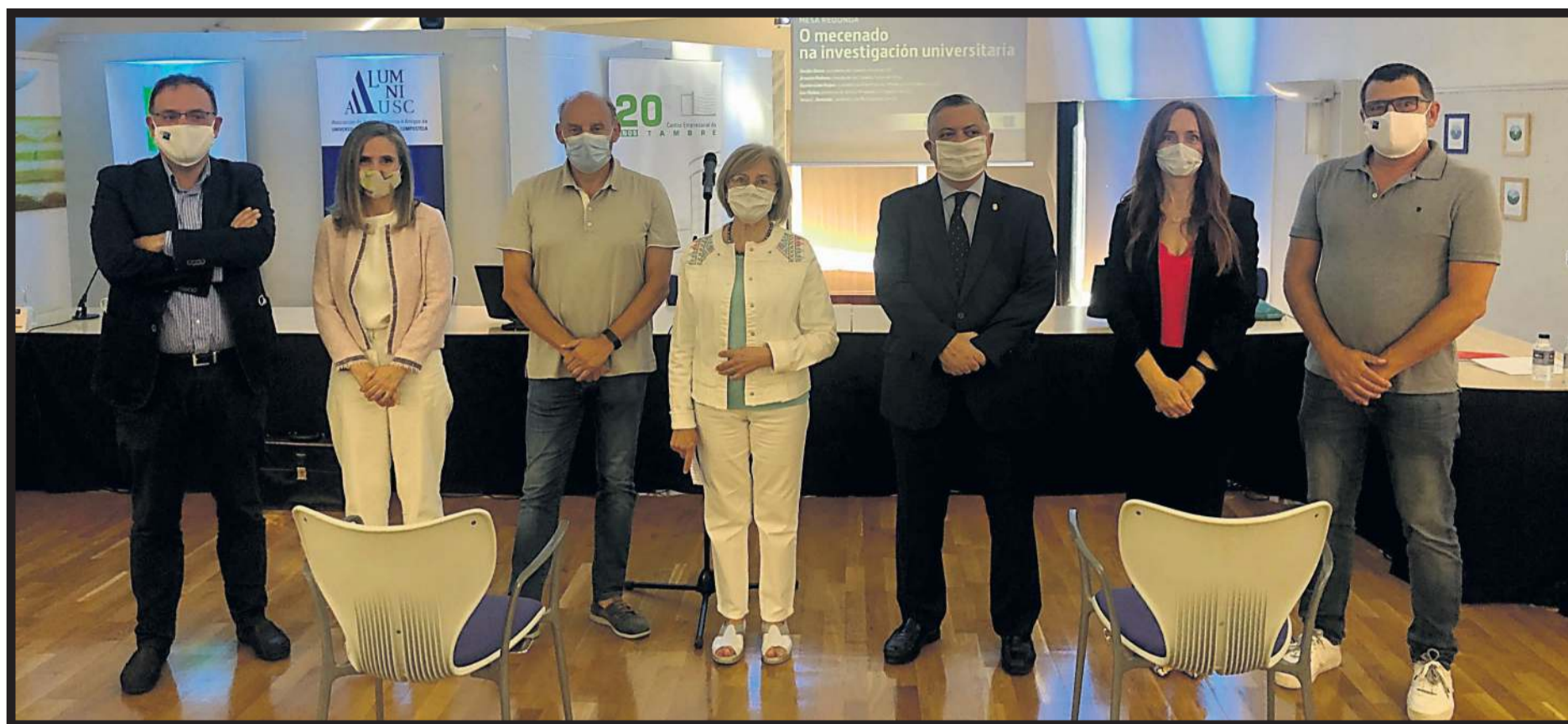
ALUMNI USC Y EMPRESARIOS DEL TAMBRE. Promotores de la celebración de una mesa redonda sobre el mecenazgo en la investigación universitaria