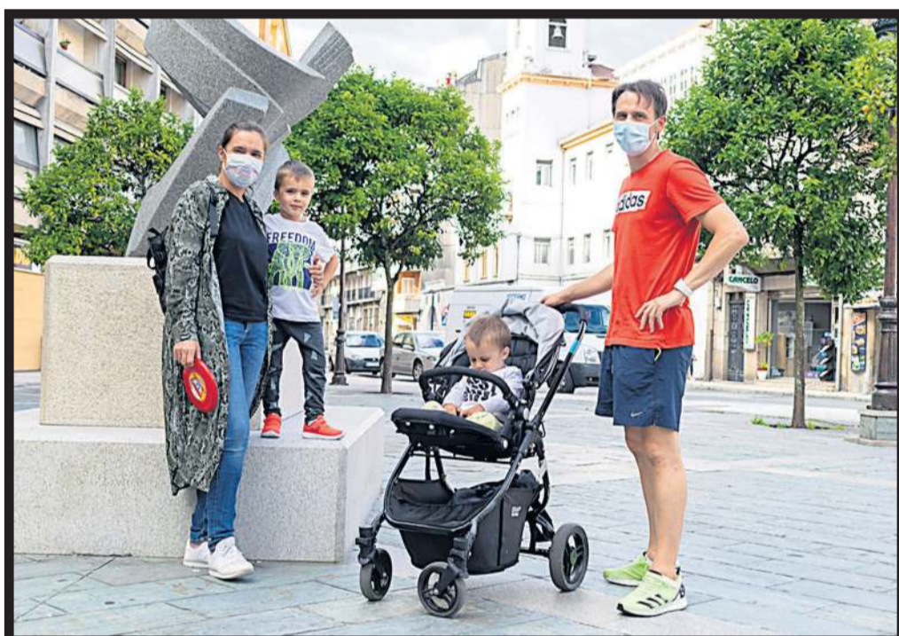
TIEMPO LIBRE EN FAMILIA , en la plaza Colón de Vilagarcía de Arousa