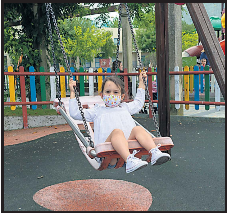
COLUMPIOS. Una niña columpiándose en Vilagarcía