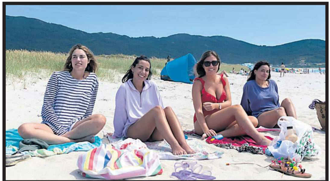
EN PANDILLA. Un grupo de amigas durante una jornada playera en la costa gallega