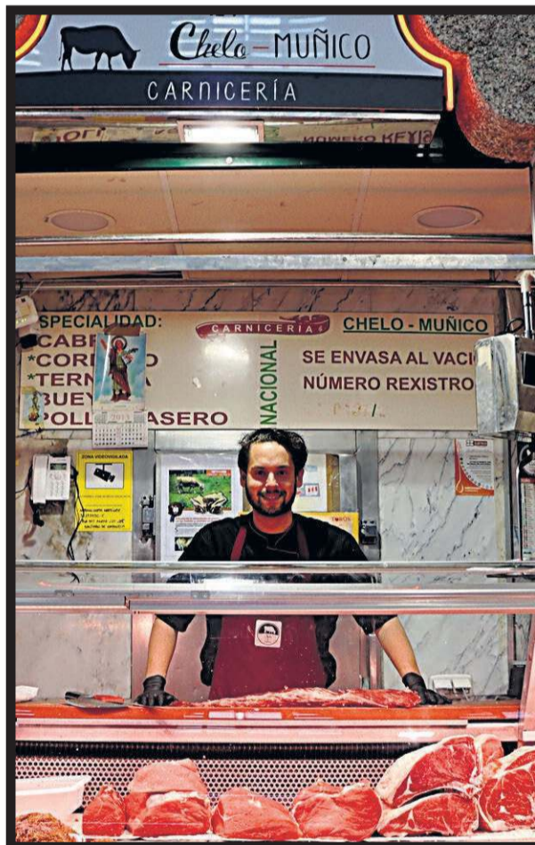
CARNICERÍA CHELO MUÑICO. Plaza de abastos. Nave 2. Casillas 122-125. Santiago