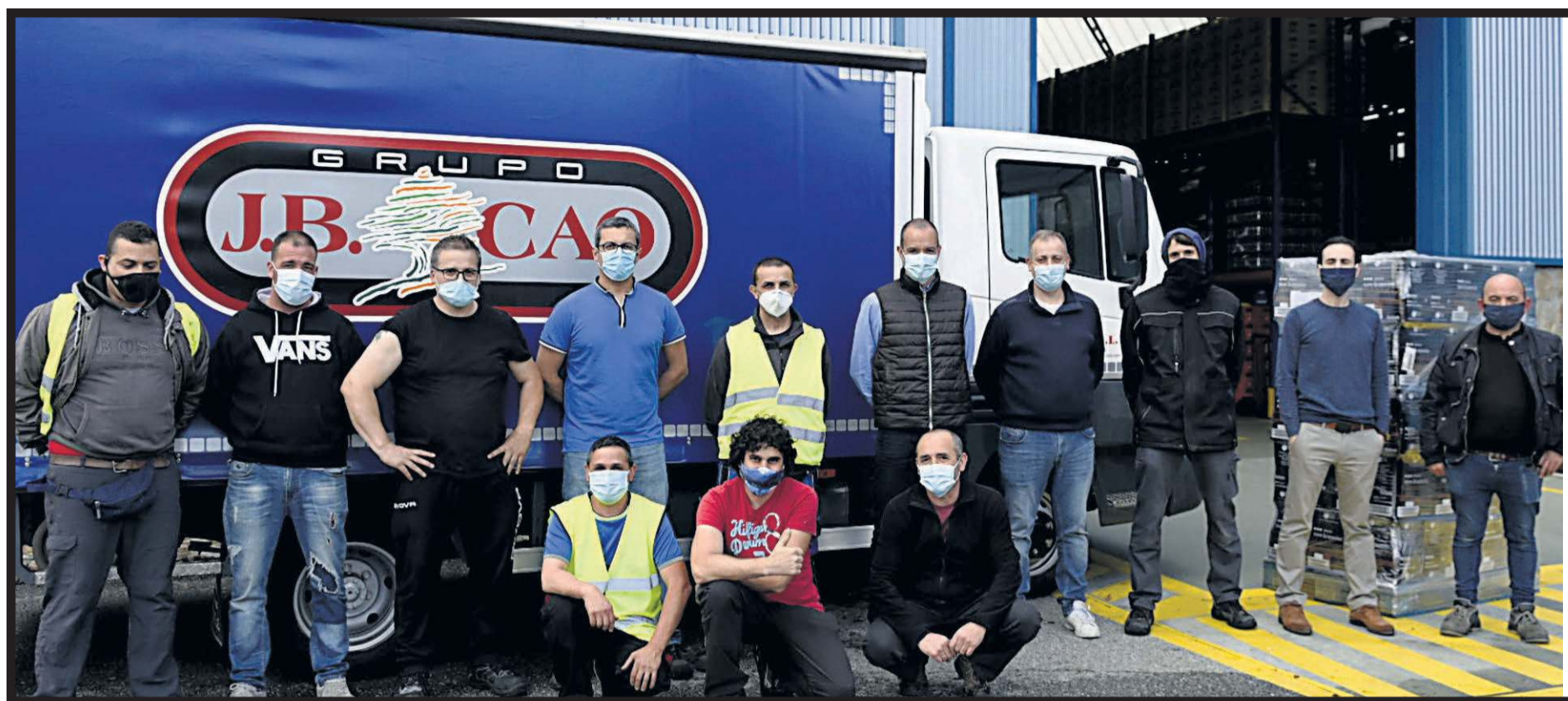
JB CAO. Vía Pasteur, 4. Polígono del Tambre. Santiago