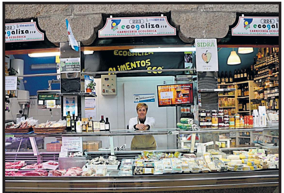
ECOGALIZA. Plaza de abastos. Nave 7. Casillas 222-224. Santiago