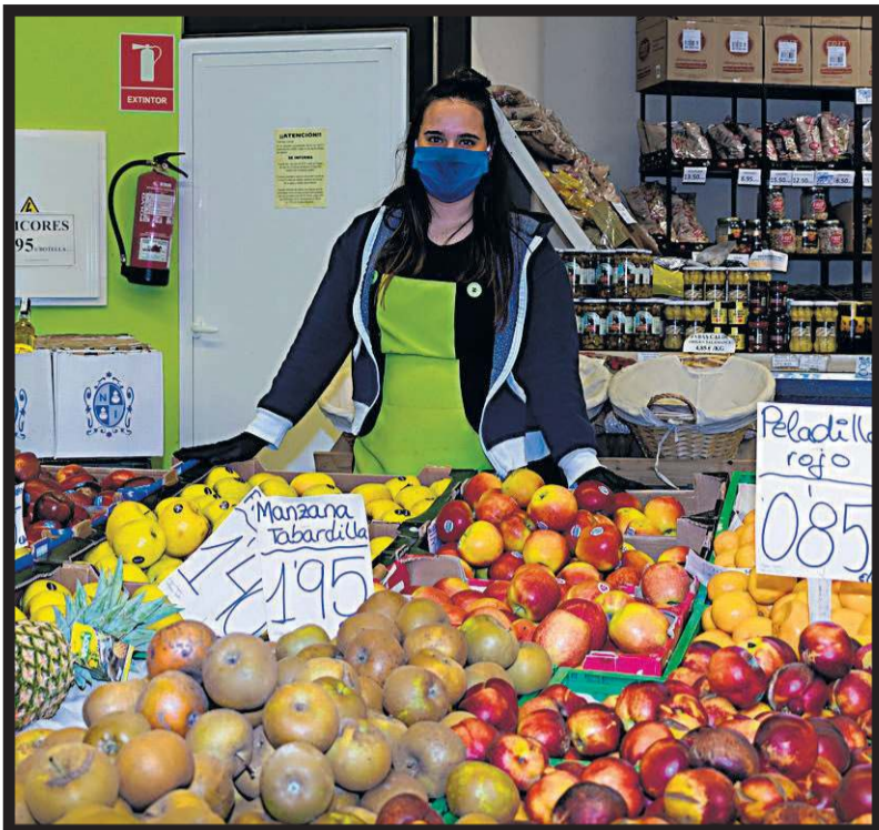
FRUTAS BARREIRO. Vilar de Calo, 9. Teo