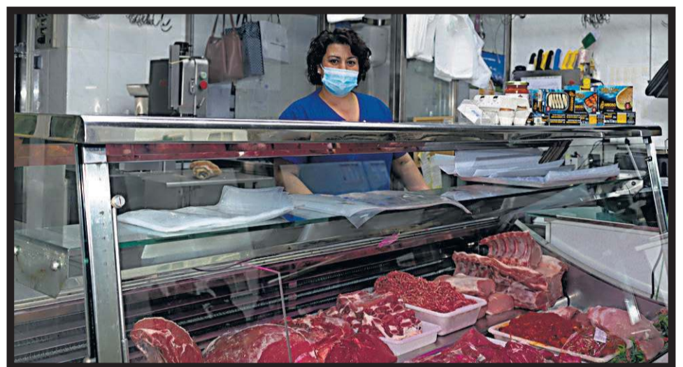
CÁRNICAS BLANCO MOURELLE. Rúa de Santa Comba, 6. Santiago