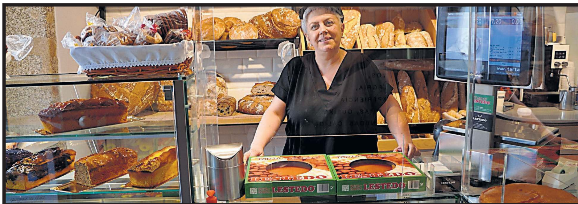
PANADERÍA LESTEDO. Plaza de Mazarelos, 11. Santiago