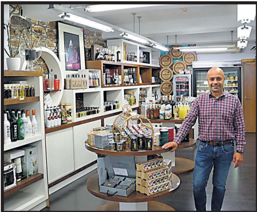
A CESTA TENDA. Rúa do Franco, 52. Santiago