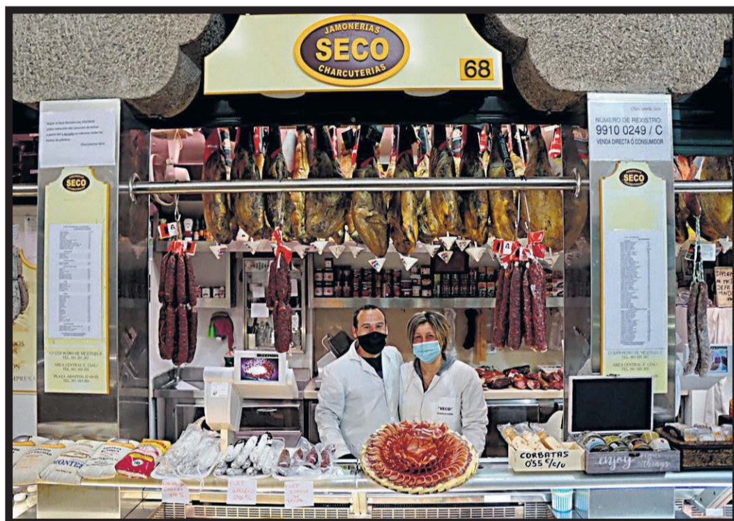
CHARCUTERÍA SECO. Plaza de abastos. Nave 1. Casillas 65-69. Santiago