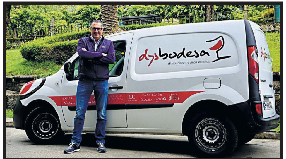
DYSBODESA. Rúa Volta do Castro, 5. Santiago