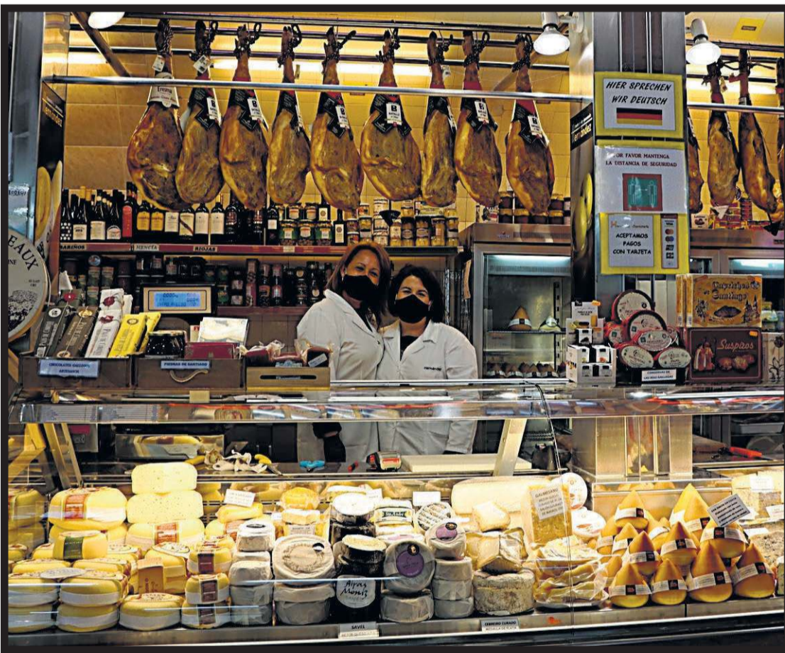
CHACINERÍA HERNÁNDEZ. Plaza de abastos. Nave 2. Casillas 126-129. Santiago