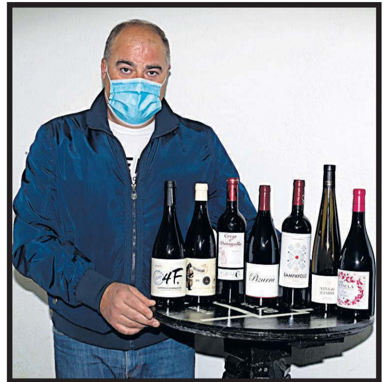
ENOGALIA. Vilar de Calo. Teo