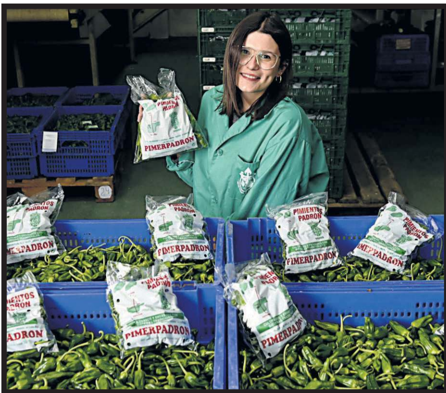
VDA. DE PARADA Y J. ALVELA. Lugar de la Iglesia, 4. Merín (Vedra)