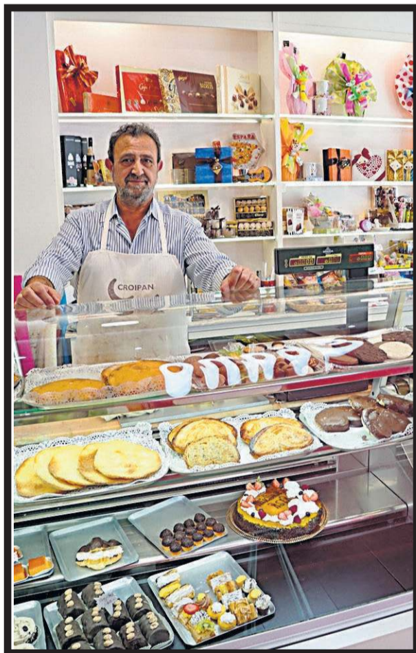
PANADERÍA PASTELERÍA ÉBANO. Avenida de Romero Donallo, 27. Santiago