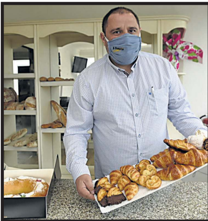
PANADERÍA A FOGAZA. Lagartóns,, 70. A Estrada