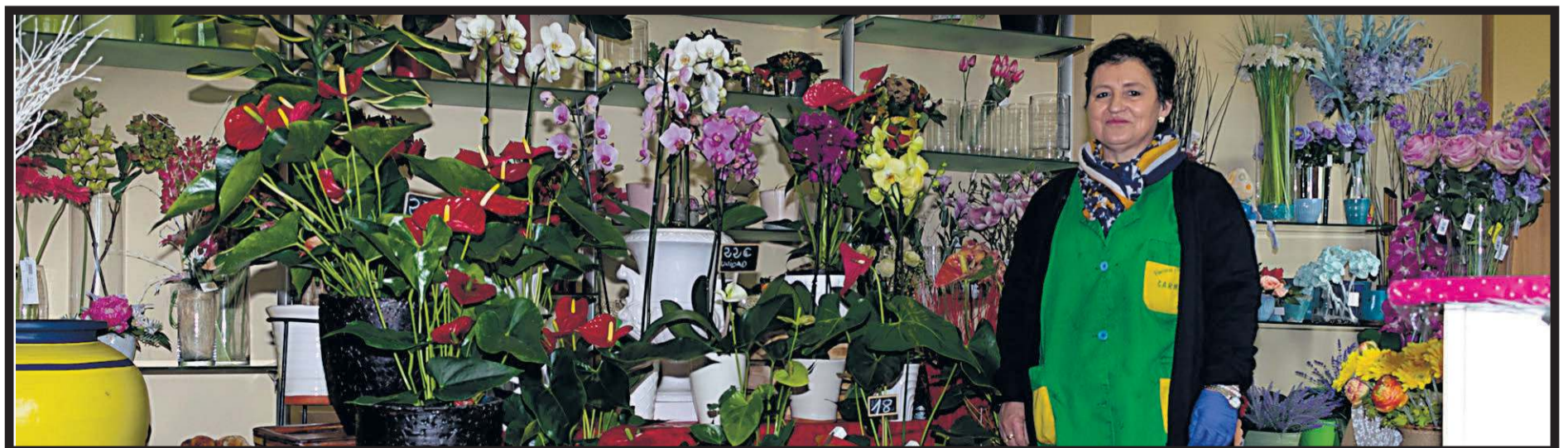
FLORISTAS Y PRODUCTORES CARMiÑA. Boisaca s/n. Santiago