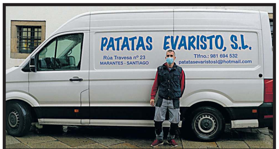
PATATAS EVARISTO. Rúa Travesa 23. Marantes (Santiago)