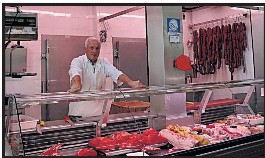
CARNICERÍA CARLOS. Plaza de abastos. Nave 1. Casillas 74-77. Santiago