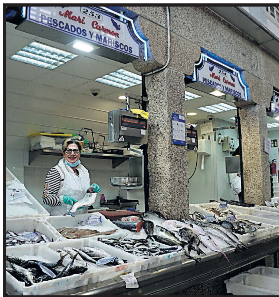
PESCADOS MARI CARMEN. Plaza de abastos. Nave 4. Casillas 253-256 y 272-274

saben que harán las delicias de cualquier paladar. Pero además cuentan con empresas de reconocido prestigio que le sirven tanto el pan como la repostería, las carnes y los pescados, las frutas y las verduras, los vinos y las cervezas, cualquier otro tipo de bebida y hasta embutidos, quesos o fiambres. Y es que en la capital gallega se abre un amplio abanico de posibilidades con una despensa que es la envidia de los grandes chefs cuando visitan la ciudad. Una vez puesta en marcha la hostelería con todas las garantías sanitarias, llega el turno de los proveedores para ocupar los huecos que quedan en neveras y estantes tras el consumo de los clientes. Ellos también son parte de la grandeza del sector.