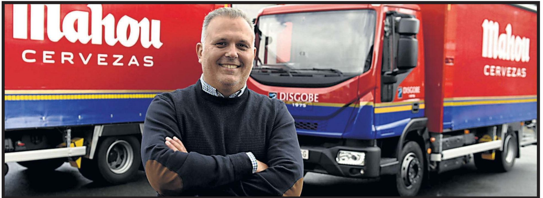
CERVEZAS MAHOU. Vial de Pasteur, 1. Polígono del Tambre. Santiago