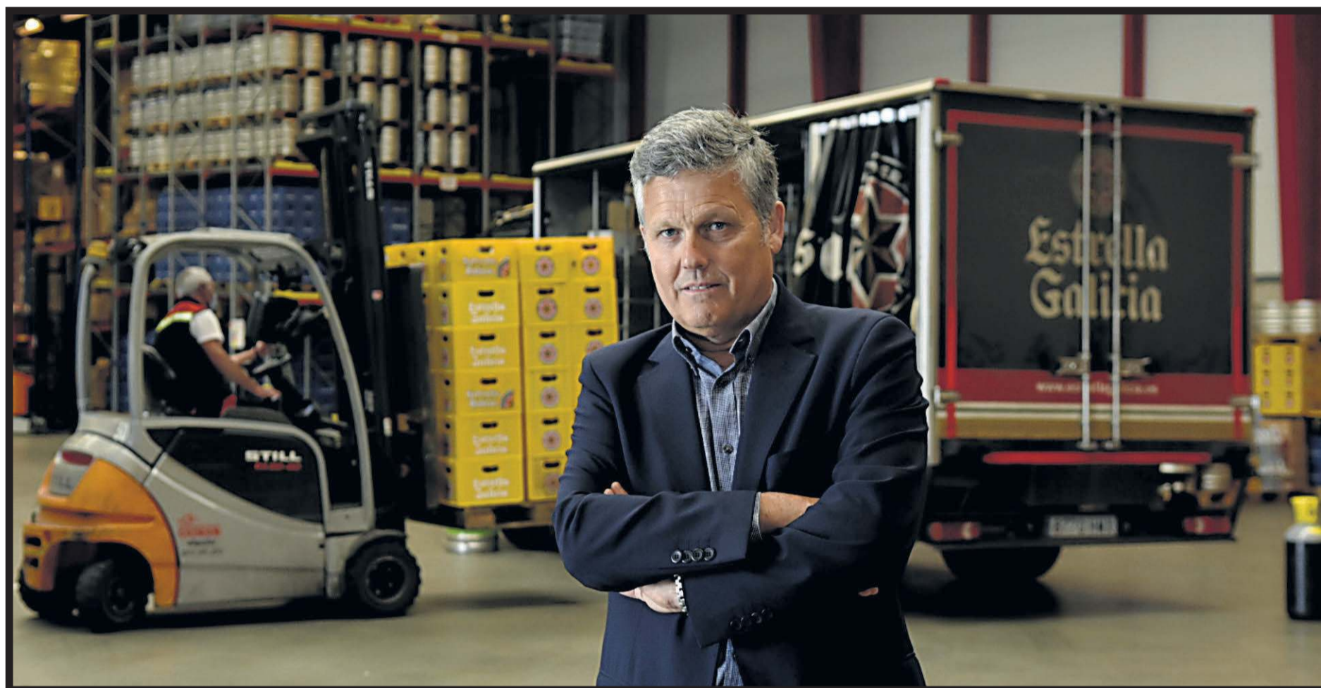
ESTRELLA GALICIA. Calle Lituania, 14. Parque empresarial de Costa Vella. Santiago