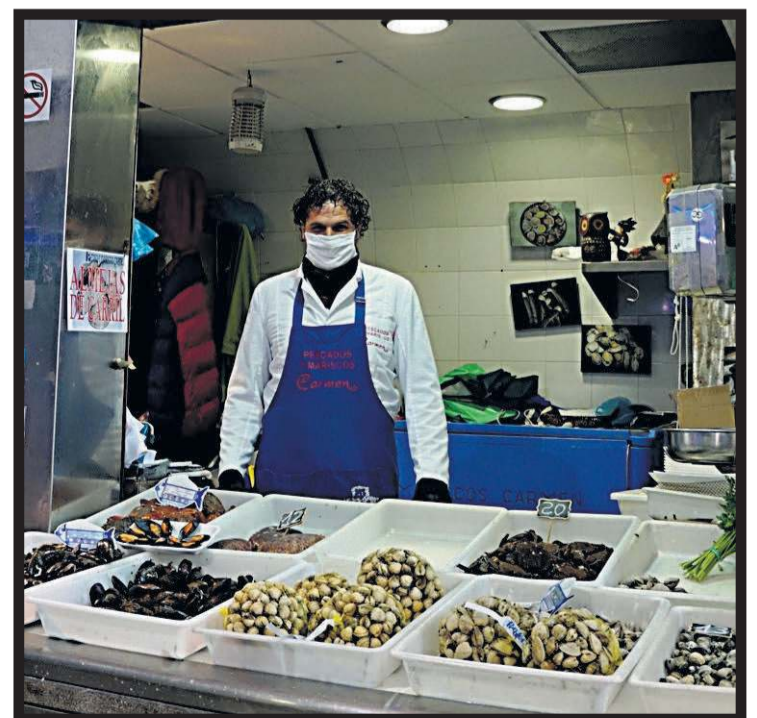
MARISCOS CARMEN. Plaza de abastos. Nave 3. Casillas 206-207