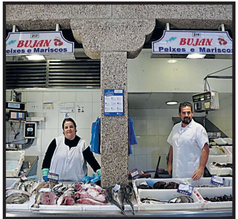
PEIXES BUJÁN. Plaza de abastos. Nave 3. Casillas 216-217. Santiago