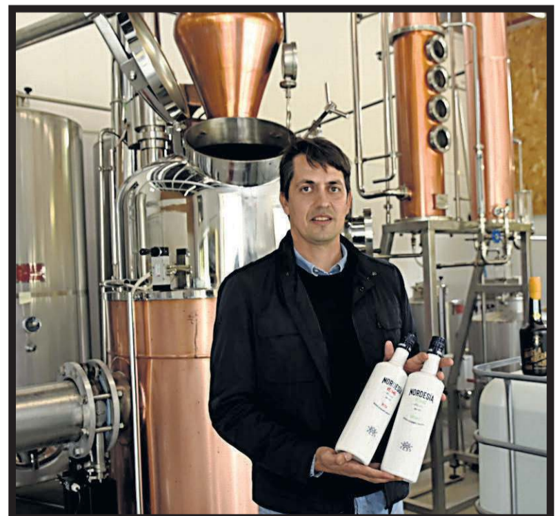
GALICIAN ORIGINAL DRINKS. San Miguel de Sarandón. Vedra