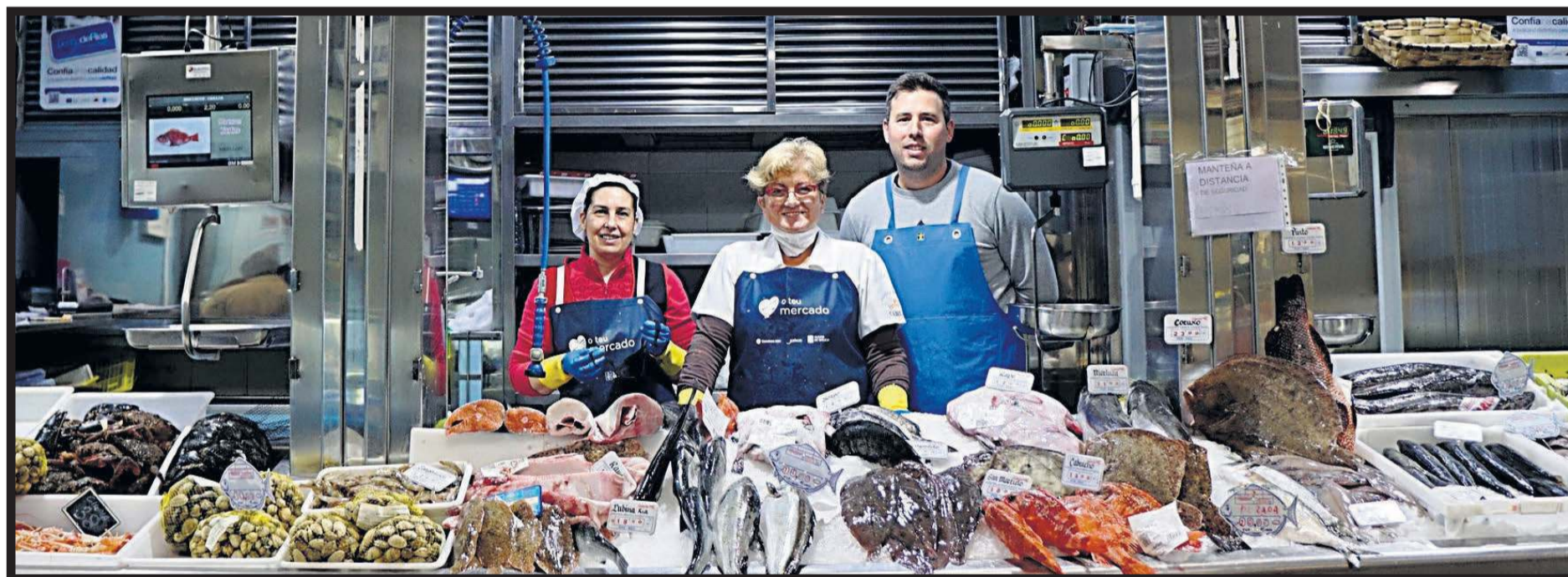
PESCADOS Y MARISCOS CARLOS. Plaza de abastos. Nave 4. Casillas 257-259. Santiago