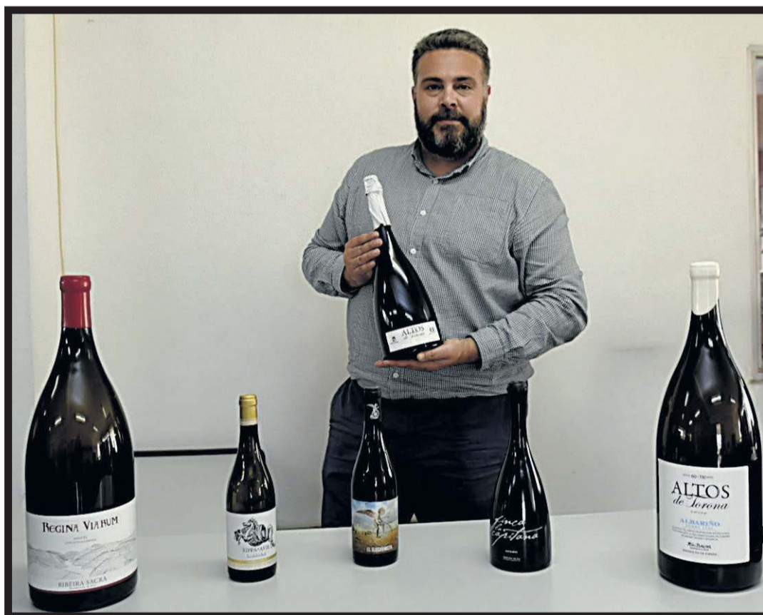
DISGOBE. Vial de Pasteur, 1. Polígono del Tambre. Santiago