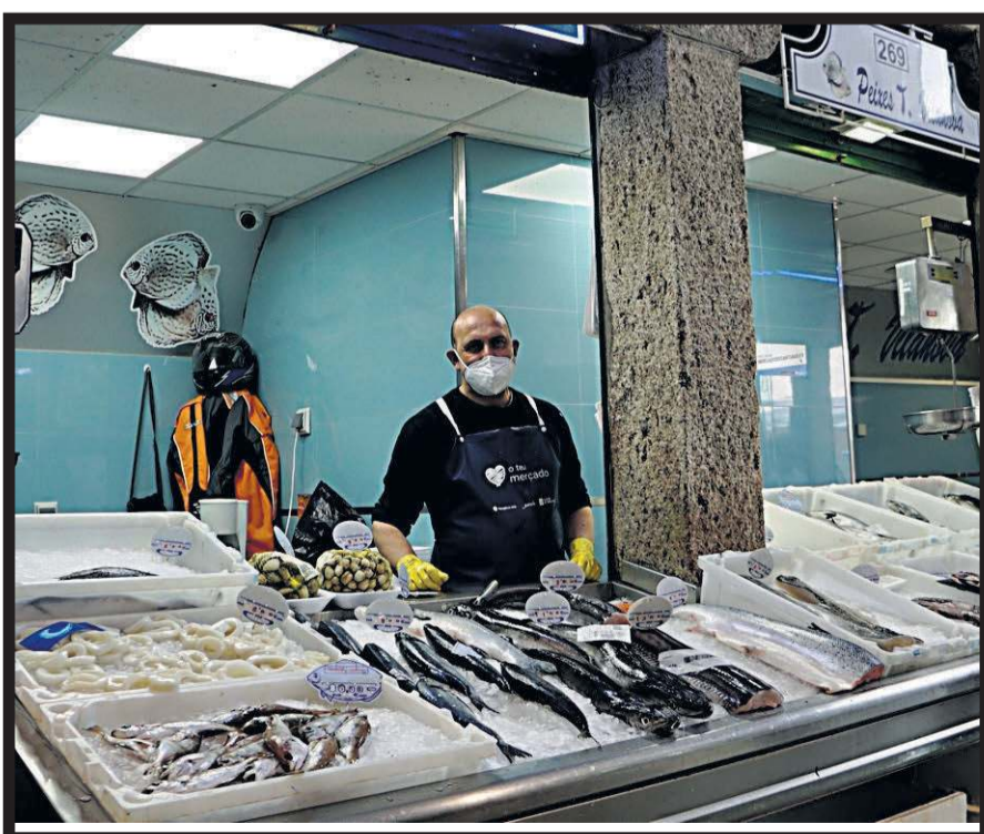
PEIXES T. VILANOVA. Plaza de abastos. Nave 4. Casillas 268-271. Santiago