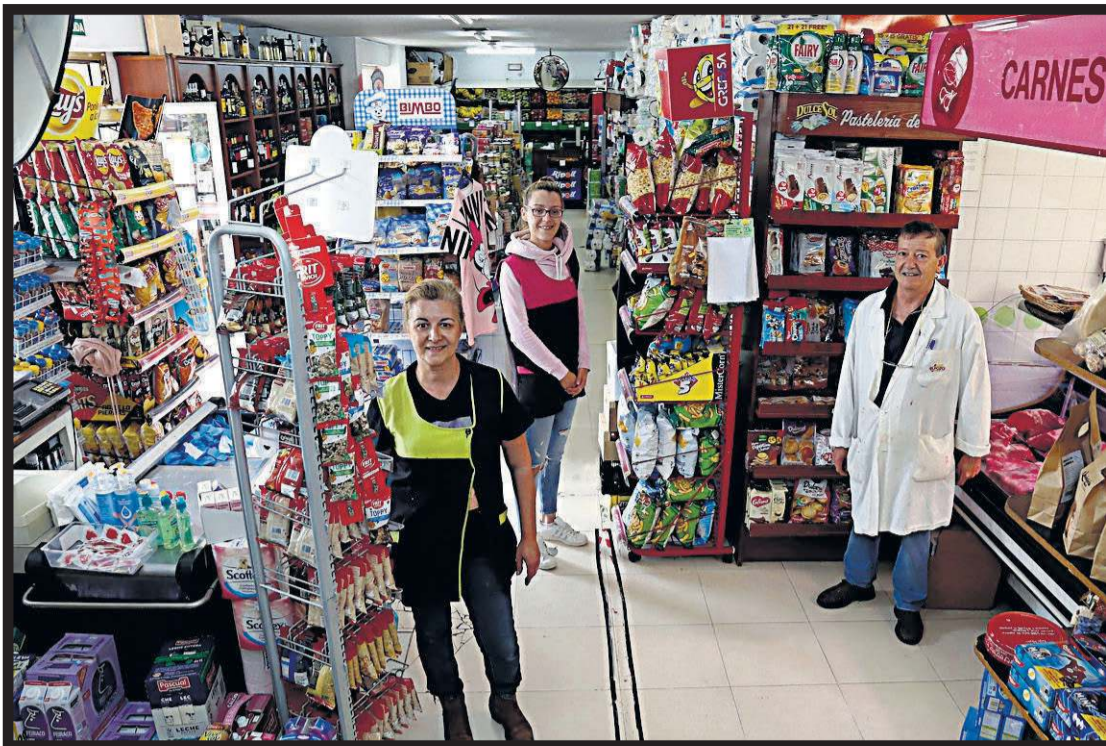
SUPERMERCADO TAYGON. Avenida de Castelao, 24. Santiago