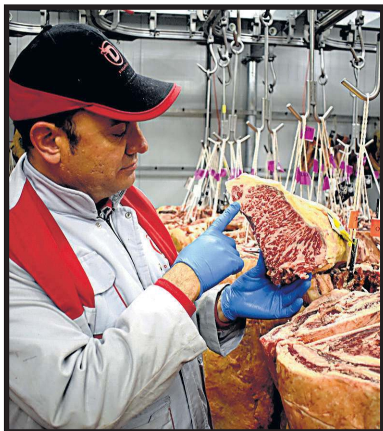
DISCARLUX. Calle Provisional. Polígono Vallecas Dos. Nave 7. Madrid