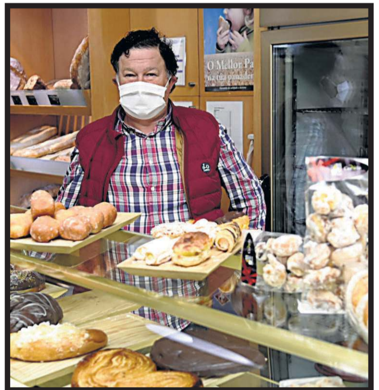
PAN CERVELA. Avenida de Pontevedra, 101. A Estrada