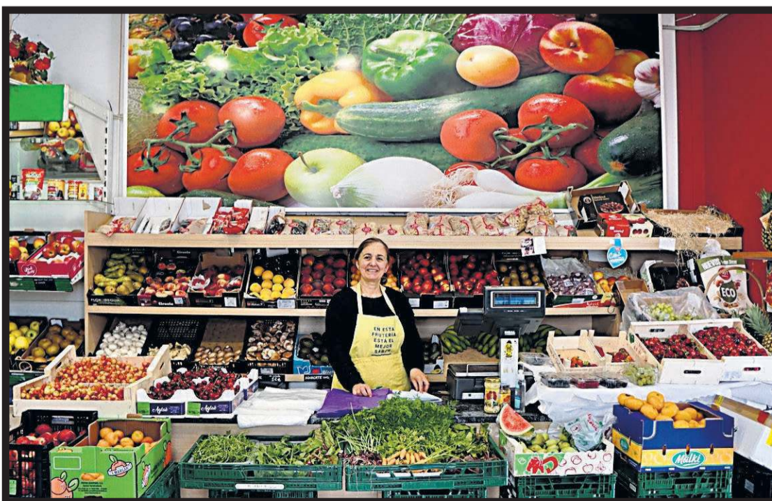
FRUTAS NANO. Rúa das Ameas, 5. A Estrada