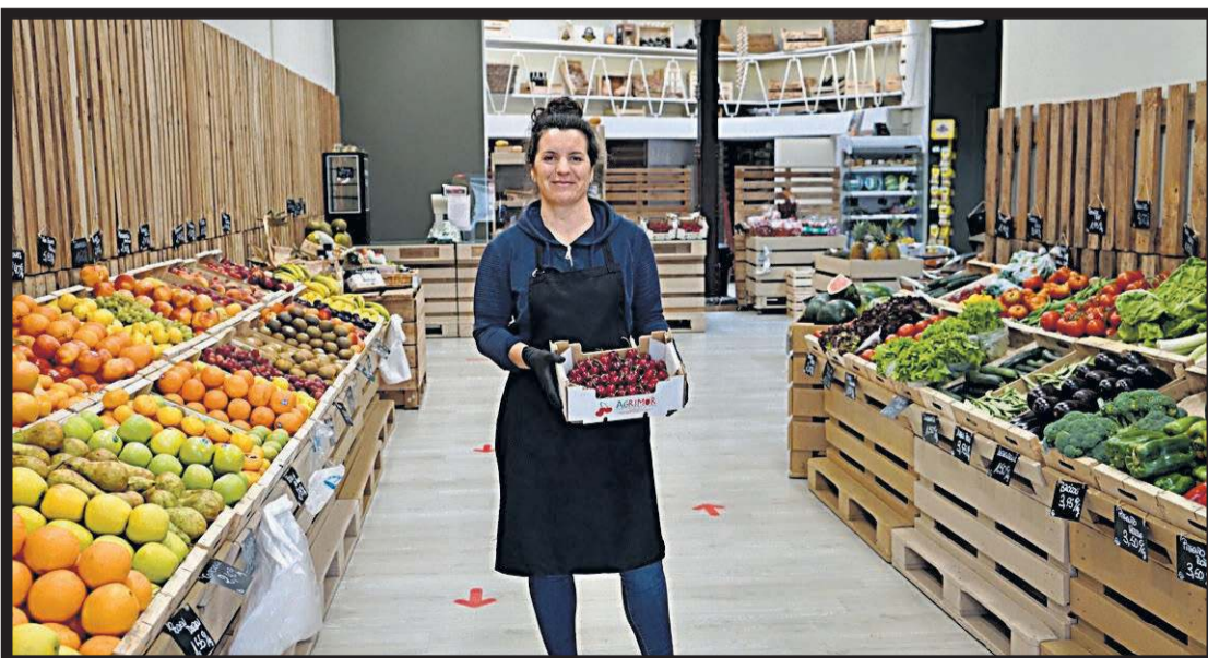
HORTOFRUTÍCOLA DEL NOROESTE. Mercalicia. Puestos 33-37. Vía de la Cierva. Santiago