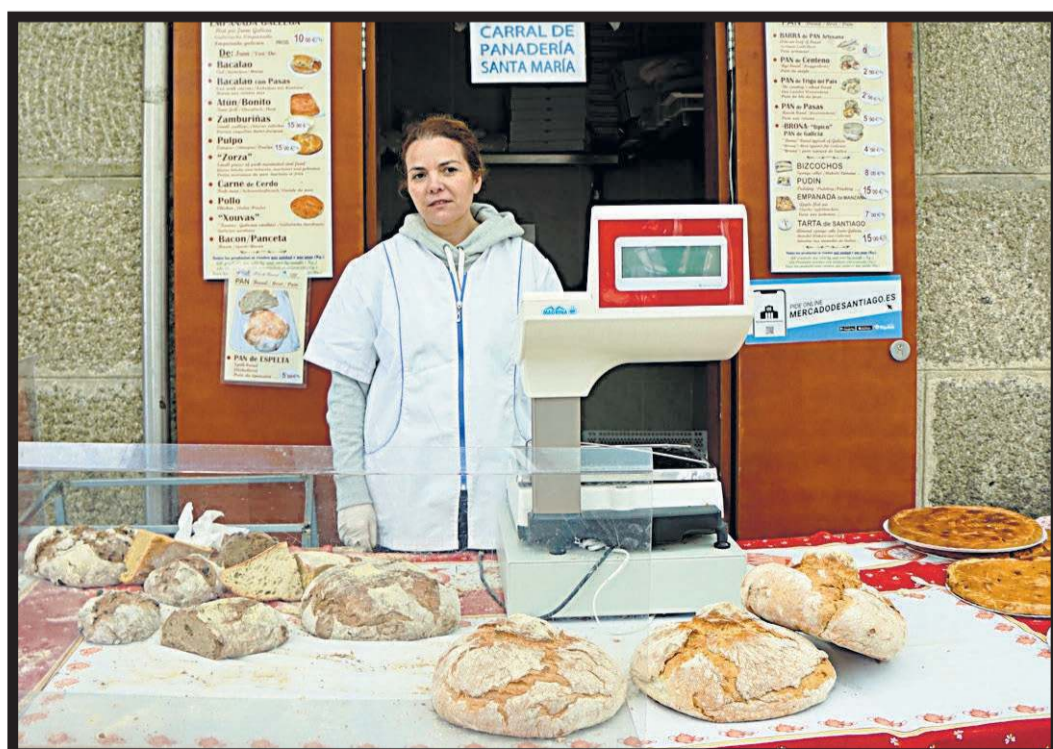
PAN DE CARRAL. Plaza de abastos. Puesto 339. Santiago