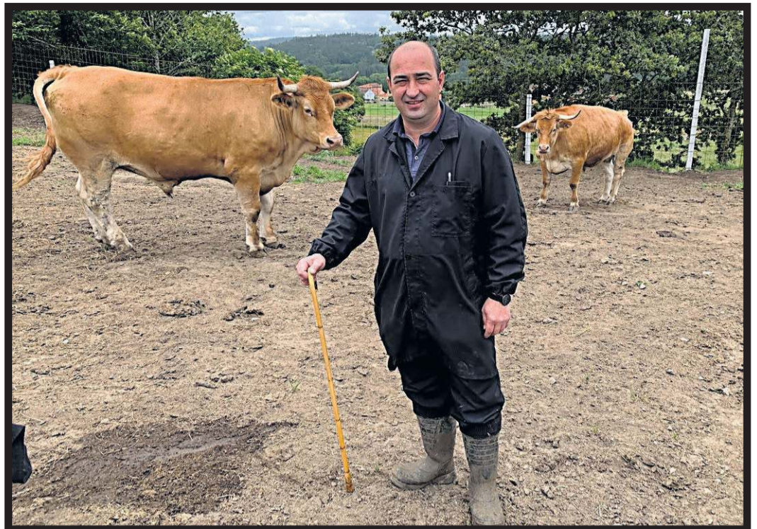
GANADOS CAQUELO. Lapido, 12. Bertamiráns (Ames)