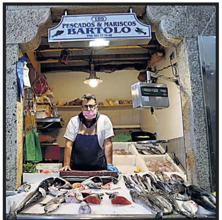
BARTOLO. Plaza de abastos. Nave 3. Casillas 188-189. Santiago