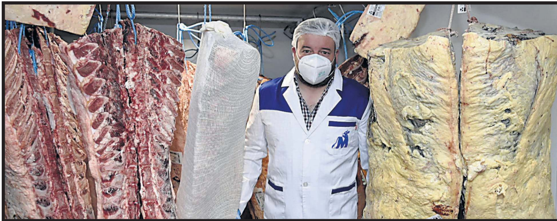
VACA PREMIUM. Lugar Tallo, 2. Toedo (A Estrada)