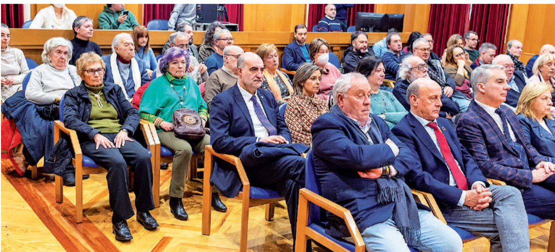
Público asistente al acto de entrega de la distinción celebrado en el salón de plenos de la institución provincial