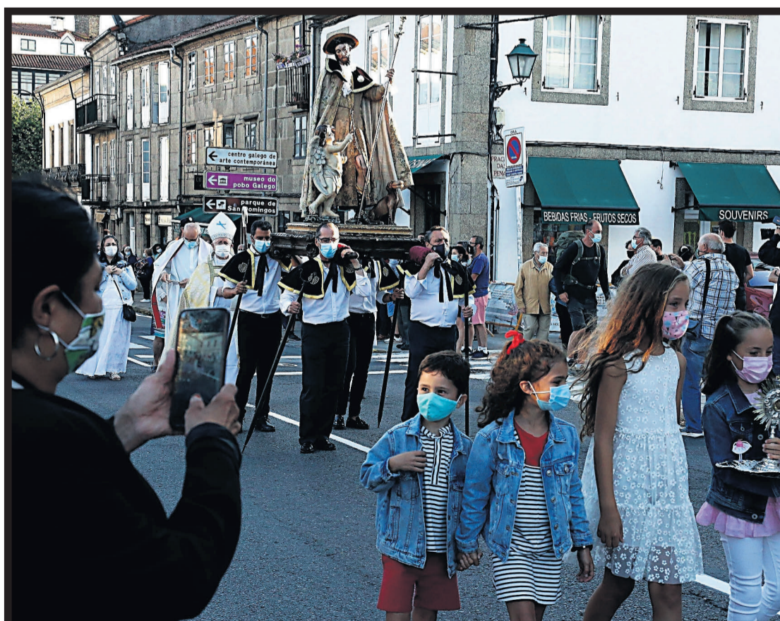
La imagen de San Roque salió en procesión acompañada de los fieles por los alrededores de la capilla compostelana