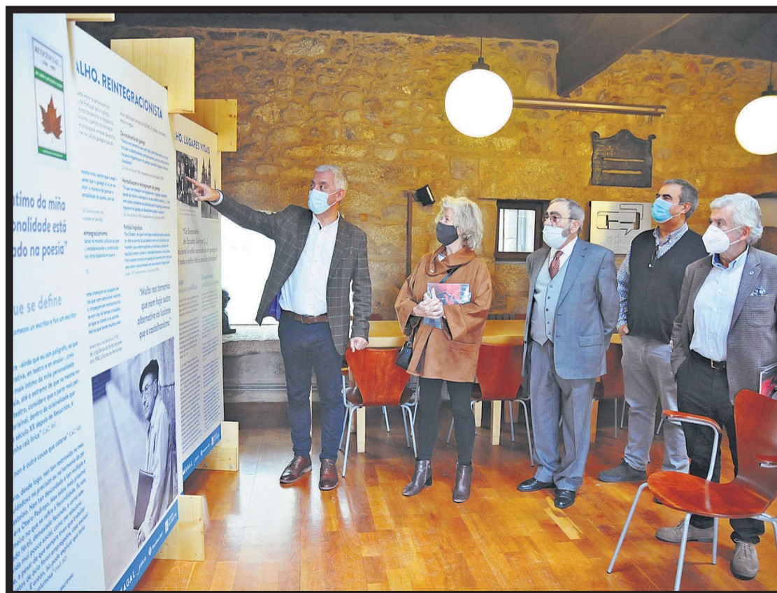
El secretario xeral de Política Lingüística señala uno de los paneles expositivos en el pazo de Trasalba

yo, respectivamente. La muestra despidió después el pazo de Trasalba para comenzar ya la recta final de su itinerancia en la provincia de Ourense, con paradas en la Biblioteca Pública Municipal de Ribadavia y en la Biblioteca Pública de Ourense Xeración Nós, donde dará por concluido su paso por diez localidades gallegas. Este proyecto expositivo alrededor de la figura de Ricardo Carvalho Calero se configura en torno a una docena de paneles, un audiovisual y un díptico explicativo en los que se presentan una línea del tiempo con datos relativos al recorrido vital del autor, los espacios donde este se desarrolló, las circunstancias políticas que lo rodearon, su labor como filólogo y lingüista y su obra.