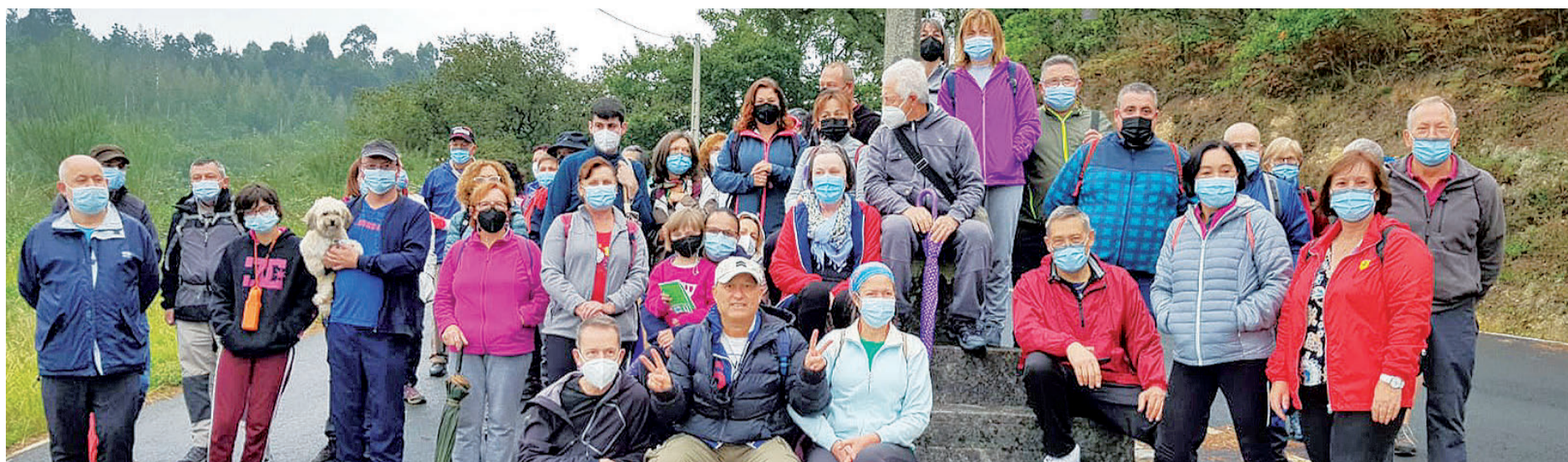
SENDERISMO PARA DISFRUTAR DE LA NATURALEZA DE TOURO. Alrededor de cincuenta senderistas de Touro y de otras zonas de Galicia disfrutaron de la Ruta da Ribeira da Ulla, organizada por el Concello de Touro. Fueron más de 15 kilómetros recorriendo la naturaleza del municipio y conociendo el entorno del Ulla, uno de los ríos más emblemáticos de Galicia. Visitaron parajes como la cascada del Inferniño o Pozo do Pego. El Concello de Touro ya está trabajando en la organización de la próxima ruta de senderismo.