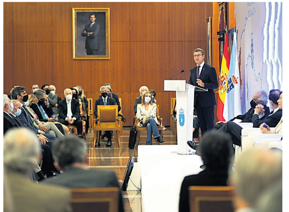
El presidente de la Xunta se dirige a los asistentes al acto celebrado en el Parlamento para conmemorar que hace 40 años se celebraron las primeras elecciones autonómicas gallegas