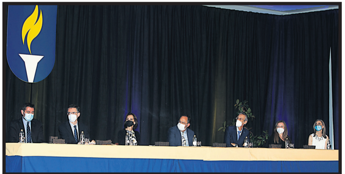
Mesa presidencial cuyos miembros se encargaron de entregar las insignias de plata del colegio a los 125 estudiantes