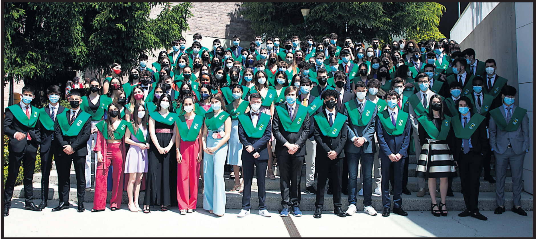
Alumnos de 2.º de Bachillerato de la promoción 2020-2021 que celebraron el acto académico de su graduación en las instalaciones del compostelano colegio Manuel Peleteiro