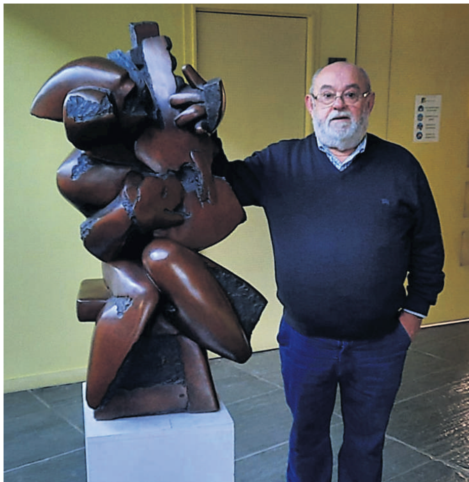
ÉXITO DE LA EXPOSICIÓN DE CAMILO OTERO. Exitoso cierre de la exposición Obras de Camilo Otero en el Centro Empresarial do Tambre de Santiago, donde hasta este viernes se pudo admirar una selección de diez esculturas y veinte cuadros del polifacético artista. La pieza que despertó mayor interés y atrajo todas las miradas fue la titulada Paco de Lucía , que se encargaba de recibir a los visitantes a la muestra.