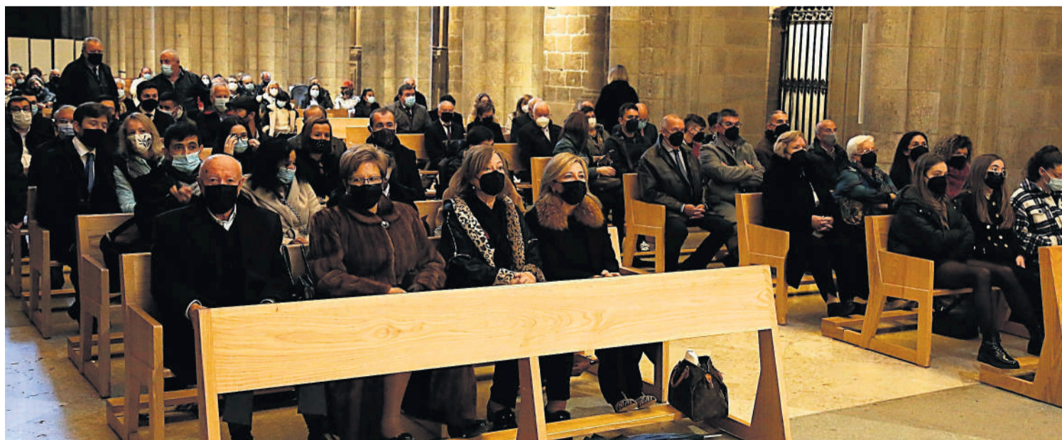
Familiares de los recién nombrados canónigos y fieles durante la ceremonia religiosa celebrada en la basílica jacobea.

jubilar por antonomasia lo que equivale a decir que en ella ha de resonar la llamada a la conversión que lleva al reencuentro con el Señor”.