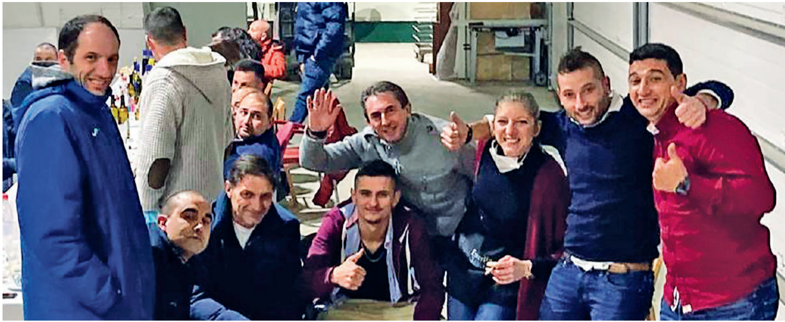
REUNIÓN NAVIDEÑA DE LA EMPRESA RODRIDECO. La empresa de decoración Rodrideco no quiso dejar pasar la oportunidad de reunirse con motivo de las fechas navideñas aunque varió sus costumbres y en vez de hacerlo en un restaurante organizó una comida en la propia nave de la empresa en Sigüeiro con un pulpeiro. Además, para garantizar la seguridad de la plantilla todos los asistentes se sometieron a una prueba PCR con el fin de evitar contagios.