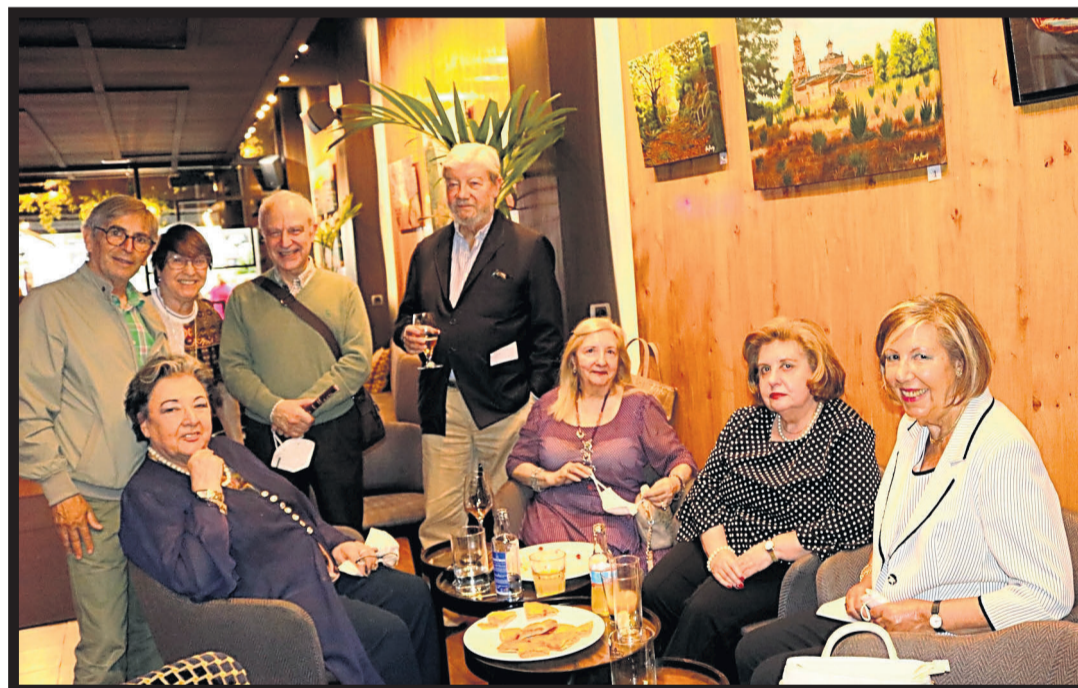
ASISTENTES. Algunos de los invitados a la inauguración de la muestra pictórica en A Coruña