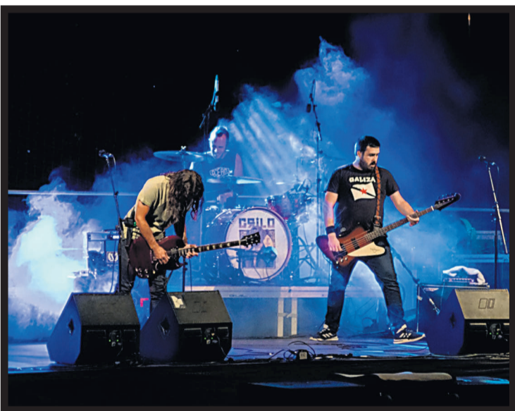
GRILO. La banda actuando en el parque do Coto nicraniense