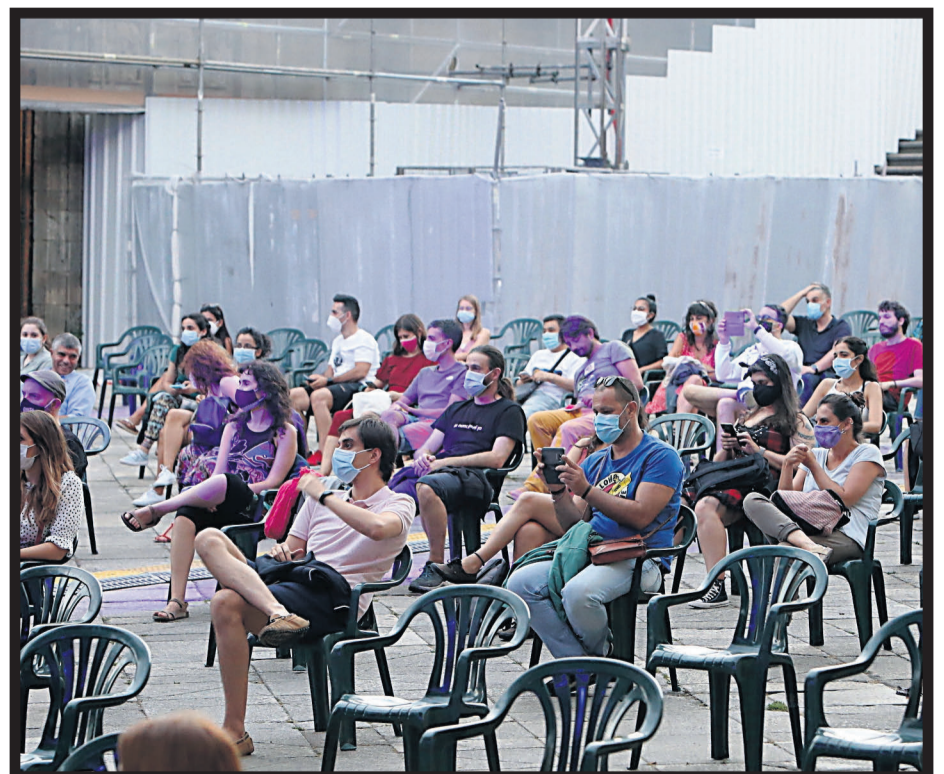
A QUINTANA. Tras el pregón se celebró una actuación musical en A Quintana