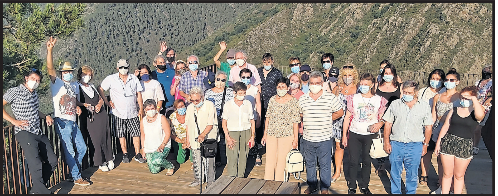
VIAJES TAMBRE. Excursión a los Cañones del Sil, visitando Ourense, Castro Caldelas, un paseo en catamarán por los Cañones del Sil y el Mirador do Duque.