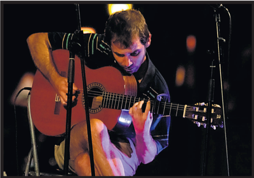
EN VIVO. El guitarrista del grupo Caldo durante el concierto nocturno