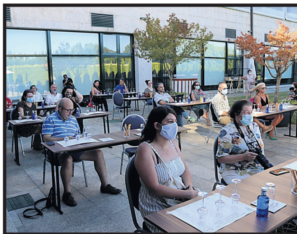
ORUJO DE GALICIA. Asistentes a la cita celebrada en el hotel Oca compostelano