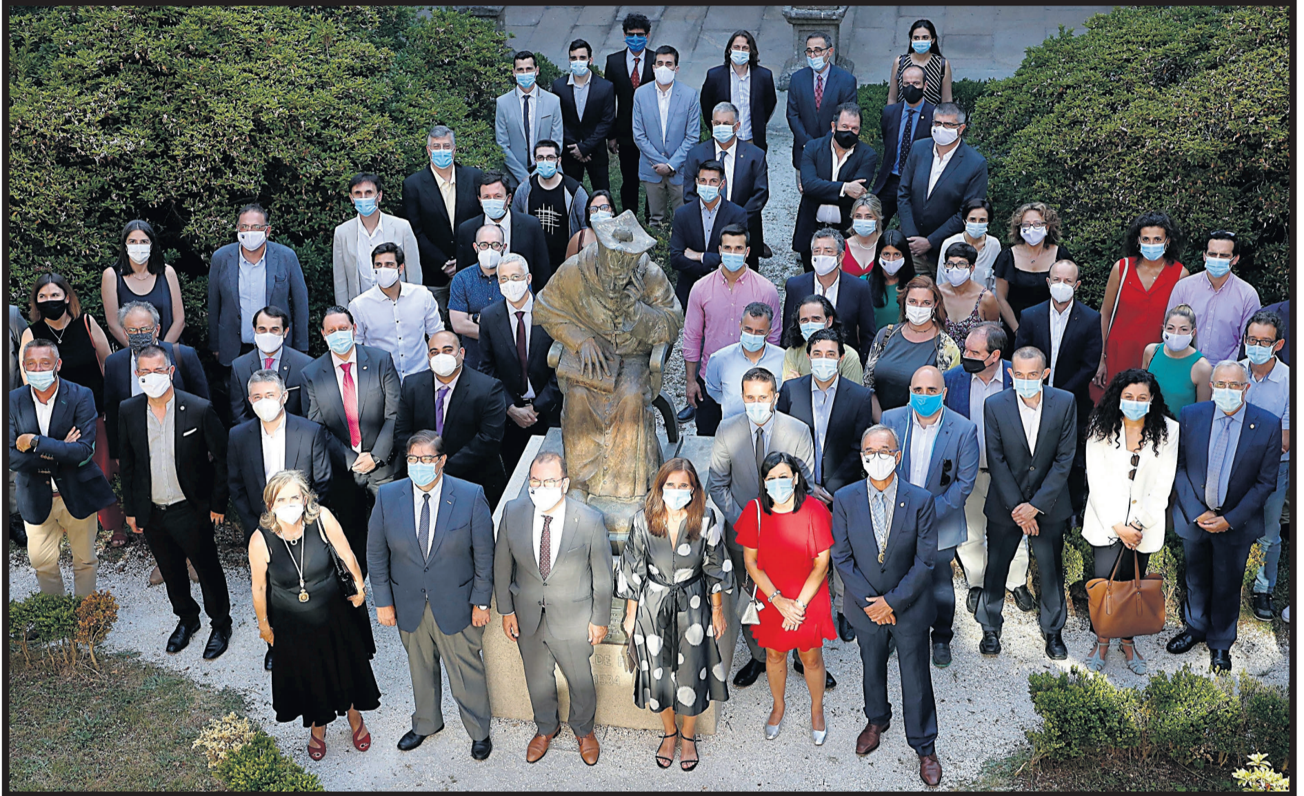
ASISTENTES. Foto de familia de autoridades y científicos reconocidos por la Real Academia Galega de Ciencias en el patio del Colexio de Fonseca donde se celebró el acto