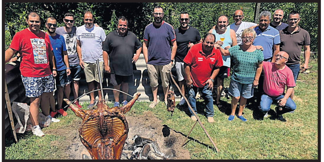
GRUPO DE LESTROVENSES durante la reunión para degustar el carnero ó espeto