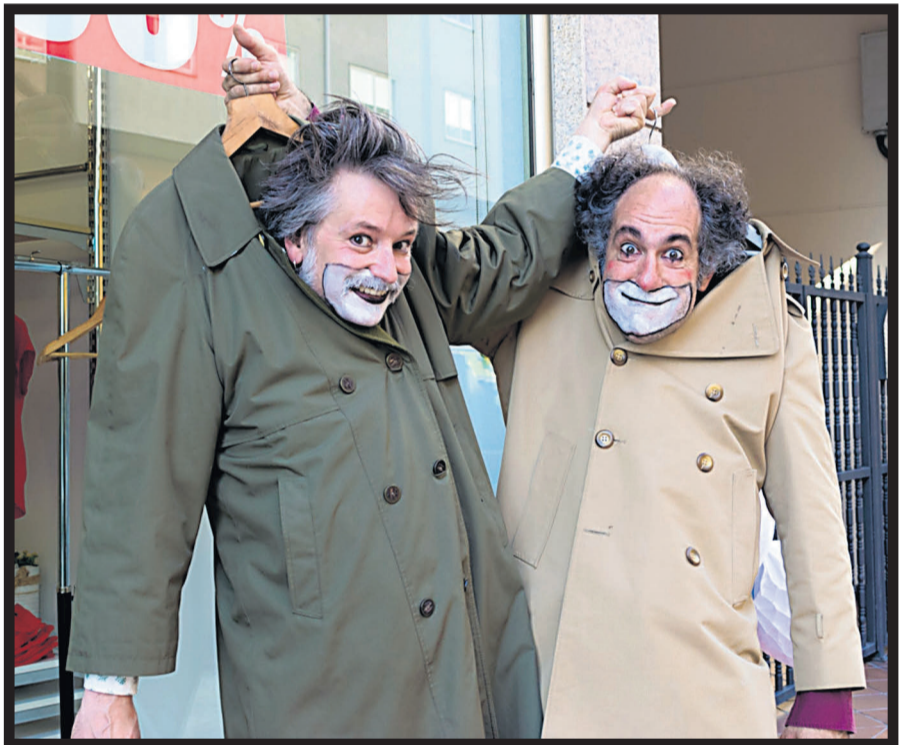
CAREVA. Miembros de la compañía escenificando la pieza teatral