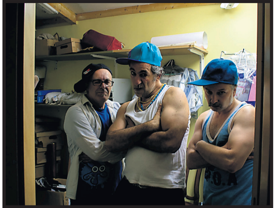
MAYZU. El trío fue uno de los participantes en la iniciativa teatral en escaparates