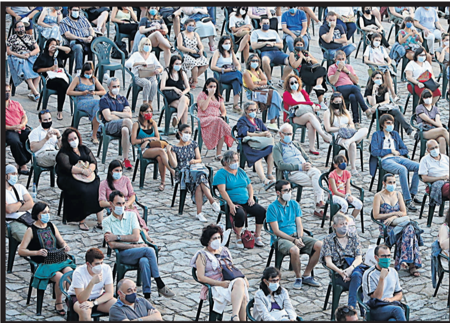
ASISTENTES. La praza do Obradoiro congregó a numerosas personas en el pregón