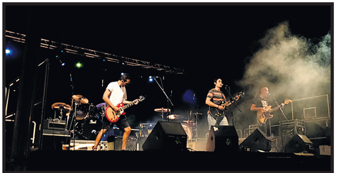
MADAME GUILLOTE. El grupo durante su concierto en Negreira, en el marco del Rock na Noite