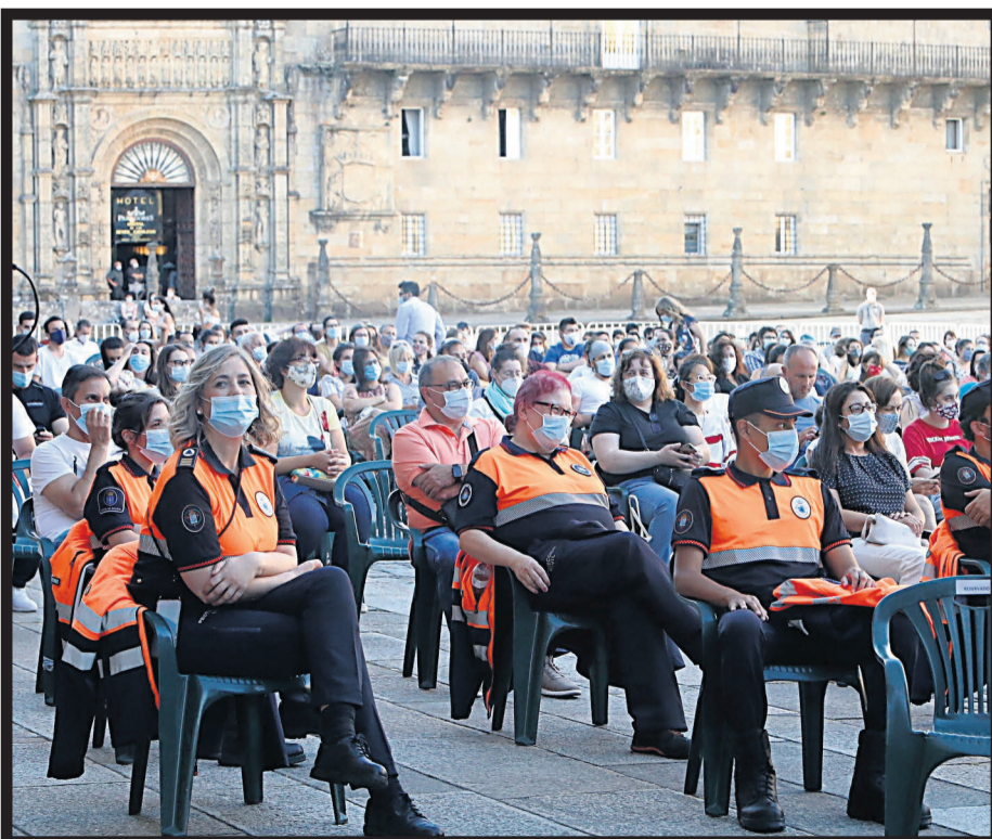
PROTECCIÓN CIVIL. Miembros de este colectivo en la praza do Obradoiro