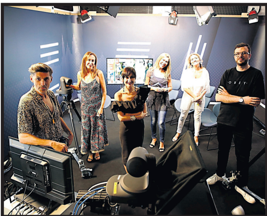
LAS NOCHES DE ANA. Los colaboradores en el último programa de la temporada