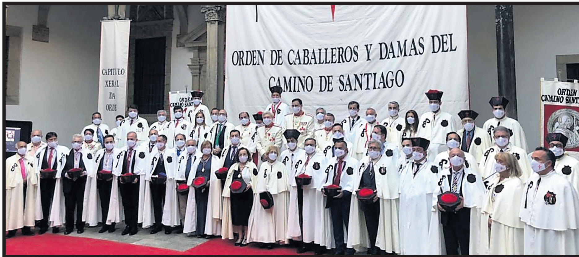
FOTO DE FAMILIA. Miembros de la Orden de Caballeros y Damas del Camino de Santiago durante su 24 capítulo general celebrado días atrás en la capital gallega