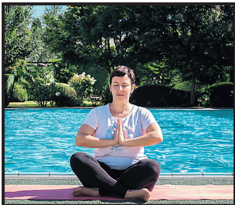
YOGA. El Oca Puerta del Camino ofrece yoga los sábados por la mañana