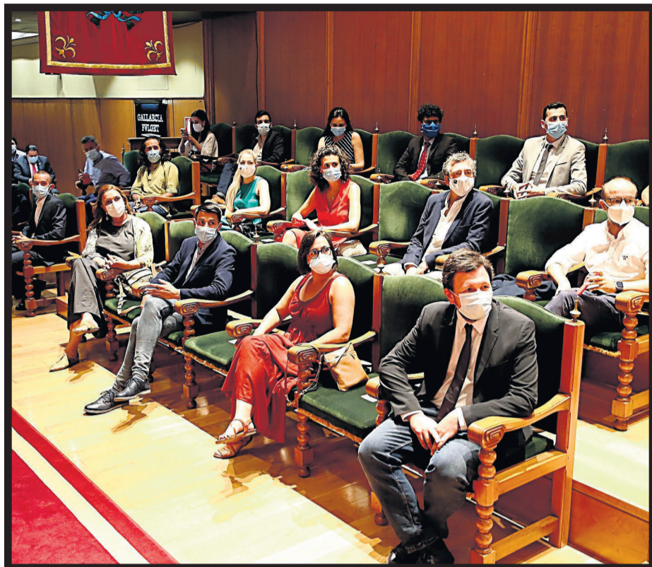
PAZO DE FONSECA. El salón noble acogió el acto de reconocimiento a los científicos y científicas por sus trabajos de investigación sobre el covid-19