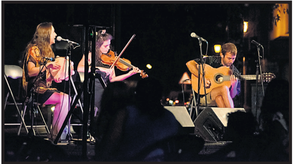
CALDO. El grupo de música durante la actuación en la praza da Mahía de Bertamiráns